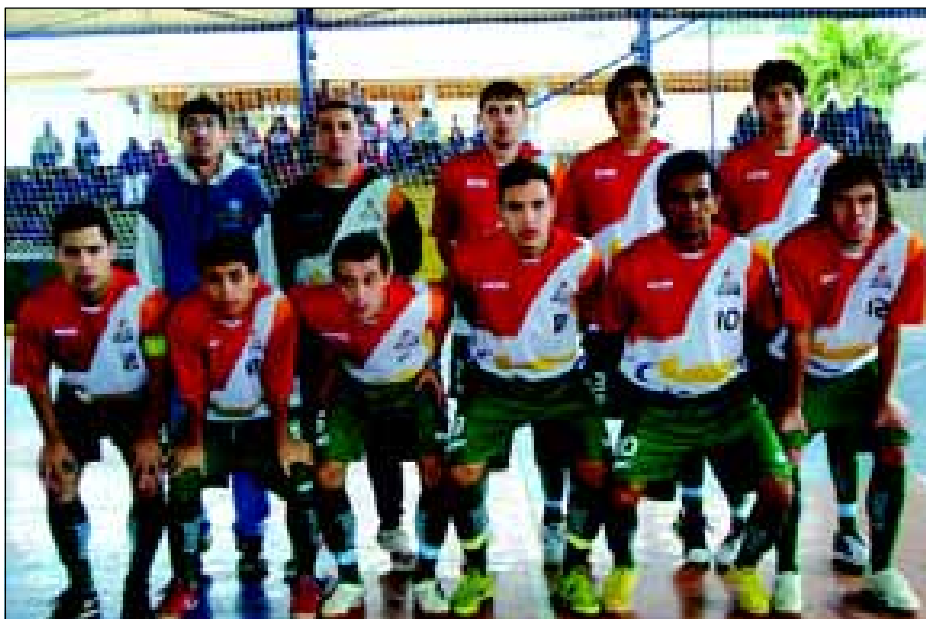
Futsal de Avaré foi eliminado nos pênaltis

As equipes dos esportes coletivos de Avaré conseguiram bons resultados nos Jogos Regionais de São Roque. Até a última quinta-feira, As equipes da Secretaria Municipal de Esportes (SEME) já tinha obtido medalhas nas modalidades de damas e handebol masculino. Mas ainda há a possibilidade de conseguir bons resultados no xadrez e no tênis de mesa, que serão decididos neste fim de semana.