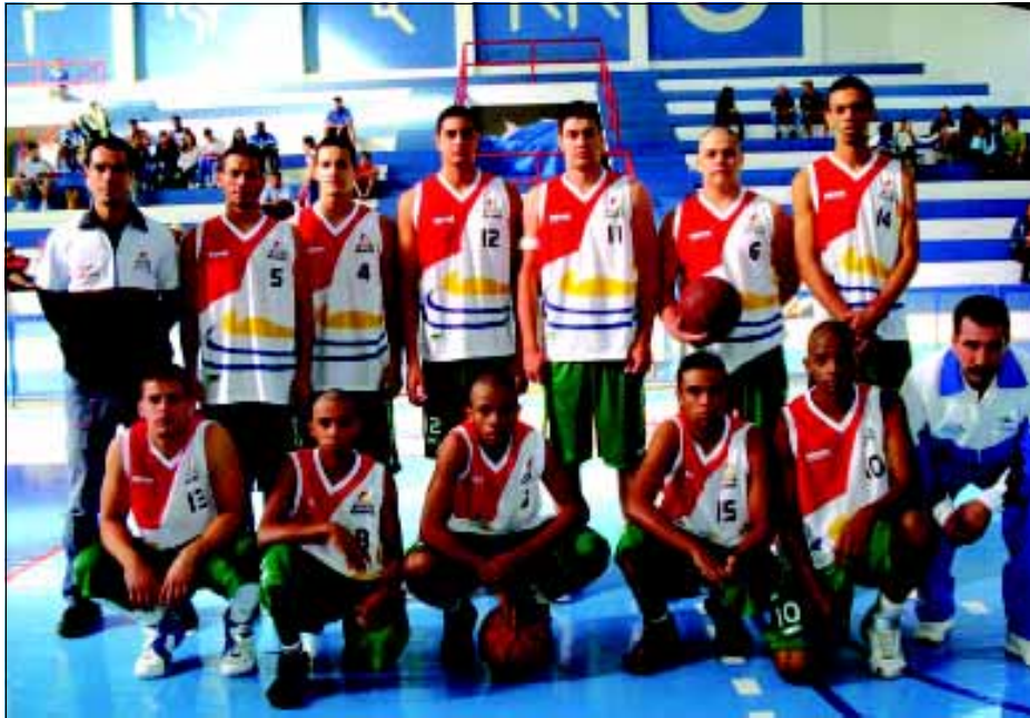
Basquete masculino ficou com o 4º lugar