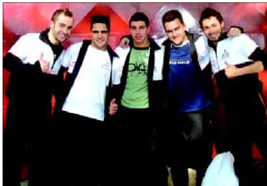
Equipe avareense de Ginástica Artística ficou em segundo lugar no geral

A Ginástica Artística masculina foi uma das principais modalidades em que Avaré participou nos Jogos Regionais, que estão acontecendo na cidade de São Roque. No total foram 11 medalhas, sendo três de ouro, quatro de prata e quatro de bronze. Na classificação geral Avaré ficou com a segunda colocação. As provas aconteceram nos dias 7 e 8 de julho.