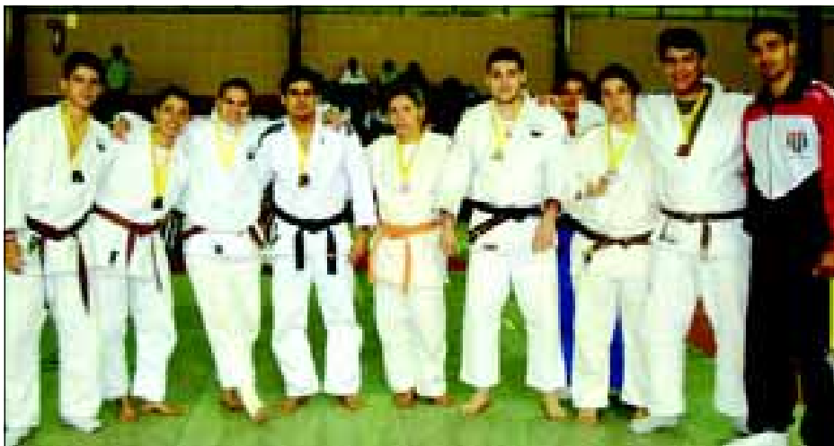
Judô de Avaré conseguiu 8 medalhas

Mais uma vez o judô de Avaré foi um dos destaques dos Jogos Regionais. Em São Roque a equipe avareense conseguiu oito medalhas, sendo seis de bronze e duas de prata.