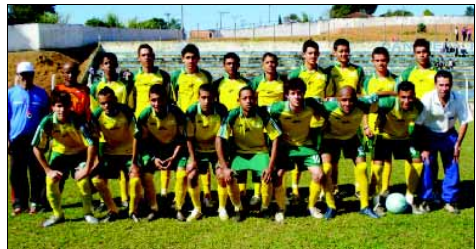
Futebol fez uma grande participação

ficando com o 4º lugar. Na primeira fase não teve muito trabalho para passar por Itapeva (71x17) e Araçariguma (72x55). Nas quartas de final enfrentou São Roque, os donos da casa, e venceu por 88x83. Na semifinal enfrentou a forte equipe de Jundiaí e perdeu por 72x49. Com isso teve que disputar a medalha de bronze contra Votorantim, mas acabou perdendo por 59x40. No