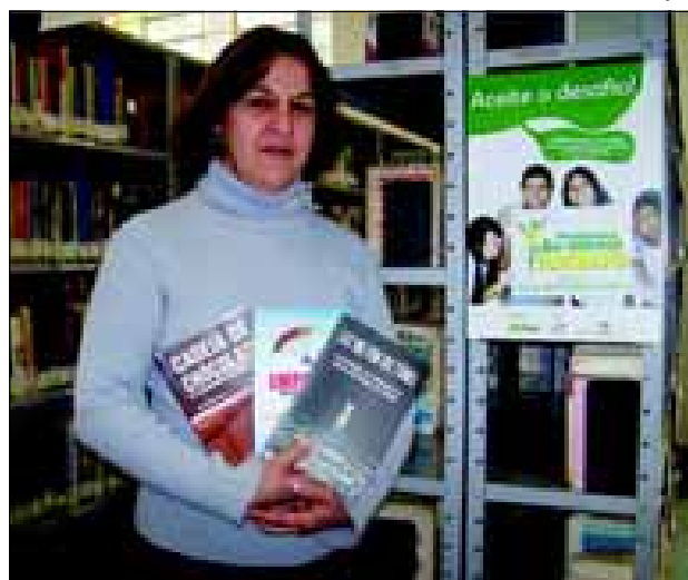
A bibliotecária informa que já se encontra a disposição dos interessados o regulamento de participação e os livros envolvidos neste programa

Maiores informações poderão ser vistas no site www.ibim.org.br