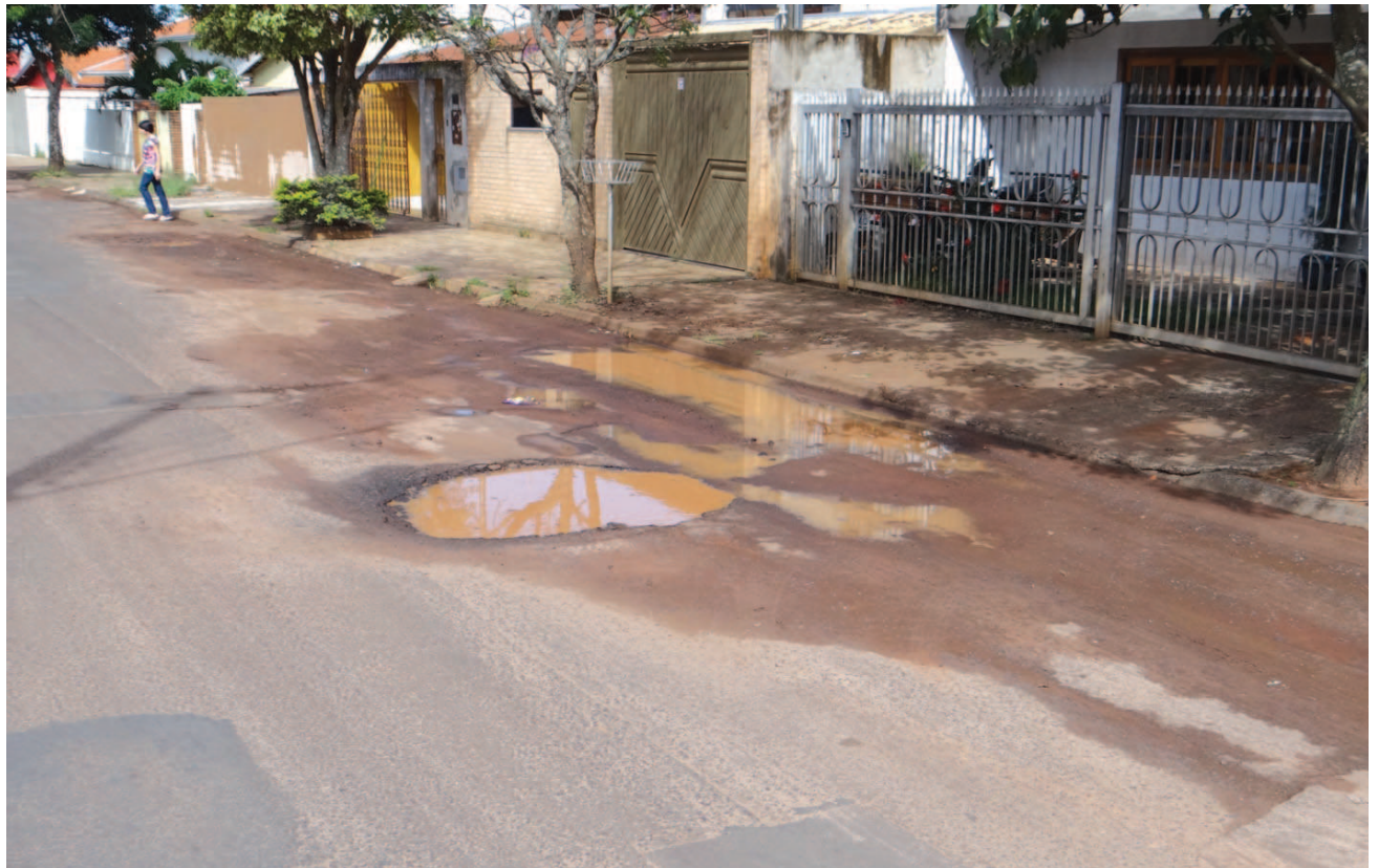
Rua no bairro Presidencial tomada pelos buracos

Há necessidade de roçada/capina em muitas áreas urbanas e na recuperação de vias esburacadas. A idéia é fazer um dossiê detalhado, passando por todas as áreas da cidade, e reparar, aos poucos, os problemas com obras pontuais.