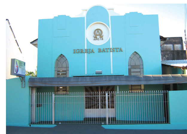
Fachada da Igreja Batista Novo Caminhar, na Rua Distrito Federal, no centro de Avaré

ção Batista Brasileira, a Igreja Central de Avaré, hoje chamada de Novo Caminhar, teve o seu templo próprio erguido na Rua Distrito Federal, no início dos anos 1960, segundo projeto do engenheiro Gilberto de Azevedo Maio.