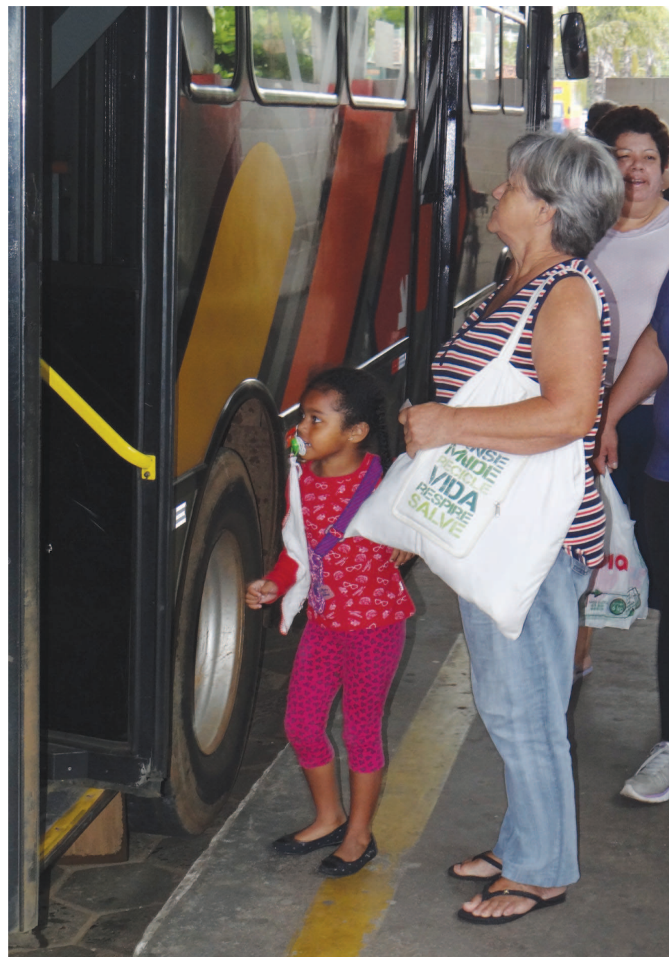
A acessibilidade de idosos e deficientes foi discutida durante reunião entre setores da Prefeitura e a Rápido Campinas Ltda.

Mais informações sobre o setor podem ser fornecidas no Departamento Municipal de Trânsito (Demutran) pelo telefone 3711-2557 ou na Secretaria de Direitos da Pessoa com Deficiência (3732-8844).