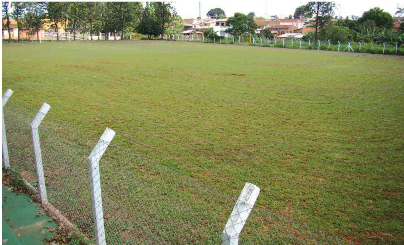
Os campos que receberão os jogos do Campeonato Internacional de Futebol ganharão manutenção das equipes da Prefeitura

Os jogos serão disputados nos campos do Jardim Paineiras, do Municipal, do São Pedro, do Fluminense, da Vila Jardim e do América, os quais vão passar por melhorias nas próximas semanas, incluindo capina, reparos nos gramados. Mais detalhes pelo telefone (14)3732-0756 (Esportes), durante horário comercial.