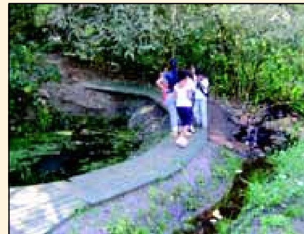
Crianças na trilha ecológica do CEEAv, no Parque Maclee, parceiro na iniciativa