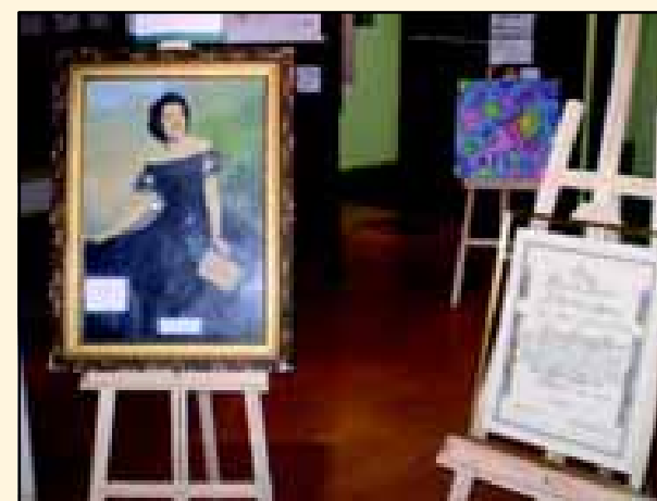
Exposição de arte durante a Semana da Mulher em