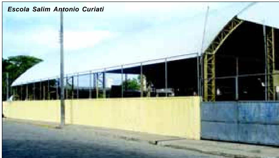
Escola Salim Antonio Curiati