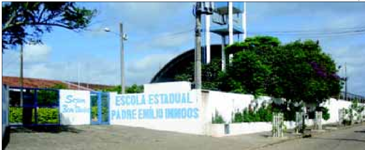
Escola Pe. Emílio Immos

Representantes da Secretaria Municipal de Educação receberam a informação com muita alegria, pois são medidas necessárias para melhorar as condições físicas dos prédios que abrigam juntos centenas de alunos.