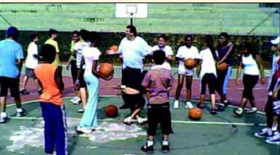
Alunos das escolas públicas tendo aula no Projeto Basquete para todos da Faculdade de Educação Física da Frea

contos nacionais, como por exemplo, do "31º Encontro Nacional de Física da Matéria Condensada", o maior evento de Física no Brasil, realizado em 1978. Contando com