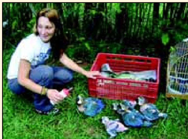
Aluna da faculdade de Biologia fazendo o manejo de aves apreendidas pela Polícia Florestal