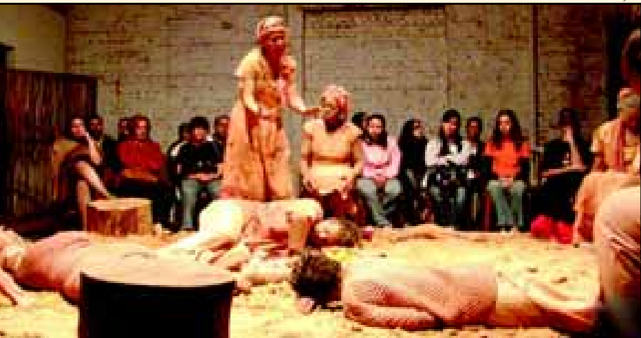
Festival de Teatro amador, promovido pela FREA com apoio da Secretaria Municipal com a participação de 20 grupos teatrais do Estado