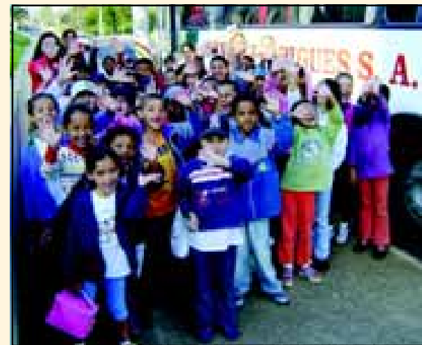
Alunos da Escola EMEF Maria Nazareth Abs Pimentel em cam para visita ao CETAS da F