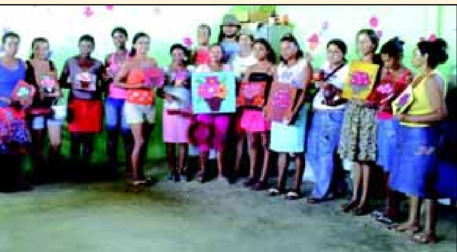
Alunos da FREA em comunidade do Pará no Projeto Rondon 2008