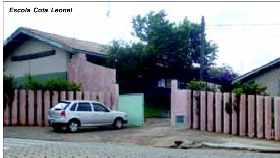
Escola Cota Leonel