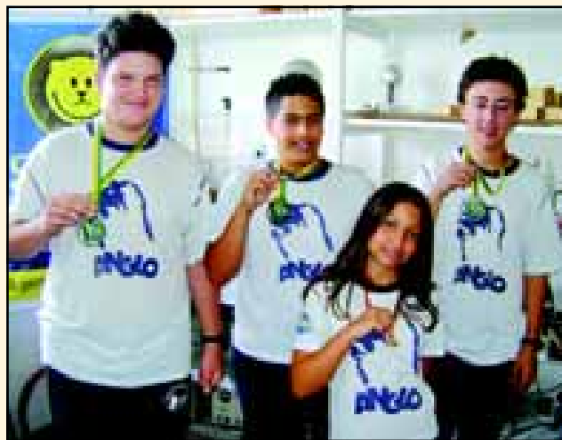
Alunos premiados nas Olimpíadas

entais de Avaré, que já recebeu mais de 1.500 alunos da rede pública municipal para aulas de educação ambiental e passeios pela trilha ecológica na mata. É a FREA atuante junto à população mais carente da cidade, trabalhando pela forma-