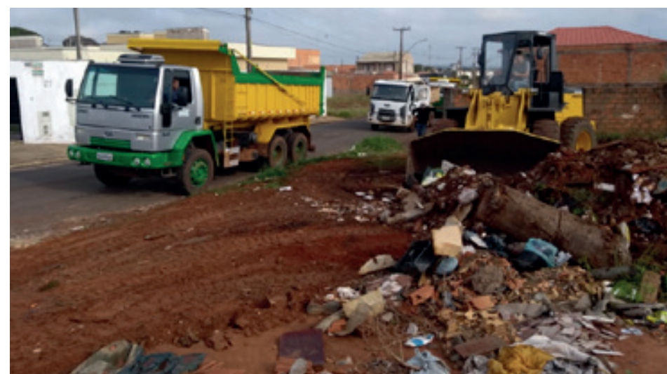
LIMPEZA - JD. CALIFÓRNIA