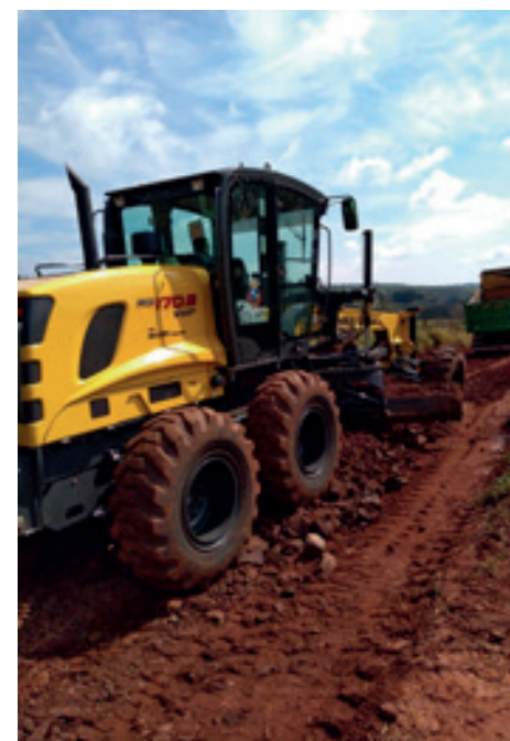
ESTRADAS RURAIS - CASCALHAMENTO - 3 COQUEIROS

Na estrada do 3 Coqueiros, maquinários pesados estão corrigindo o leito e aplicando o cascalhamento por toda a via. No Jardim Califórnia, a Prefeitura retirou grande quantidade de lixo e entulho acumulado em área verde.