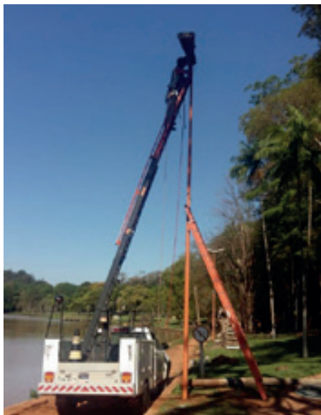
TROCA DE POSTES DE ILUMINAÇÃO - HORTO FLORESTAL

A Prefeitura de Avaré vem promovendo constantes melhorias por toda a cidade. No bairro Camargo, além da limpeza de locais com grande concentração de entulhos, funcionários da Secretaria de Serviços percorreram as ruas do bairro com a operação Tapa Buracos.