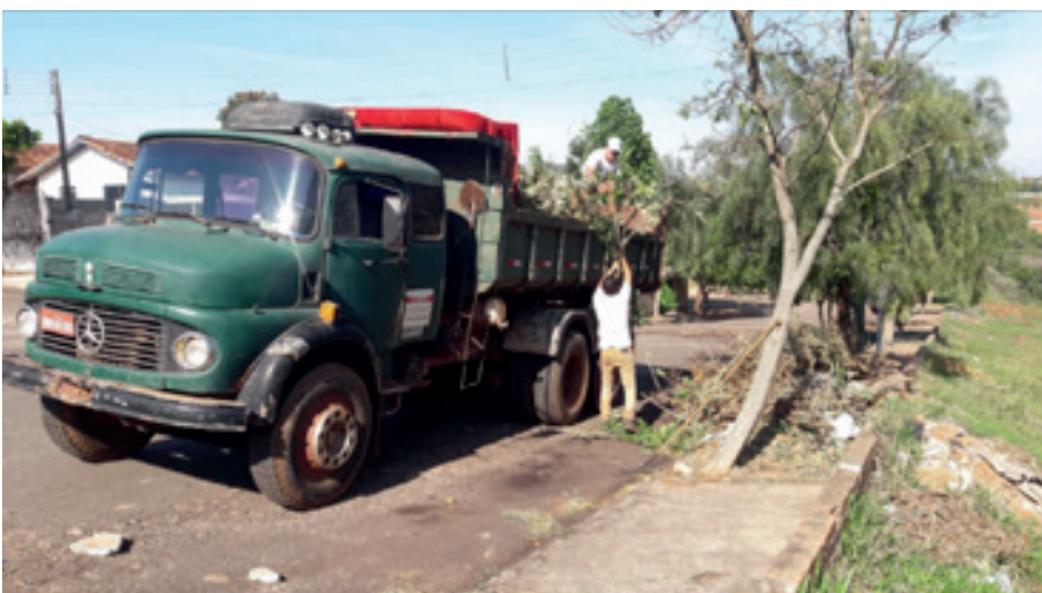
LIMPEZA - CAMARGO