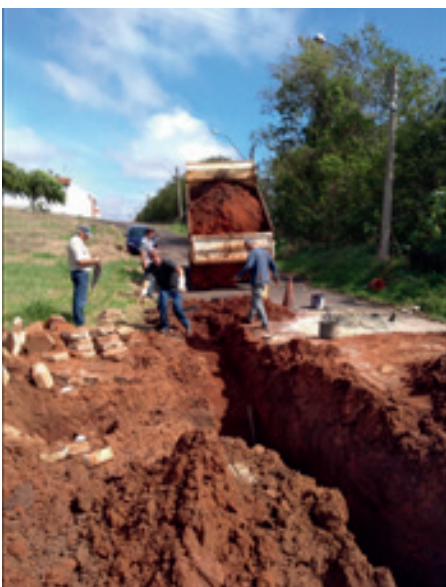
GALERIA - EROSÃO - AVARÉ 1