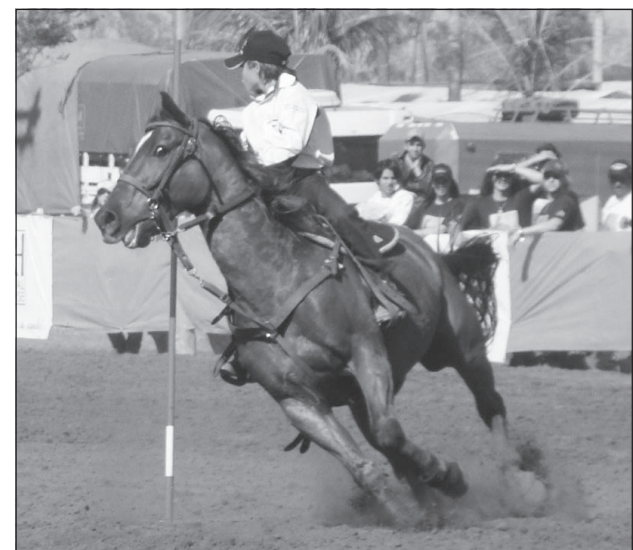
Competições acontecem até amanhã

dos plantéis, onde serão ofertados mais de 200 animais de várias linhagens da raça. Na sexta-feira, 29/4, a programação foi em dose dupla: às 16 horas ocorreu o Leilão Four Friends ( www.wvleiloes.com.br ) e às 20h30 o Leilão Select Sale ( www.mbleiloes.com.br ). E, encerrando o ciclo de comercialização, ocorrerá na tarde de hoje, às 18 horas, o Leilão ZD & EK ( www.wvleiloes.com.br ).