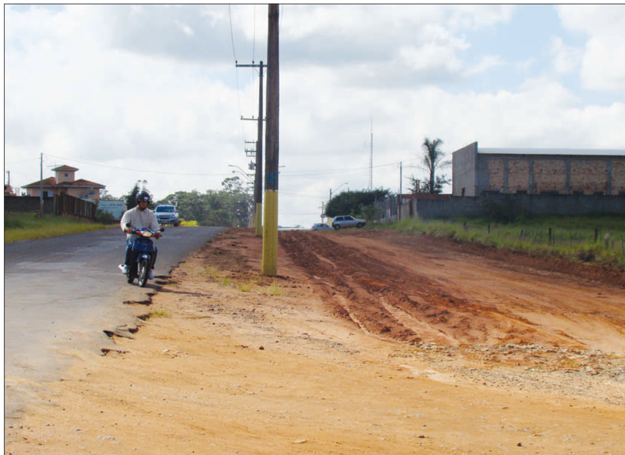
Avenida Governador Mário Covas será duplicada

Para a recuperação da Avenida Espanha foi feito um projeto para restaurar toda a galeria de águas pluviais. O custo da obra será de R$ 221 mil e faz parte dos primeiros R$ 100 mil para início das obras da Operação Tapa Buracos, que terá início no dia 10 de maio, coincidindo com a chegada da verba anunciada de R$ 1.040.000,00 que Avaré irá receber do governo federal.