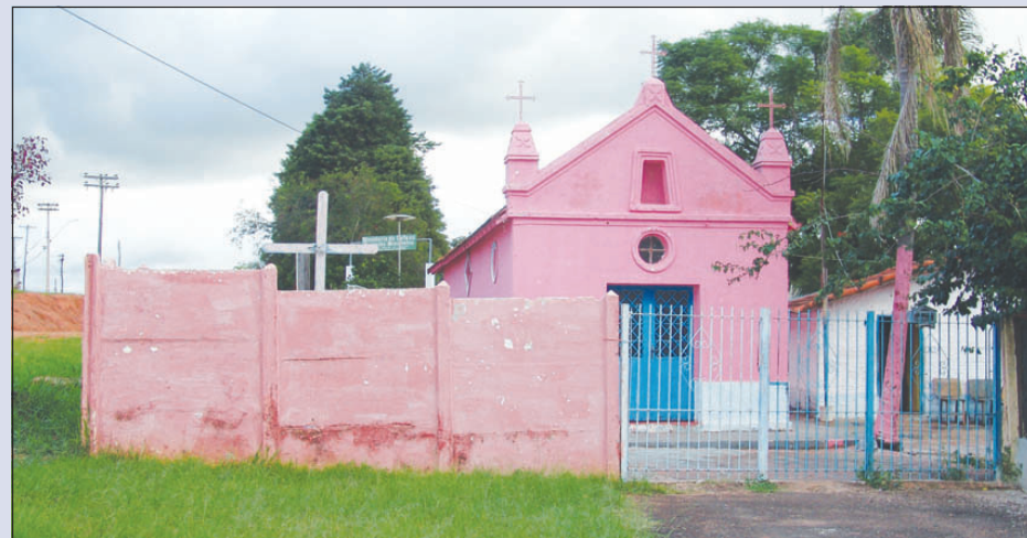
Capela da Santa Cruz de Ana Rosa: atrativo turístico em Botucatu