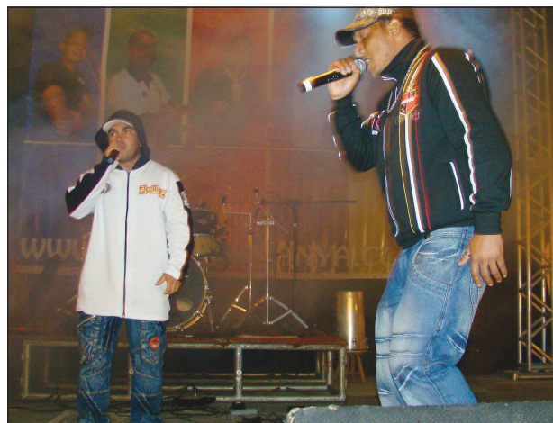
Grupo de Rap Quadrilha Formada

Comemorado no dia 1º de maio, o Dia do Trabalho ou Dia do Trabalhador é uma data comemorativa usada para celebrar as conquistas