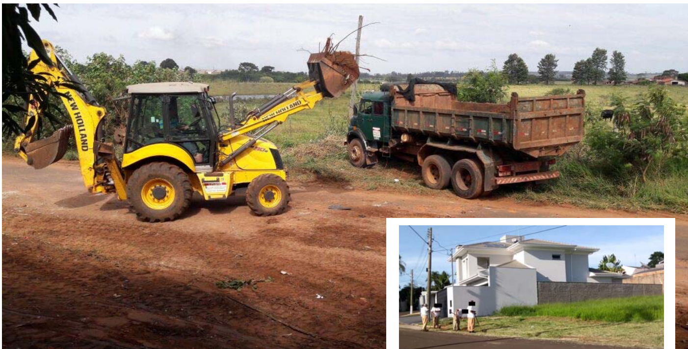
Presidencial e Green Village

Os bairros Di Fiori, Green Village, Paineiras, Jardim Presidencial e Bairro Alto receberam, na semana que passou, uma verdadeira faxina: praças, áreas verdes, guias, vielas, calçadas e roçadas foram limpas pelas equipes da Secretaria de Serviço. Páginas 10 e 11