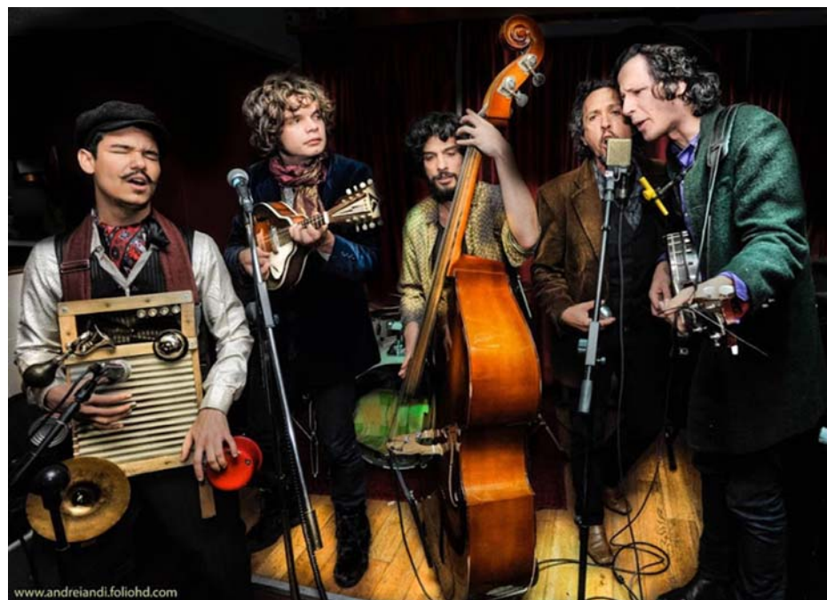
Quinteto “Mustache e os Apaches” animará o Largo São João

“O Largo São João estará em ebulição artística! Esperamos a participação dos avareenses nessa grande confraternização cultural. Vamos conectar sentidos e ideias, para que juntos, miremos um circuito coletivo de artes e pessoas para a cidade”, frisou um dos representantes do município.