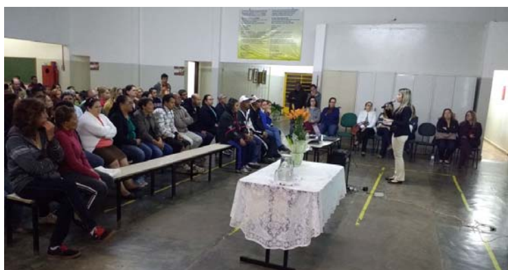
Discentes assistem a mais uma palestra

Debate tratou sobre o uso excessivo de álcool e drogas