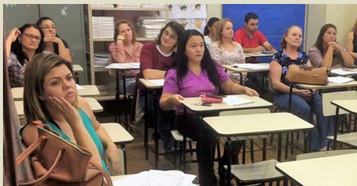
Professores e equipe pedagógica da rede municipal se reúnem

O encontro discutiu quais são as necessidades para o processo de alfabetização