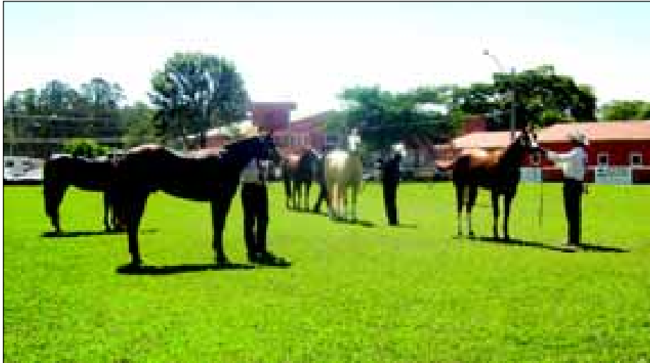
No ano passado o evento atraiu 3.285 inscrições e 1,5 mil cavalos

No ano passado, o Congresso também ocorreu em Avaré e atraiu 3.285 inscrições e