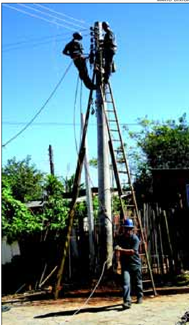
Postes estão sendo readequados

Depois de pavimentar as ruas do Bairro Recanto da Biquinha, alguns postes tiveram que ser recolocados. Sendo assim, a empresa concessionária de energia elétrica em Avaré executou o serviço para a comodidade dos moradores locais.