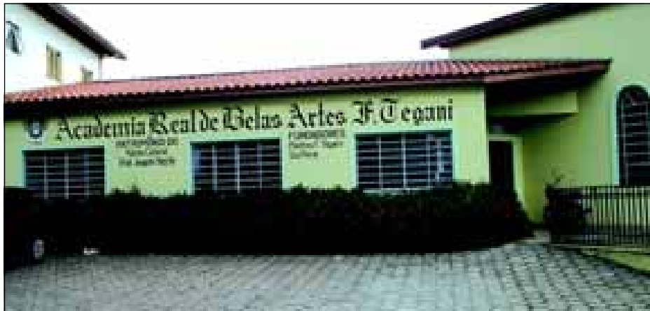
Prédio foi alugado recentemente pela Prefeitura

Buscando incentivar as entidades em formação, a Prefeitura da Estância Turística de Avaré, está disponibilizando uma nova sede para a Associação dos Deficientes Físicos de Avaré.