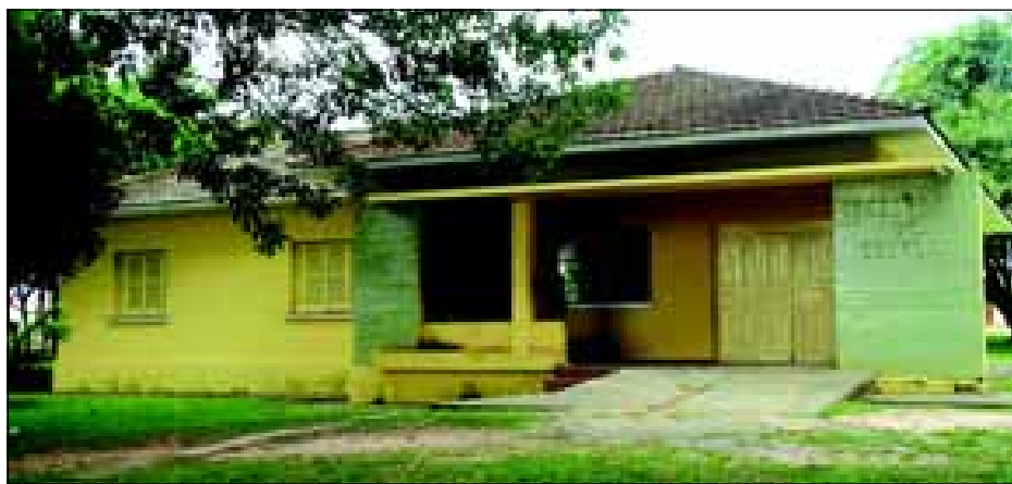
No local poderá ser expedida carteira de identidade sem burocracia

No início do mês de abril a população de Avaré passará a contar com mais um serviço prestado pela Delegacia Seccional de Avaré, em parceria com a Prefeitura da Estância Turística de Avaré. Trata-se da Delegacia Eletrônica, que funcionará nas dependências da antiga CAIC. O local abrigará também o Instituto de Identificação Ricardo Gumbleton Daunt, que facilitará a expedição da carteira de