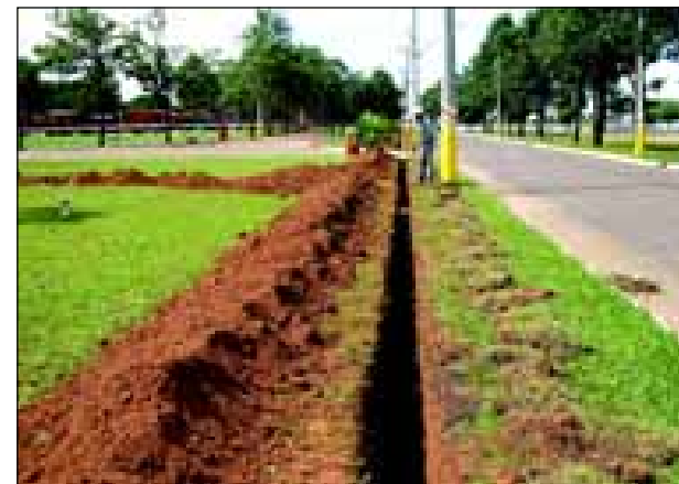
Implantação de nova rede de esgoto no Recinto

A Prefeitura da Estância Turística de Avaré está trabalhando para a ampliação da rede de esgoto do Parque de Exposições Fernando Cruz Pimentel (Recinto da Emapa). Para isso estão sendo abertas valas por onde passará a tubulação.