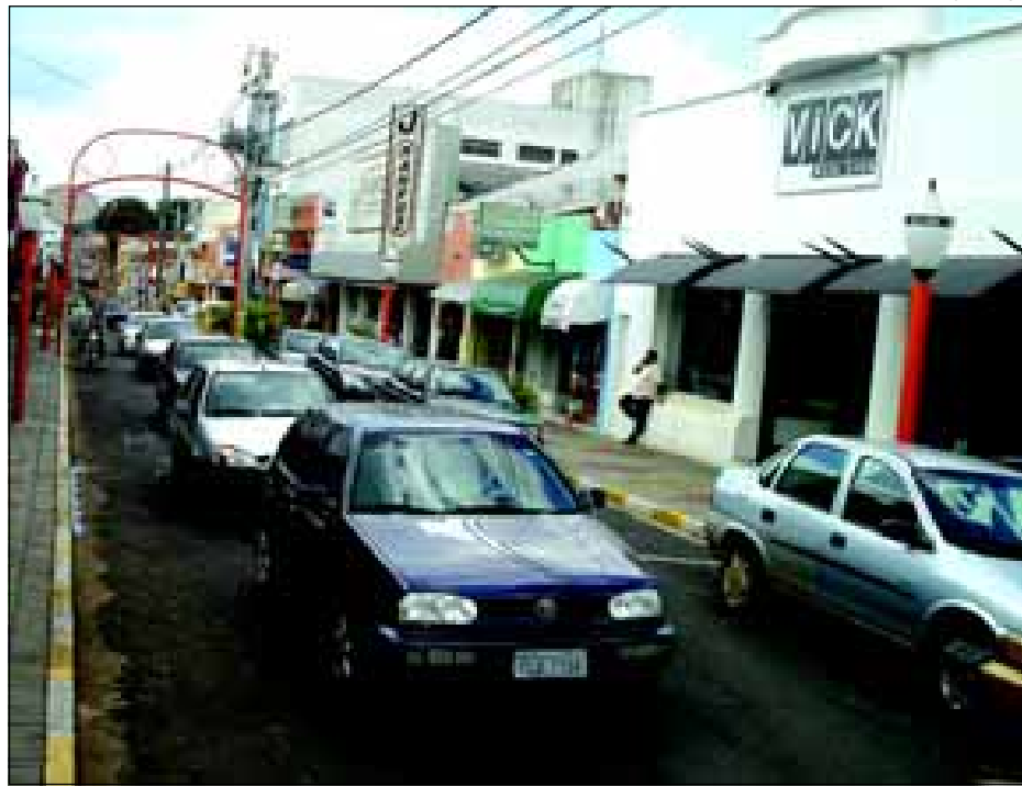
Demutran tem orientado o motorista que está mais consciente

atuação do Demutran, órgão vinculado a Secretaria Municipal dos Transportes e Sistema Viário. A partir de 2005 foi implementada uma série de ações visando a orientação e conscientização dos motoristas. Como exemplo é possível destacar as cartilhas distribuídas com informações importantes. Além disso foi implantada a figura do agente de trânsito, que não tem como função principal multar, mas sim orientar os motoristas para que o trânsito possa fluir normalmente e evitar que cometam infrações.