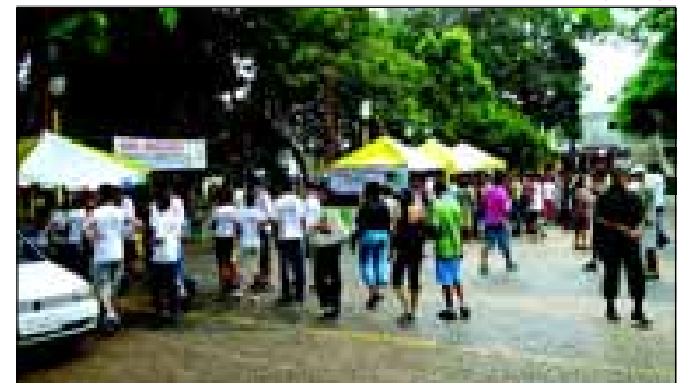
Realização do evento foi possível graças as parcerias

A Secretaria Municipal do Meio Ambiente realizou na última quinta- feira (dia 22/03) uma mobilização no Largo São João. O evento aconteceu em comemoração ao Dia Mundial da Água, comemorado neste dia.