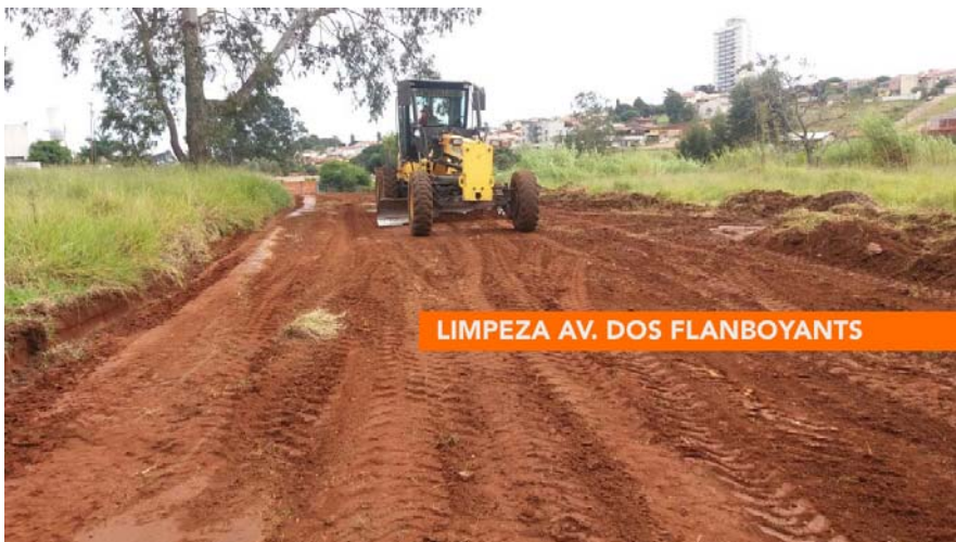
LIMPEZA AV. DOS FLANBOYANTS