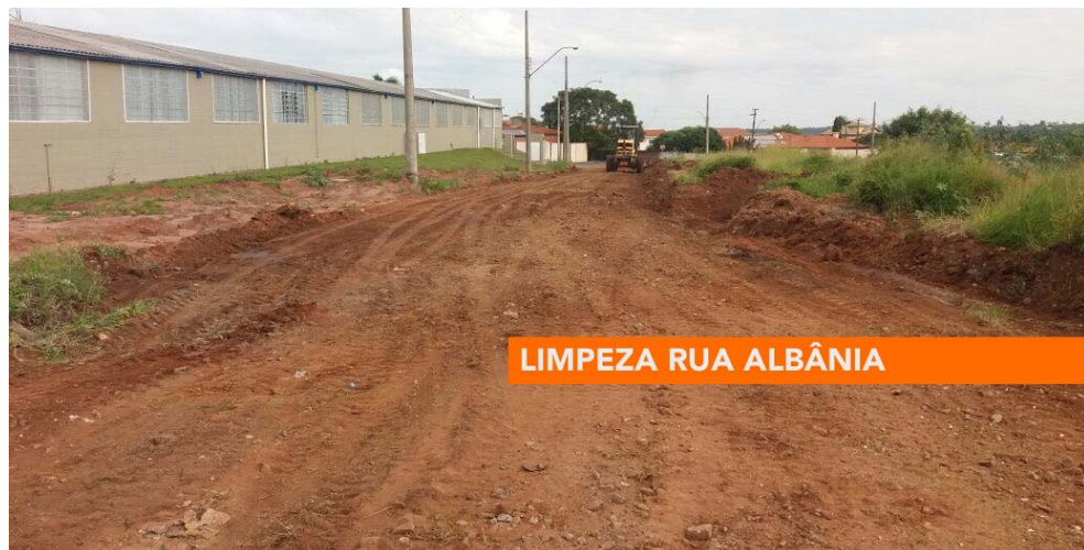
LIMPEZA RUA ALBÂNIA

A Secretaria de Serviços da Prefeitura de Avaré limpou áreas públicas e permitiu o acesso às ruas isoladas pelo mato.