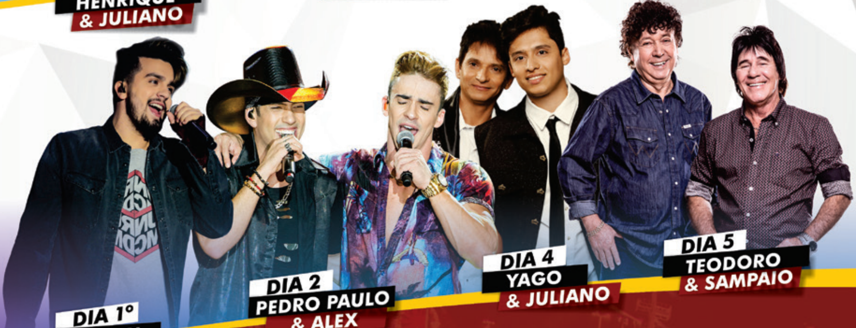
DIA 1º LUAN SANTANA