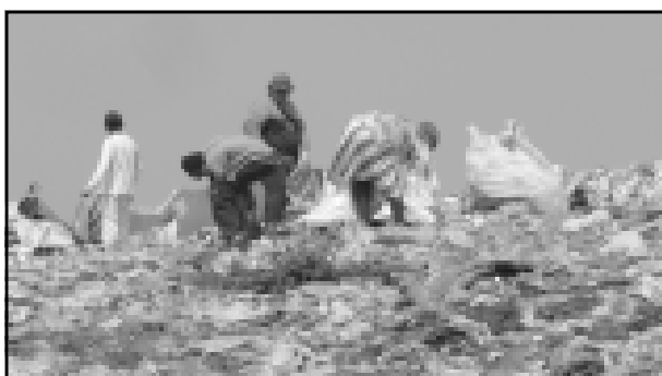
Catadores que estão no Lixão passarão a fazer parte da Unicoop

A Prefeitura está incentivando a Unicoop possibilitando assistência técnica a cooperativa para que ela seja legalizada, além de também ceder um caminhão para colaborar na coleta do material reciclável. A Prefeitura estará auxiliando a cooperativa até que ela possa prosseguir com seus próprios recursos.