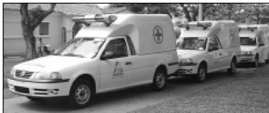
Novos veículos – A Prefeitura da Estância Turística de Avaré adquiriu novos veículos que serão utilizados pelo Corpo de Bombeiros e pela Saúde. São veículos 0km todos equipados para o melhor atendimento emergencial.