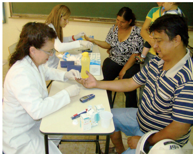
Exames como o teste da hepatite são realizados gratuitamente

Das 9h00 às 17h00, o Governo Municipal levará toda a sua estrutura e das Secretarias Municipais para atender às necessidades daquela localidade, com expedição de RG e outros documentos, esportes e eventos culturais, ori-