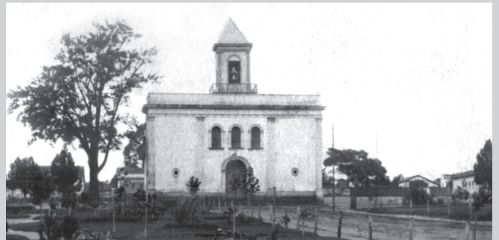
A 1ª Igreja Matriz em registro fotográfico do final do século XIX

“De um lado da Vila, ao sul, ergue-se em lugar elevado a capelinha de Santa Cruz, onde algumas