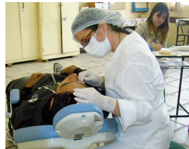
Serviço odontológico, tratando da saúde bucal da população

O projeto é um grande facilitador, por permitir à população, a quebra de barreiras burocráticas e o intercâmbio com todos os