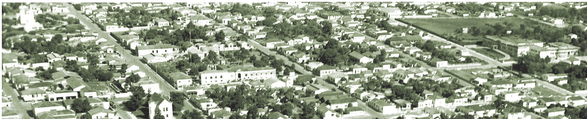
Panorâmica do centro histórico em 1961: vê a Rua Mato Grosso e, à direita, as transversais Ruas Minas Gerais e Paraíba.