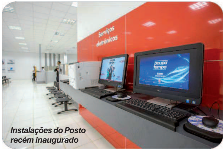
Instalações do Posto recém inaugurado

Atendimento na Avenida Major Rangel, 1800, ocorre de segunda a sexta-feira das 8 às 17h e aos sábados das 8 às 12h