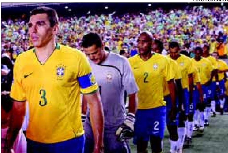
Seleção Brasileira entra em campo amanhã às 15h30

Uma mega estrutura será montada amanhã (domingo) no Largo São João para que os avareenses possam torcer para a Seleção Brasileira que enfrenta a equipe da Costa do Marfim a partir das 15h30. Um telão de LED de 200 polegadas, 21 m 2 , foi instalado em frente ao coreto com um sistema de sonorização moderno.