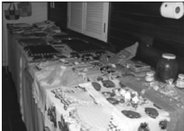
Variedades de produtos da Feirarte

A Feirarte (Feira de Artesanato de Avaré) terá exposição neste sábado e domingo, 19 e 20, respectivamente.