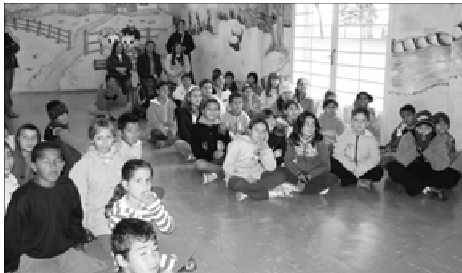
A fábula “A Roupas Nova do Rei” foi contada aos alunos da Escola “Suleide Maria”

um rei muito vaidoso, dois vigaristas chegam e apresentam-se como tecelões capazes de produzir os tecidos mais lindos, e também com uma característica peculiar: são invisíveis a pessoas estú-