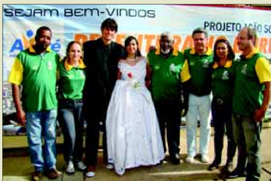
Equipe da Ouvidoria no último Prefeitura no Bairro