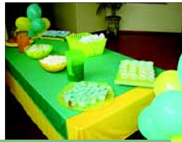
Decoração teve a seleção brasileira como tema

Em tempos de Copa do Mundo, o Brasil paralisa para torcer para a seleção brasileira. Os brasileiros fazem a festa, milhares enfeitam ruas, pintam os rostos; a torcida se agita, veste a camisa, bandeirinhas são colocadas nos veículos, todos se contagiavam.