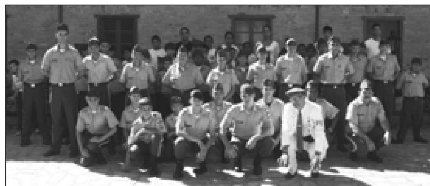
Alunos do curso de defesa pessoal

Na último dia 26, estiveram em Itu, os alunos do Projeto Defesa Pessoal, para visitarem o Quartel do Exército Brasileiro que fica na cidade.