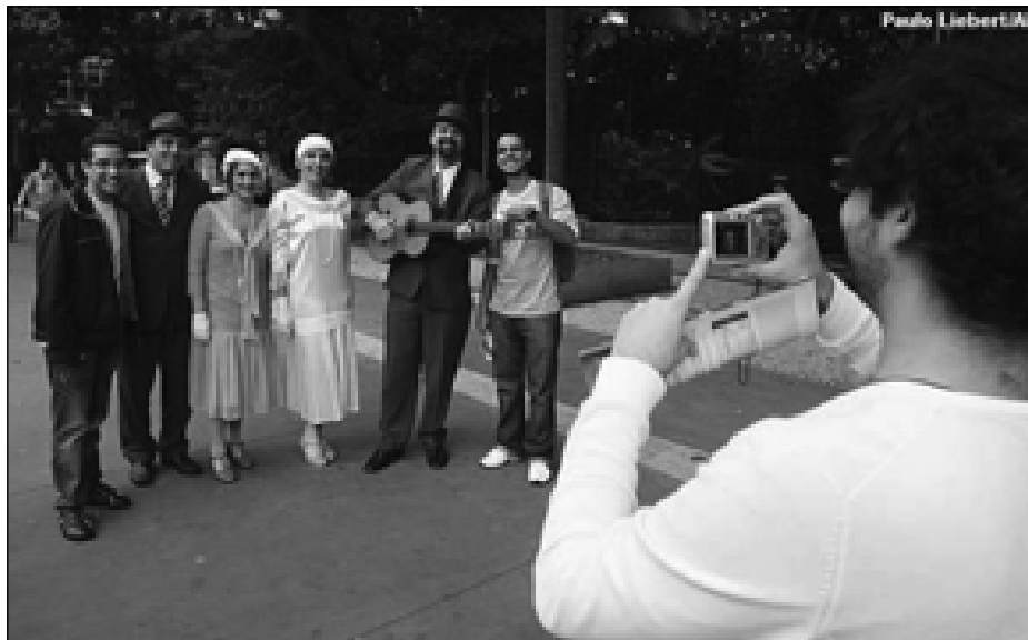
Trovadores são fotografados por fãs pelas ruas de São Paulo

de Avaré se juntaram por iniciativa de Maída, o grupo incrementou seu repertório de canções, aumentou substancialmente o cardápio de opções (de duetos a telegrafemas do amor) e multiplicou o número de apresentações. Agora, são 50 músicos, fazendo em média 400 apresentações por mês, a maioria aos sábados.