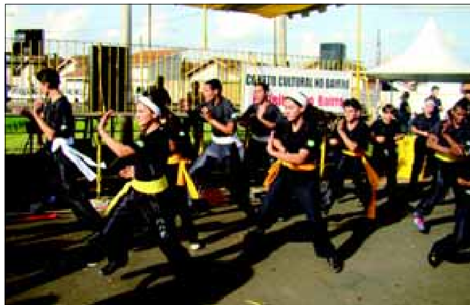
Apresentações de capoeira e kung fu acontecem durante o “Prefeitura no Bairro”

Os bairros Jardim Tropical e Jardim Paraíso foram escolhidos para a próxima edição do Projeto “Prefeitura no Bairro”, criado pela Ouvidoria Municipal, órgão vinculado ao gabinete do Paço Municipal. A escola “Professor Carlos Papa”, na Rua Zico de Castro nº 1235, sediará o evento que acontece hoje, das 9h00 às 17h00.