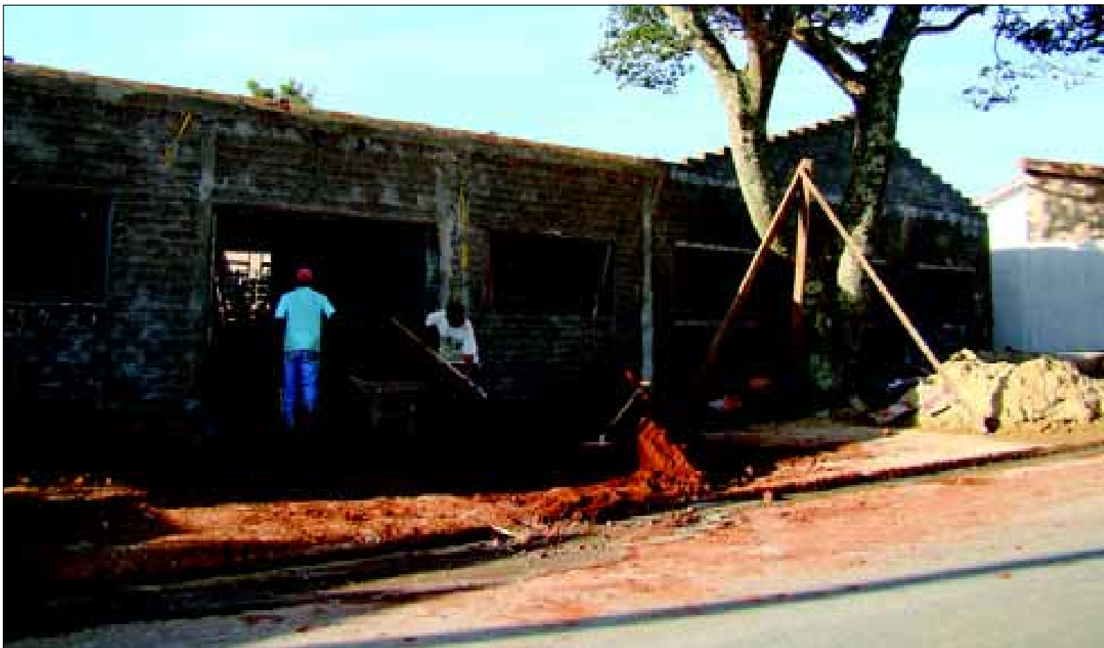
Obra da Creche do Bairro Camargo segue em ritmo acelerado

O local contará com pátio coberto, 6 salas divididas em jardim 1 e 2, uma sala maternal 1 e 2, berçário 1 e 2, refeitório, sanitários para alunos, sanitários para funcionários, cozinha, dispensa, lavanderia, solário, lactário, fraldário, sanitários adequados para deficientes físicos, pátio e jardim internos, e espaço para futuras ampliações.