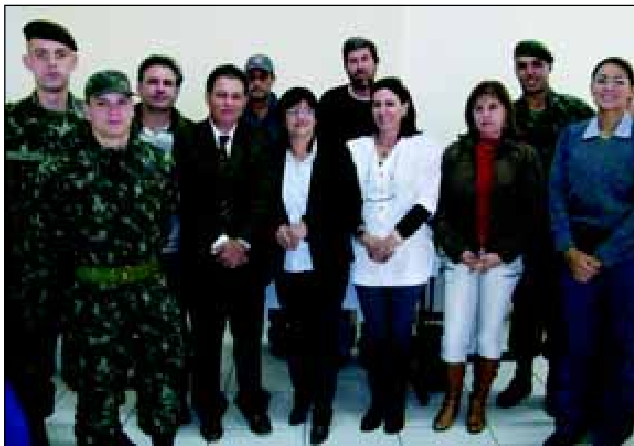
A reunião para definição da Campanha do Agasalho 2010 contou com representantes da Polícia Civil, Polícia Militar, Corpo de Bombeiros, NOCAIJA (Guarda Mirim), Tiro de Guerra e Sabesp

A reunião contou com representantes da Polícia Civil, Polícia Militar, Corpo de Bombeiros, NOCAIJA (Guarda Mirim), Tiro de Guerra e Sabesp, parceiros que fizeram com quem em 2009 a cidade batesse recorde em