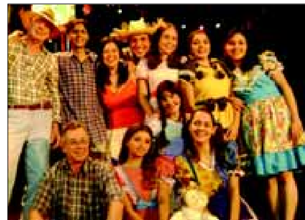
Parte do elenco da peça “O Auto do Amor Caipira”

Depois da apresentação do Sesc Santana, a peça viajará pelo Estado fazendo apresentações.