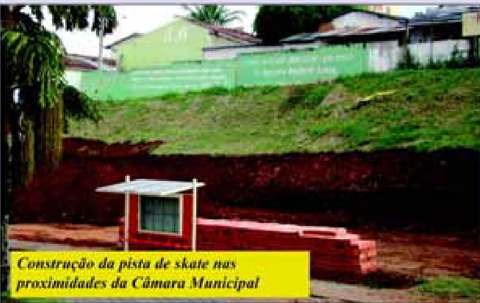
Construção da pista de skate nas proximidades da Câmara Municipal