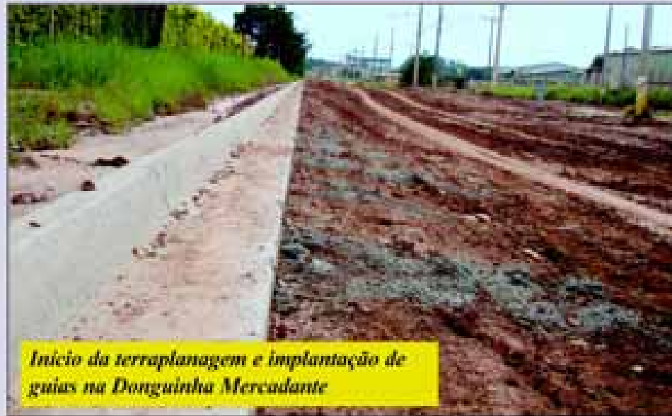
Início da terraplanagem e implantação de guias na Donguinha Mercadante