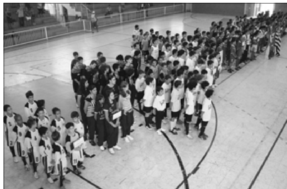
Garotada atenta à cerimônia de abertura da competição

Confira na próxima edição do Semanário Oficial os resultados das partidas já realizadas e a tabela da Copa Revelação de Futsal Menores.