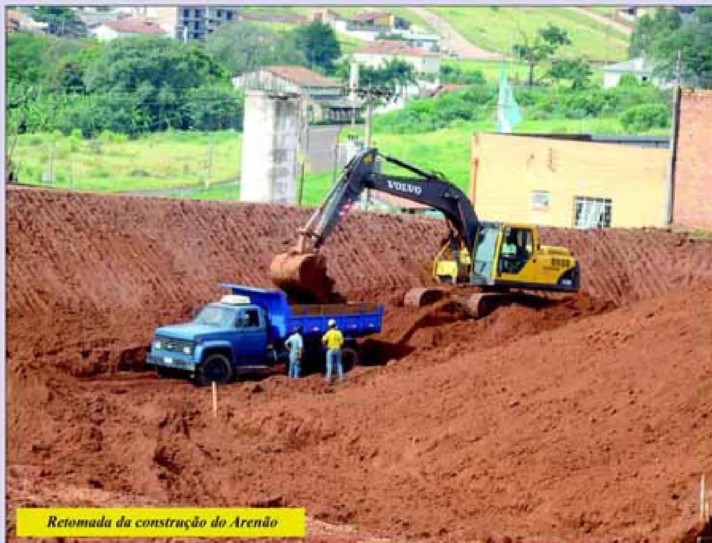
Retomada da construção do Arenão

Os contratos para a construção dos dois empreendimentos do Programa "Minha Casa, Minha Vida" foram assinados no início de janeiro pela Caixa Econômica Federal (CEF), a