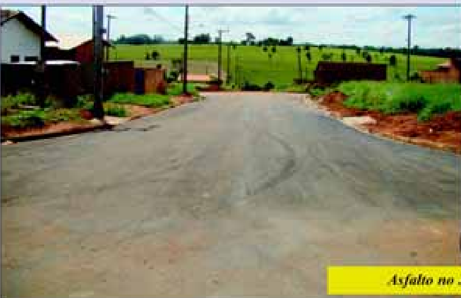
Asfalto no Jardim Paraíso