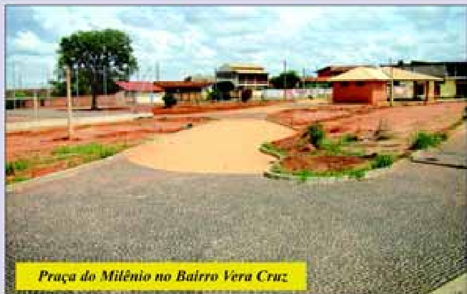
Praça do Milênio no Balneario Vera Cruz