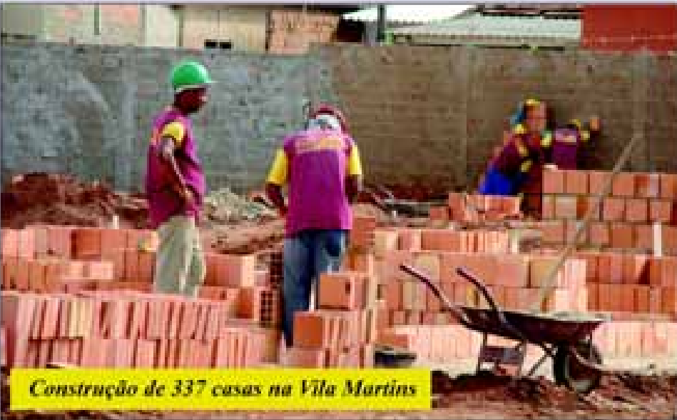
Construção de 337 casas na Vila Martins