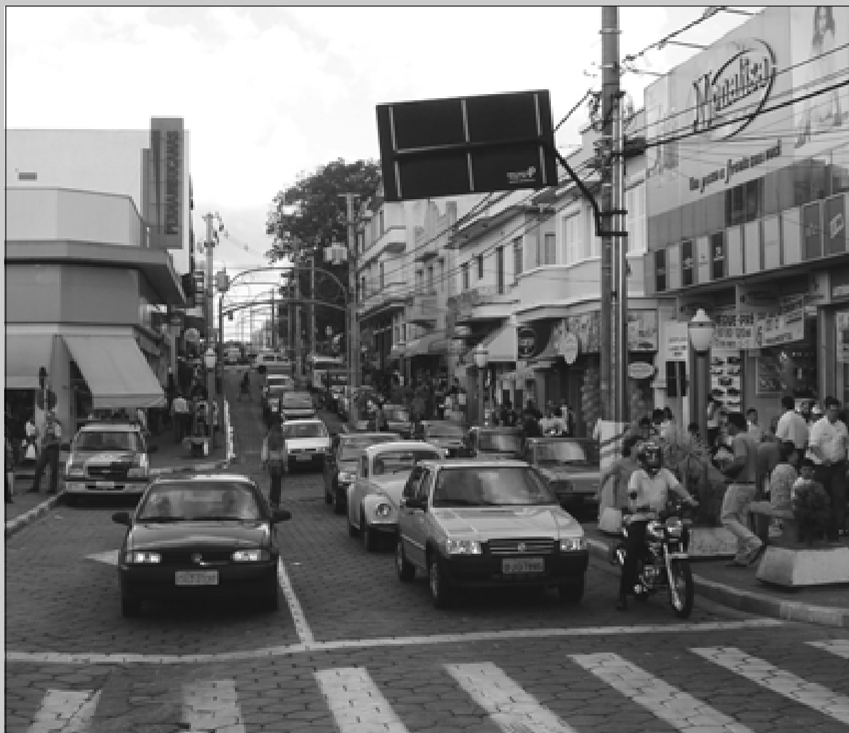
Rua Rio Grande do Sul