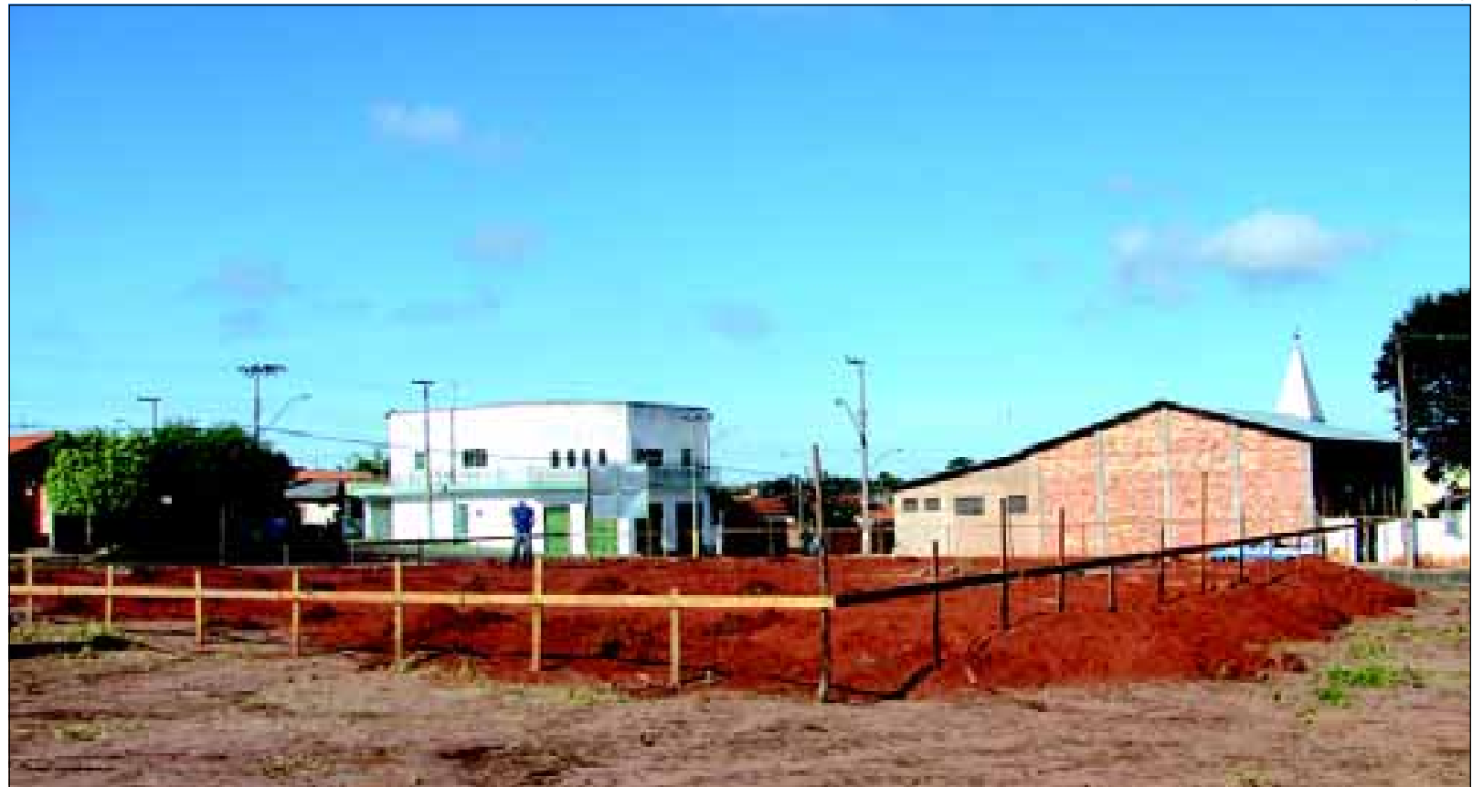
INÍCIO DA FUNDAÇÃO E ALICERCE DO NOVO PAS DO BAIRRO SANTA ELIZABETH

A área de abrangência de atendimento desta nova unidade de saúde é composta pelos bairros Santa Elizabeth I, II, III e IV, Vila Rio Novo, Jardim Brasil, Jardim Tropical, Jardim Paraíso, Vila São Sebastião, Jardim Paulistano, com aproximadamente