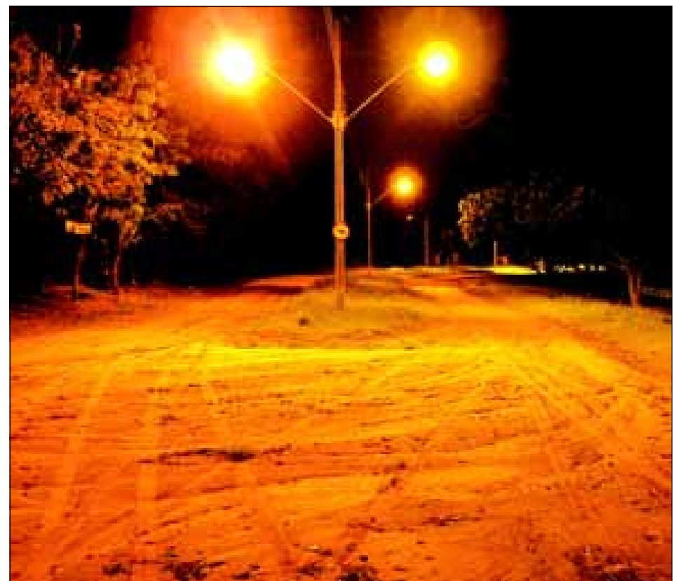
NO BAIRRO COSTA AZUL FORAM IMPLANTADAS NAS VIAS PRINCIPAIS, LUMINÁRIAS A VAPOR DE SÓDIO DE 250 WATS E 150 WATS NAS DEMAIS VIAS