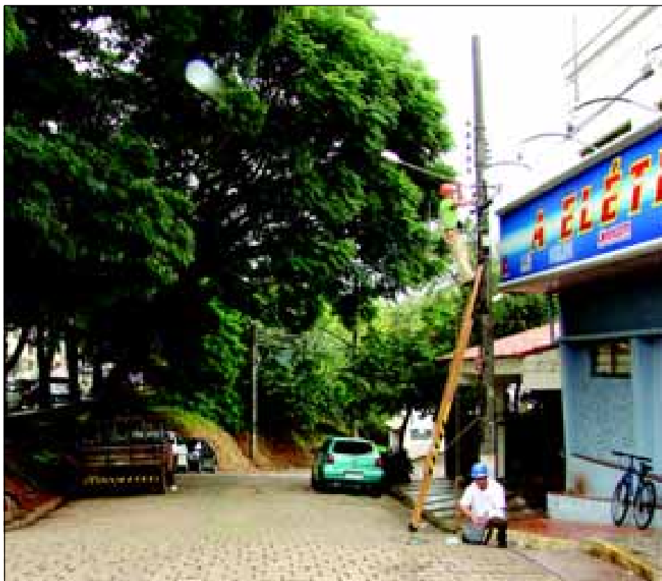
NA SEDE DO MUNICÍPIO FORAM IMPLANTADAS 857 LUMINÁRIAS A VAPOR DE SÓDIO DE 250 WATS