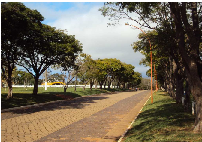
Avenida Dr. Diamantino Monteiro da Gama

Principal via de acesso ao recinto da Emapa, a Avenida Dr. Diamantino Monteiro da Gama se estende por 300 metros, entre a Praça dos Criadores e a Rua Atílio Silvestre. O nome do logradouro homenageia o advogado, político e fazendeiro Diamantino Monteiro da Gama (1914-1985), nomeado prefeito no período de 1941 a 1945, quando iniciou a construção do Paço Municipal, inaugurou o prédio atual da Escola Maneco Dionísio e apoiou a criação do Horto Florestal.