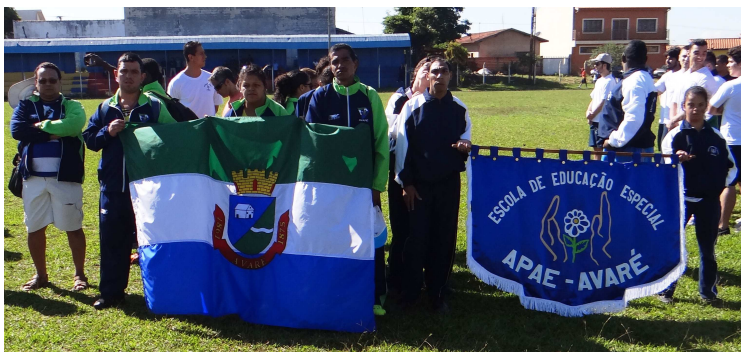
Equipe de atletismo adaptado de Avaré na abertura da etapa avareense do Circuito Especial de Atletismo

frente da equipe de Igarçu do Tietê, com uma diferença de apenas 3 pontos. Na terceira colocação ficou a cidade de Paranapanema, com 153 pontos. Na classificação geral, somando as etapas de Avaré e Itai, os avareenses lideram o circuito com 220 pontos, dez pontos à frente de Paranapanema.