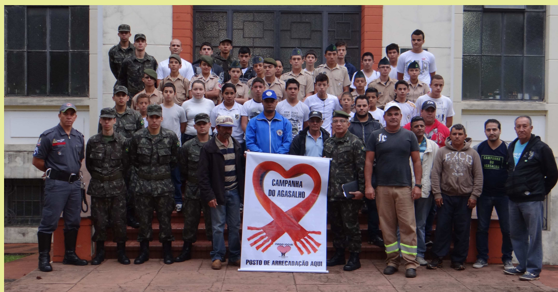
Voluntários reunidos para o mutirão da campanha

A zona urbana foi dividida em setores para favorecer a chamada operação porta a porta. Os números serão divulgados na próxima semana, após a contagem geral das peças.