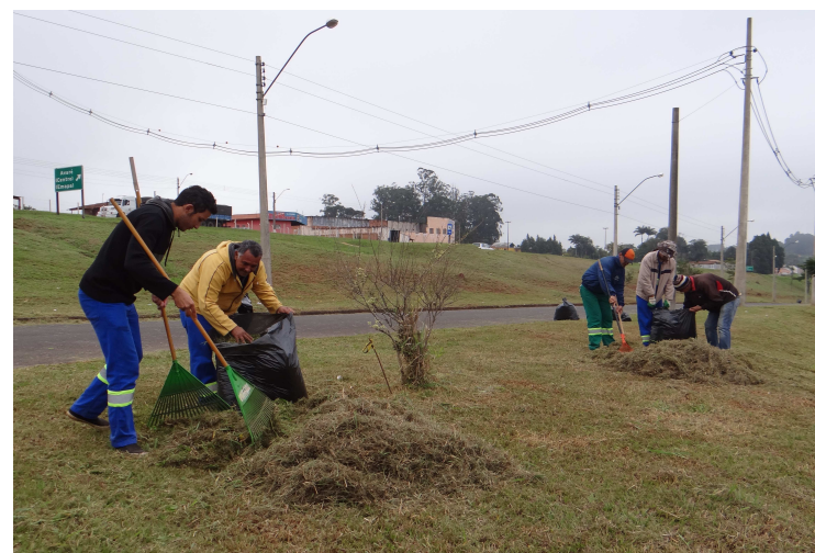
Roçadas em canteiros, áreas verdes e terrenos particulares