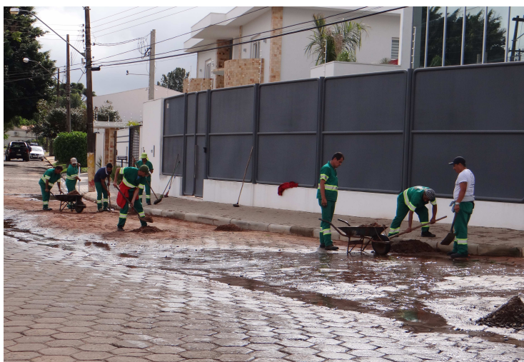
Retirada de terra na Avenida Carlos Ramires

Desde que assumiu oficialmente a manutenção da iluminação pública, a Prefeitura vem executando a troca de lâmpadas, que deve ser solicitada através da Ouvidoria Municipal (3711-2500). No último sábado, 30, foram implantados quatro postes de luz na ponte que liga os bairros Jardim Paraíso e Mário Emílio Bannwart, atendendo a uma solicitação dos moradores.