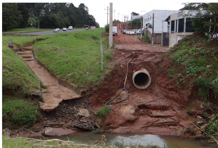
Tubulação implantada na avenida marginal da SP 255

Executada em convênio com o Governo do Estado, através da Secretaria de Planejamento e Desenvolvi-