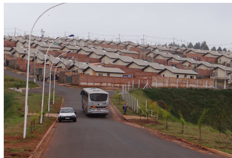
Postes de iluminação instalados na ligação entre o Jd. Paraíso e o Residencial Mário Bannwart

Responsável pela fiscalização de terrenos particulares que necessitem de limpeza e roçada, a Secretaria do Meio Ambiente vem notificando proprietários por meio de correspondência com Aviso de Recebimento (AR). A partir da publicação do referido endereço no Semanário Oficial e do recebimento do AR, o proprietário tem 15 dias úteis para providenciar a limpeza. Se não for executada, a Secretaria de Serviços fará o trabalho e haverá aplicação da multa.