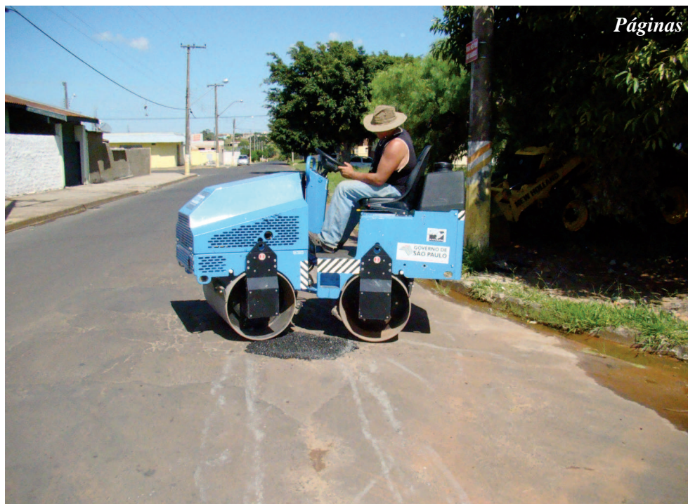
Rua Heitor de Barros na Brabância