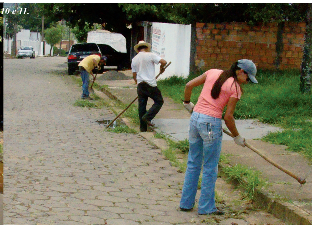
Mutirão de capinação e roçada no Bairro Jardim Europa II

Em 43 anos de história, funcionários da FREA indicarão pela primeira vez o nome do futuro presidente