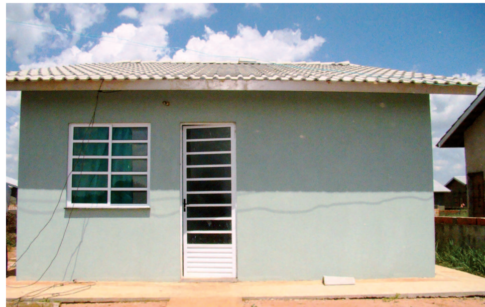
Casa modelo do conjunto habitacional já está pronto

Também já foram iniciados os trabalhos para pavimentação asfáltica de 4.717,00 m 2 em CBUQ nas ruas do referido conjunto. De acordo com o