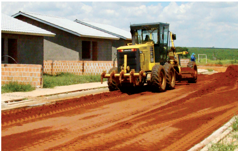
Maquinários trabalham na pavimentação das ruas

Vinte e duas casas do Conjunto Habitacional do Bairro de Barra Grande já estão em fase final de construção e deverão ser inauguradas em março. Foram investidos R$