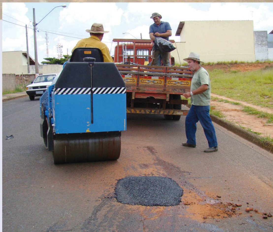
Avenida Carmem Dias Faria