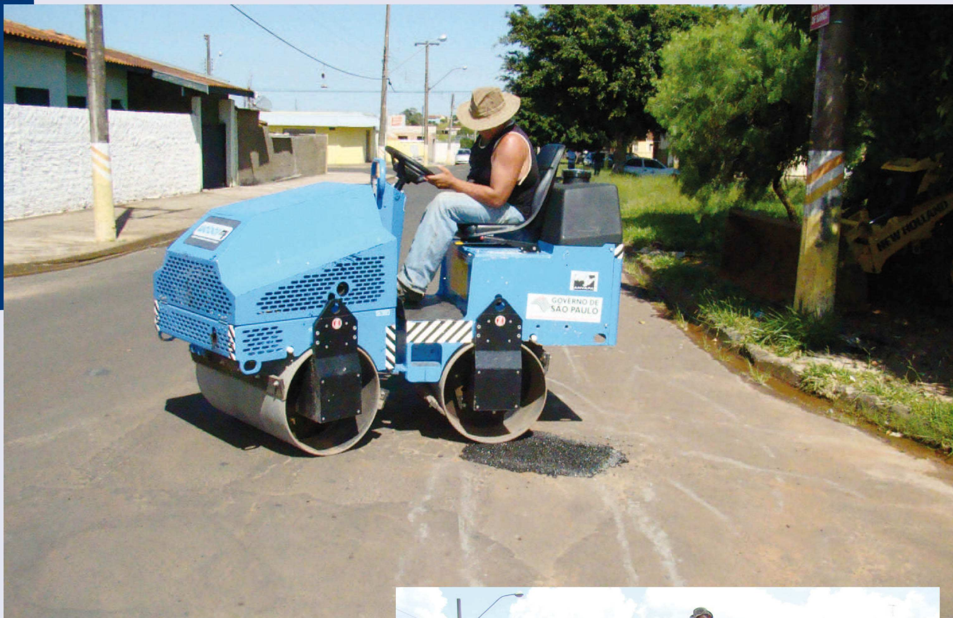
Rua Heitor de Barros na Brabância