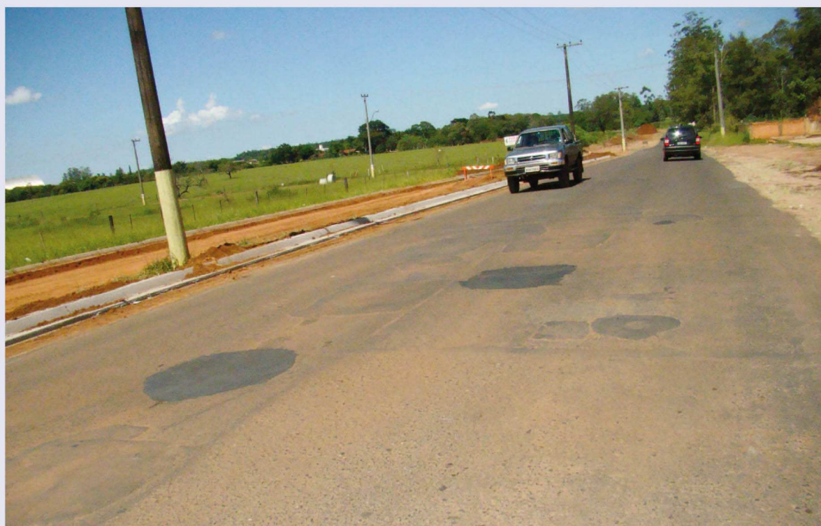
Avenida Governador Mário Covas

A Secretaria Municipal do Meio Ambiente pede a toda população que não jogue sofás em córregos, lixo em vias públicas, auxiliando, desta maneira, a manutenção da limpeza pública municipal.