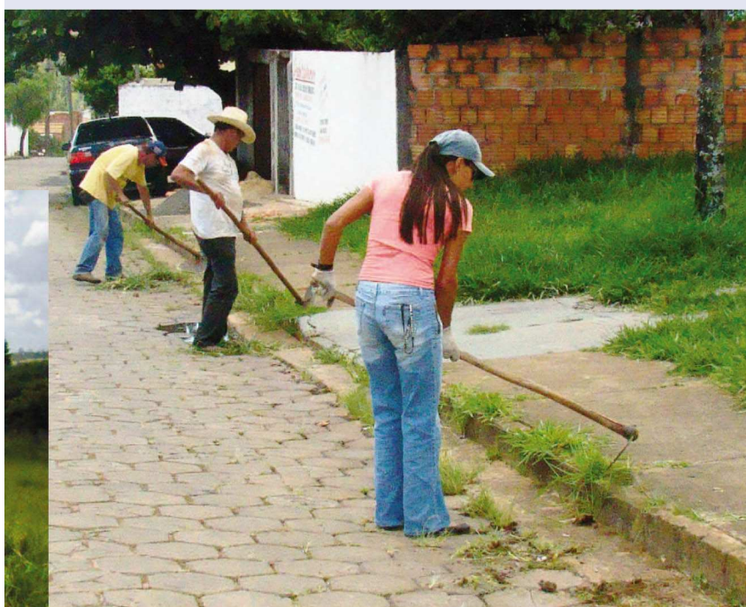
Mutirão de Capinação e Roçada no Bairro Jardim Europa II