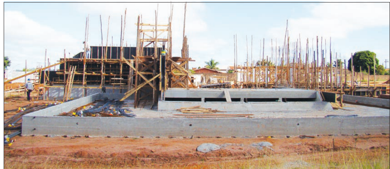
Obras do novo prédio do Fórum