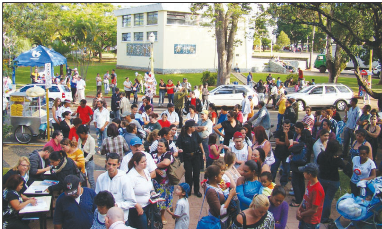
Sorteados do Programa em frente ao Paço Municipal