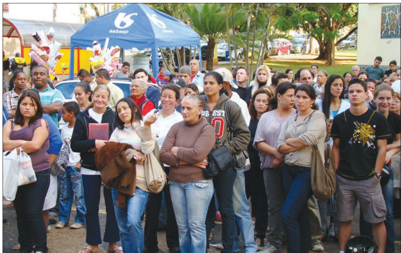
Contemplados pelo Programa “Minha Casa, Minha Vida”