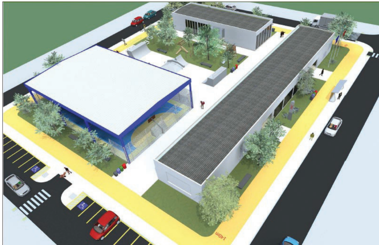
Maquete da Praça de Esportes

Avaré se interessou pelo projeto e o Departamento de Convênios (DECON) encaminhou todo o processo para Brasília, onde até mesmo terreno para a construção de uma Praça de Esporte e Cultura já estaria em vista. Avaré só não foi contemplada nesta primeira fase, mas ainda pode ser contemplada, já que o projeto é válido até 2014.