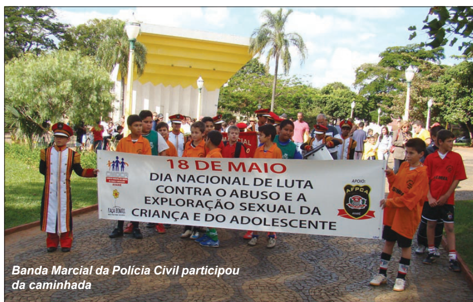
Banda Marcial da Polícia Civil participou da caminhada

O Dia Nacional de Combate ao Abuso e à Exploração Sexual de Crianças e Adolescentes, instituído pela Lei Federal 9.970/00, no dia 18 de maio, é uma conquista que marca a luta pelos direitos humanos de crianças e adolescentes no território brasileiro. O dia foi esco-