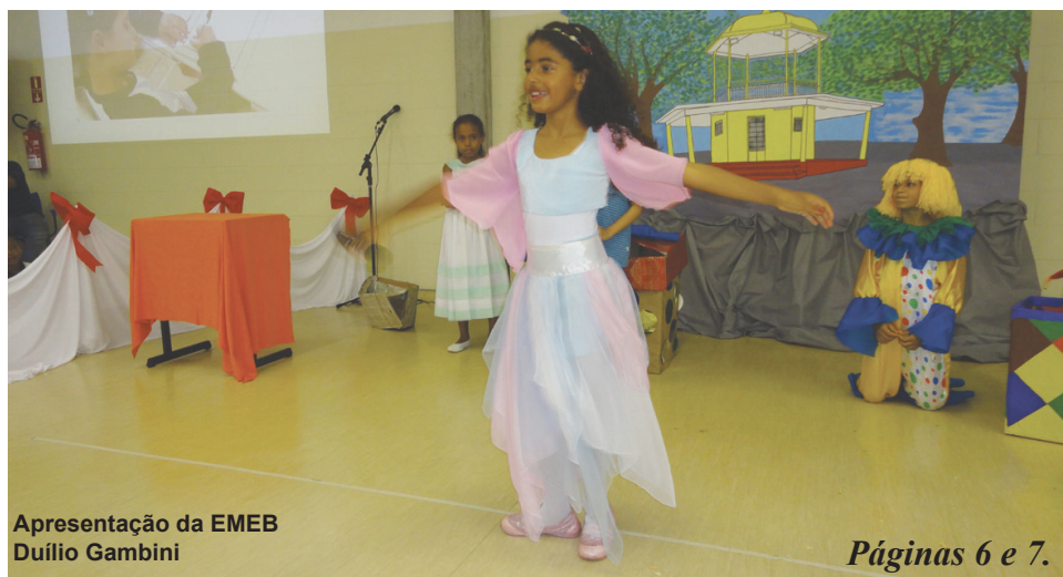
Apresentação da EMEB Dúilio Gambini