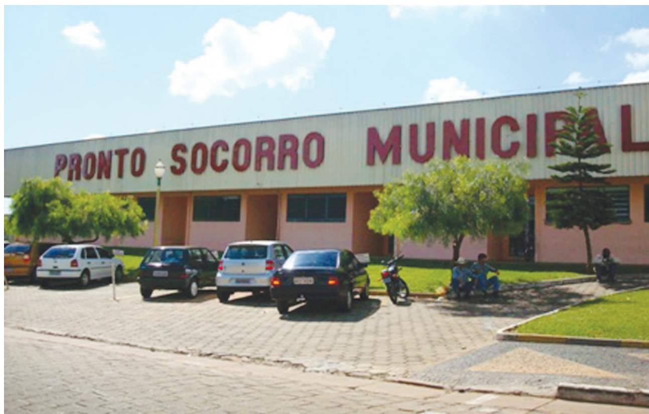
Atendimentos de urgência/emergência no Pronto Socorro Municipal terão expediente

Lembrando ainda que a Feira Livre da Avenida Paranapanema será realizada excepcionalmente neste sábado, 31, em seu horário normal e que as creches municipais funcionarão normalmente na data de hoje, 30.