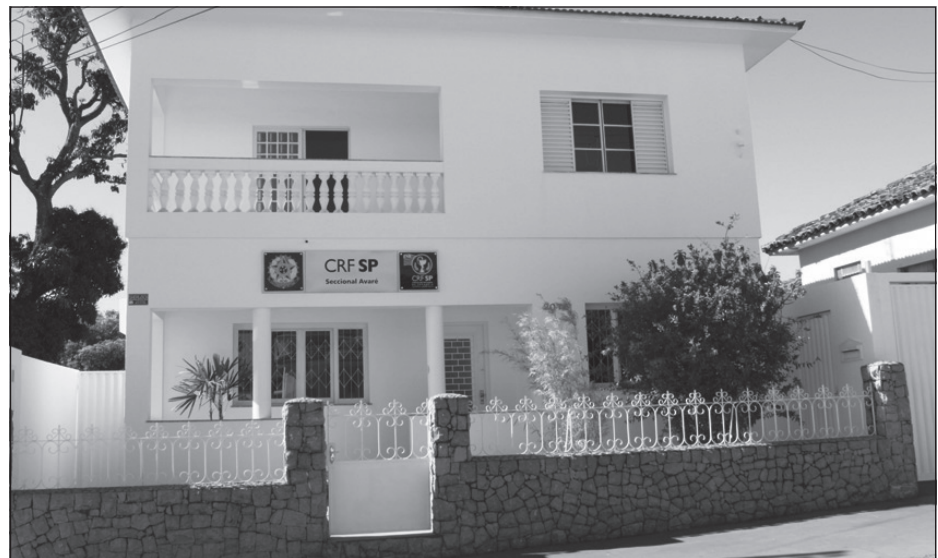
Sede da Regional do CRF-SP Avaré na Rua Rio de Janeiro

Com ambiente climatizado, espaço para palestras e localização próxima ao centro da cidade, a Seccional de Avaré do Conselho Regional de Farmácias de São Paulo foi inaugurada oficialmente na sexta-feira, 2 de setembro. Agora, os farmacêuticos da cidade e região não precisarão mais ir até Bauru para realizar procedimentos como inscrição no CRF-SP, assunção e baixa de RT, requerimentos, além da oportunidade de realizar cursos, palestras e informações sobre a legislação vigente e campanhas de orientação em saúde.