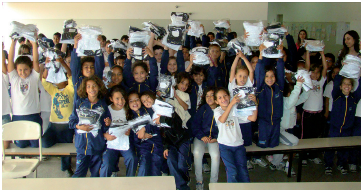
Alunos demonstram alegria com os novos uniformes

É o Governo Municipal investindo na Educação de nossos alunos, onde já foram implantadas salas do Proinfo – Programa Nacional de Informática na Educação -, salas multifuncionais, entregues 22 lousas digitais e realizados diversos cursos para capacitação dos professores.