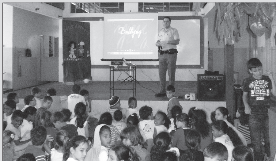
Policial militar explicando aos alunos sobre as conseqüências do bullying

A Secretaria Municipal de Educação, em parceria com professores da Rede, Faculdade Eduvale, Faculdade FSP e Projeto PRO-ERD da Polícia Militar, promoveu na semana de 29 de agosto a 2 de setembro, um ciclo de palestras nas escolas municipais.