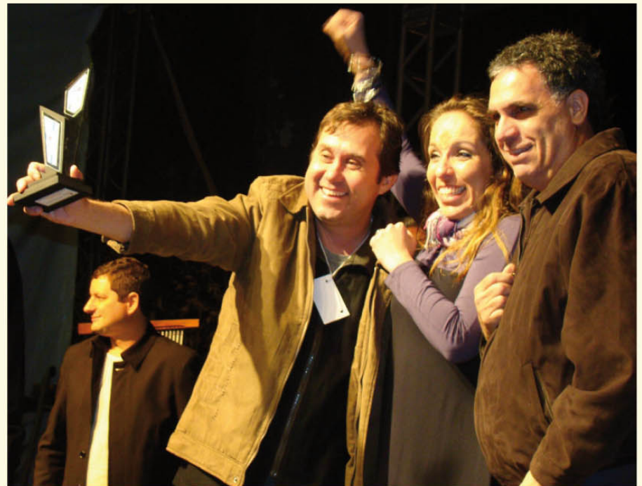
Os vencedores comemoram no palco da FAMPOP a grande conquista