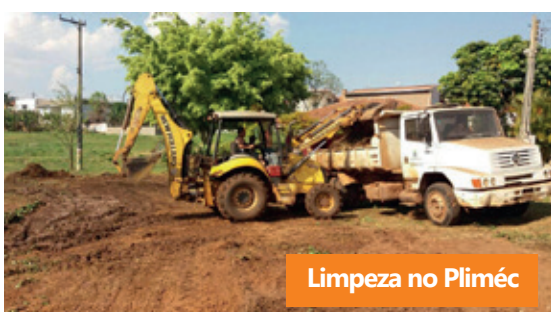
Limpeza no Pliméc