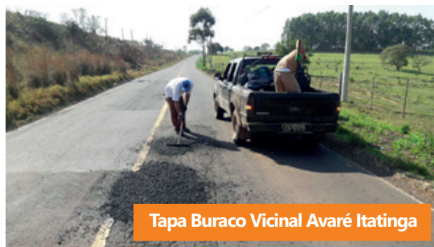
Tapa Buraco Vicinal Avaré Itatinga