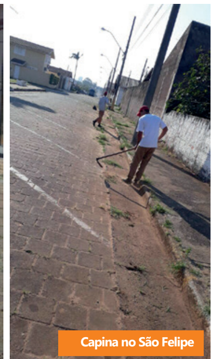
Capina no São Felipe