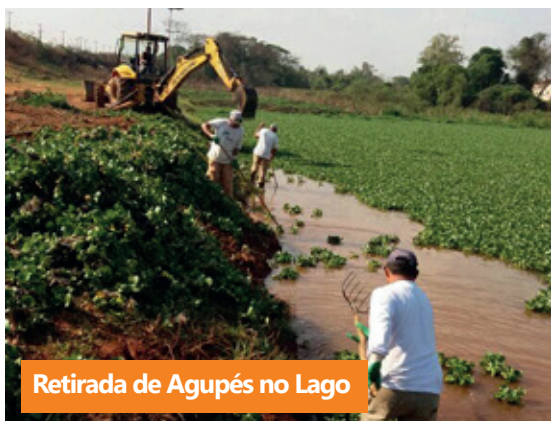
Retirada de Aguapés no Lago