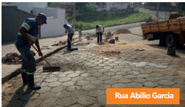
Rua Abílio Garcia

no calçamento. A Vicinal que liga Avaré a Itatinga voltou a receber a operação Tapa Buraco. O Bairro Recanto dos Bem Te Vis também passou por reparos no asfalto.