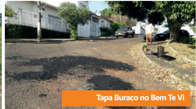
Tapa Buraco no Bem Te Vi