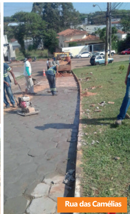
Rua das Camélias