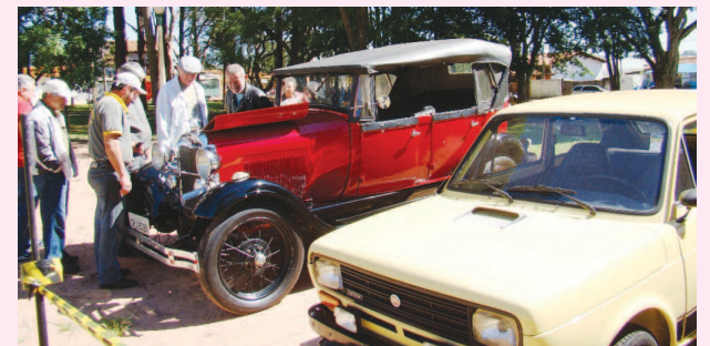
Exposição Carros Antigos