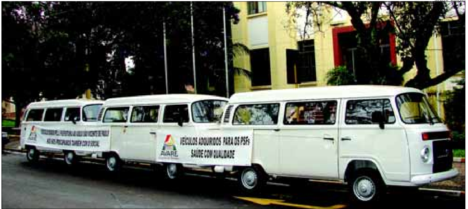
Serão destinadas 2 Kombis para PSF's e 1 para o Asilo São Vicente de Paulo

Para a saúde serão encaminhadas para o PSF III – Dante Caveci no Jardim Paineiras e outra para o PSF IV – Dr. Carlos Aparecido Bandeira no Paraíso para atender a população da região que se encontram os PSF's citados e também para transportes de pacientes e agentes de saúde.