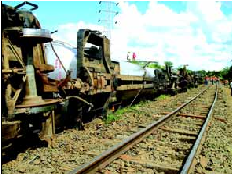
Trêm descarrilado em 2006 - próximo a Barra Grande - risco constante na área urbana nos 14 quilômetros, em face do estado precário de muitos dormentes implantados na ferrovia

ferrovia, em meados de 1953, aquele local não tinha ocupação urbana.