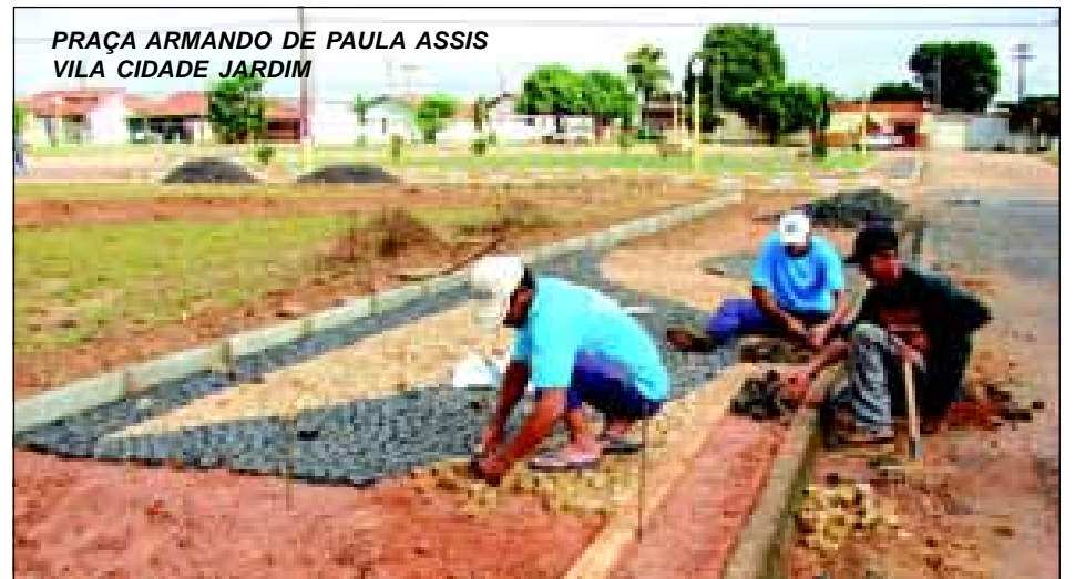
Prefeitura está urbanizando as praças em frente a escola municipal da Barra Grande e na praça Dr. Armando de Paulo Assis

Dando continuidade aos trabalhos de urbanização de áreas verdes ociosas nos diver-