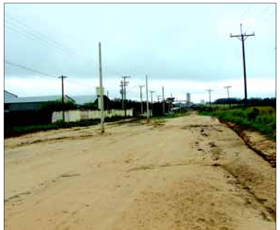
Trecho a ser alterado no Distrito Industrial Orlando Contrucci