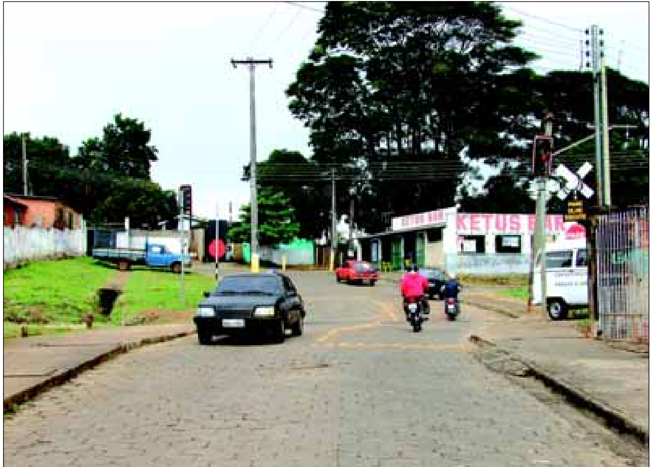
Acesso ao bairro Plimec, palco de inúmeros acidentes e atropelamentos em face da ferrovia

urbana será integrada através de novas avenidas e vias públicas, citando como exemplo o prolongamento da Avenida Dr. Antonio Silvio Cunha Bueno até a Píneiro Machado, e outras de grande importância, ocasionada pela liberação do leito ferroviário, ora proposto em mudança, pois os atuais entraves que a ferrovia oferece, cria-se uma separação de bairros, dificultando acesso, bloqueando o desenvolvimento urbano e colocando a população em risco diariamente, não só pelas passagens deficientes, como também o risco de descarrilamentos e explosões dos vagões que transportam combustível, considerando-se que na época que foi mudada a