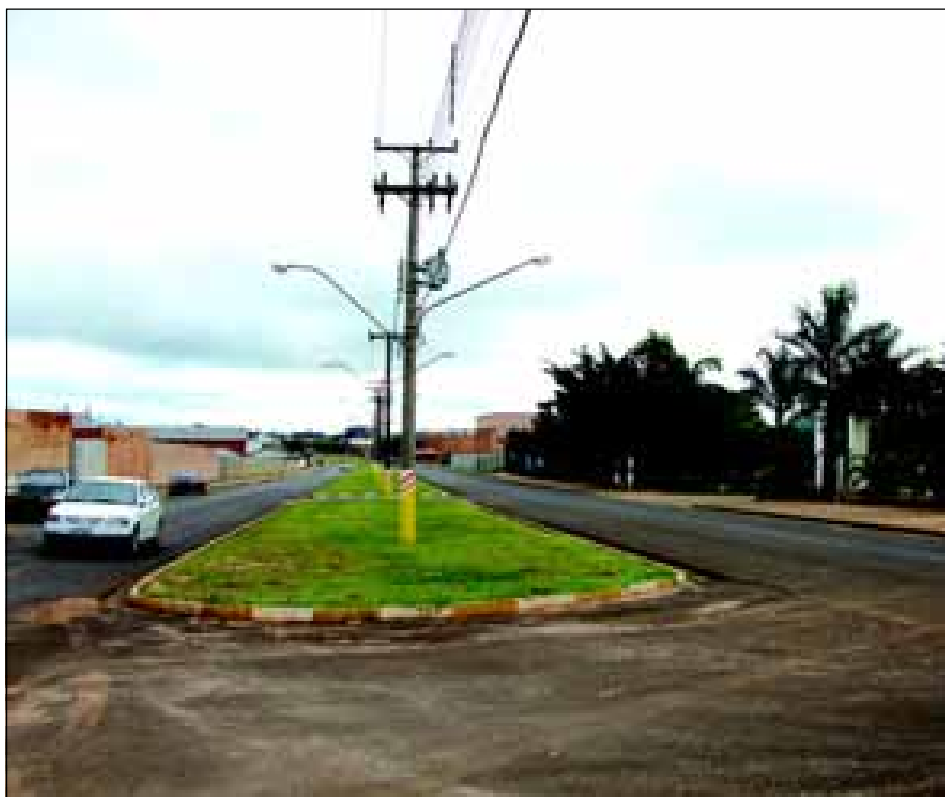
Avenida Donguinha Mercadante da SP 255 até a Avenida Governador Mário Covas

Croqui demonstrativo da alteração de denominação de Avenidas - melhoria na identificação de endereço comercial das, pois pela condição atual com fracionamento e não traçado seqüente da Avenida Donguinha Mercadante, cria-se uma situação complicada as mesmas, que muitas vezes deixam de receber encomendas, matérias primas, correspondências, entre outras.