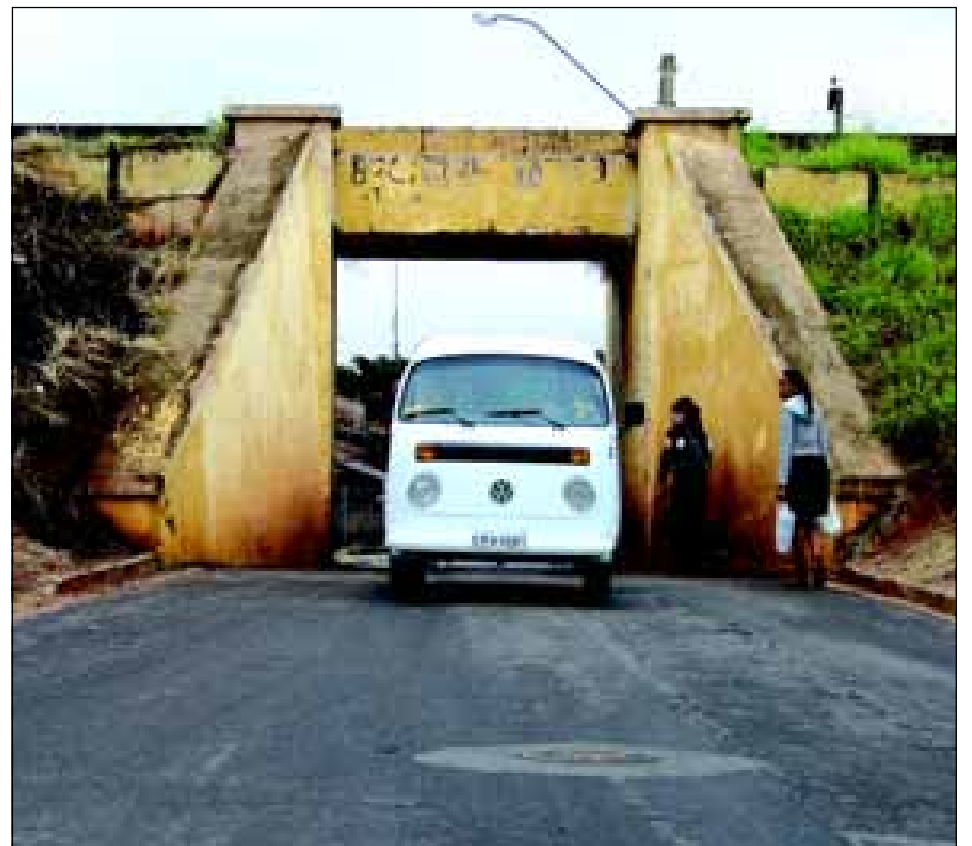
Pontilhão de acesso ao bairro Vila Martins III, riscos constantes aos pedestres