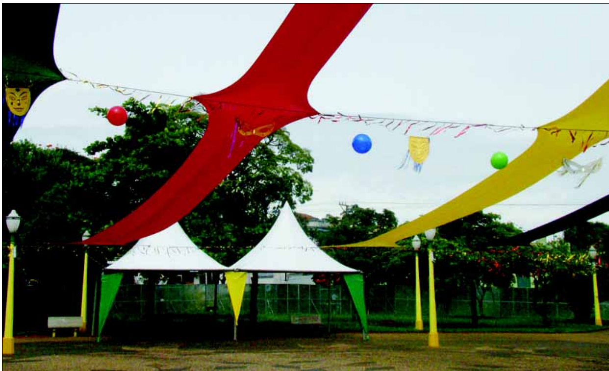
A Concha Acústica já está toda enfeitada para o Carnaval