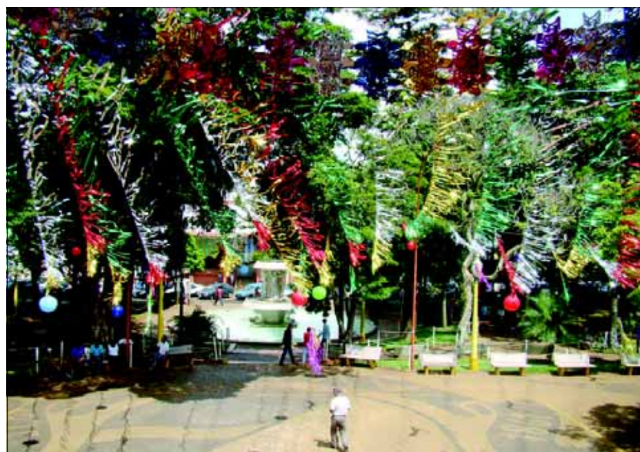
Largo São João será um dos atrativos do maior Carnaval de todos os tempos