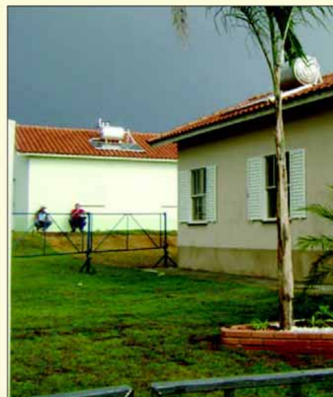
Salão de Convivência da Vila Dignidade

Por solicitação do município, a Companhia adequou os imóveis ao novo padrão de construção, adotado em 2007 para proporcionar mais conforto aos moradores. Cada unidade, com 43,18 m 2 de área construída, teve investimentos de piso cerâmico, rodapés em toda a parte interna, azulejos na cozinha e no banheiro e forro de PVC nos dormitórios, sala e cozinha e aquecimento solar em todas as moradias.