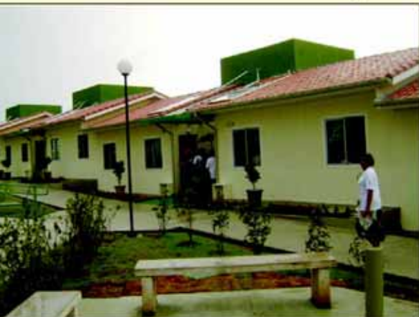
Vista das casas da Vila Dignidade