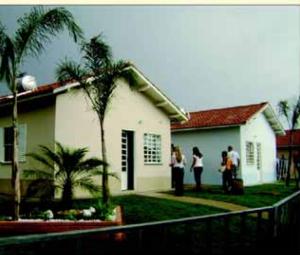
Parte das 190 casas inauguradas