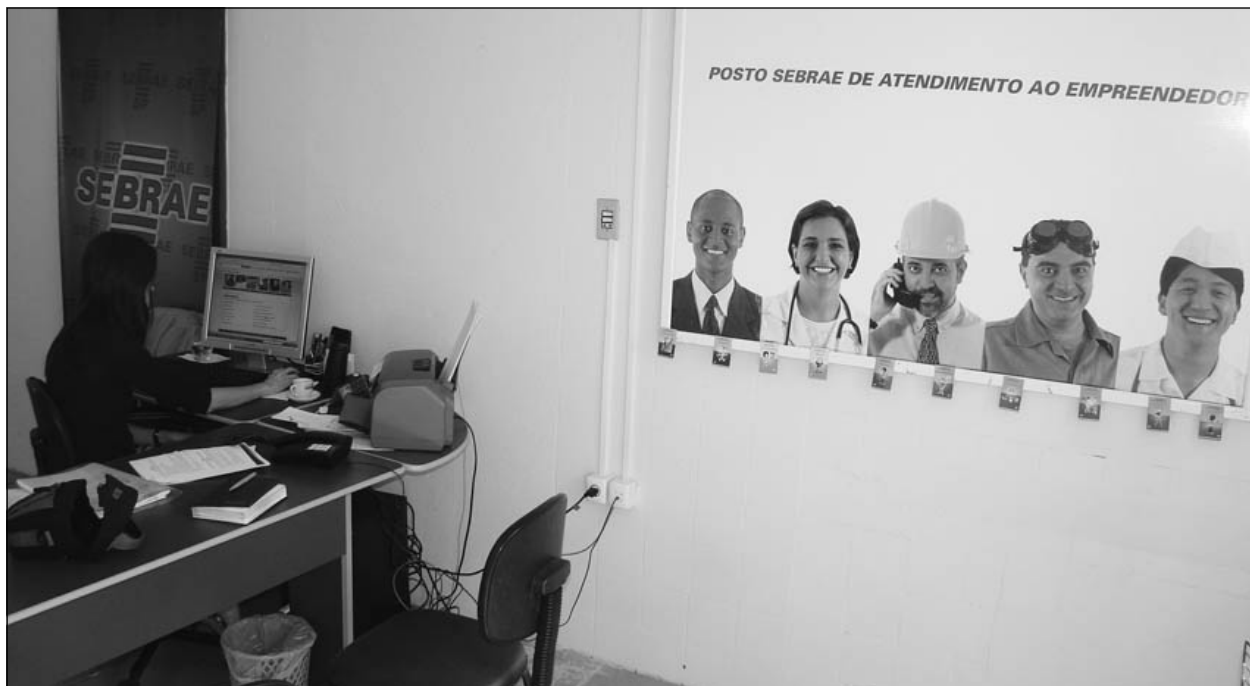
Sem o apoio do SEBRAE a implantação não seria possível

A apreciação e votação desse projeto de lei no plenário da Câmara Municipal devem ocorrer