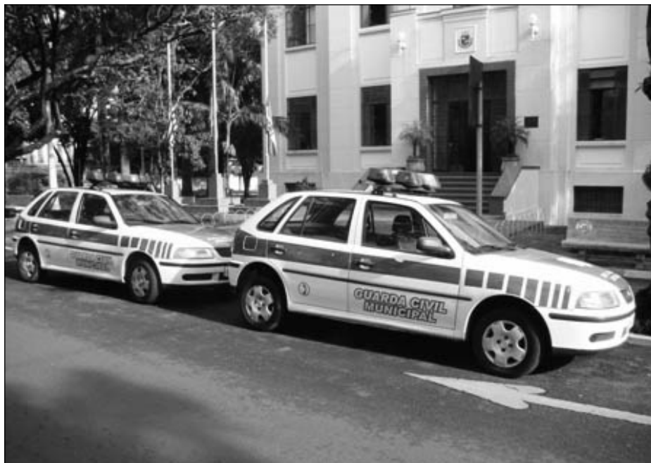
VIATURAS DA GUARDA MUNICIPAL QUE JÁ ATUARÃO NO CARNAVAL

De acordo com o Artigo 2º do Projeto de Lei aprovado, compete à Guarda Municipal promover dia e noite a vigilância dos logradouros públicos, o que inclui praças e jardins, monumentos históricos, áreas de proteção ambiental, e ainda auxiliar na fiscalização