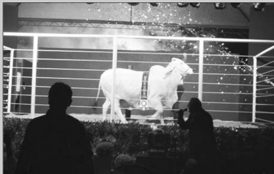
Julgamentos das raças começam no dia 4 de março

A 45ª edição da EMAPA – Exposição Municipal Agropecuária de Avaré -, já tem 9 leilões agendados, de 5 raças bovinas diferentes. O evento acontecerá dos dias 27 de fevereiro a 14 de março de 2010 e contará com a participação de 9 raças bovinas e 5 equinas que se dividirão em dois tur-