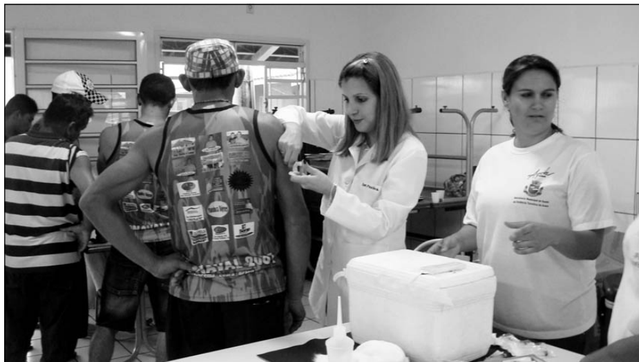
Funcionários são vacinados contra tétano e febre amarela