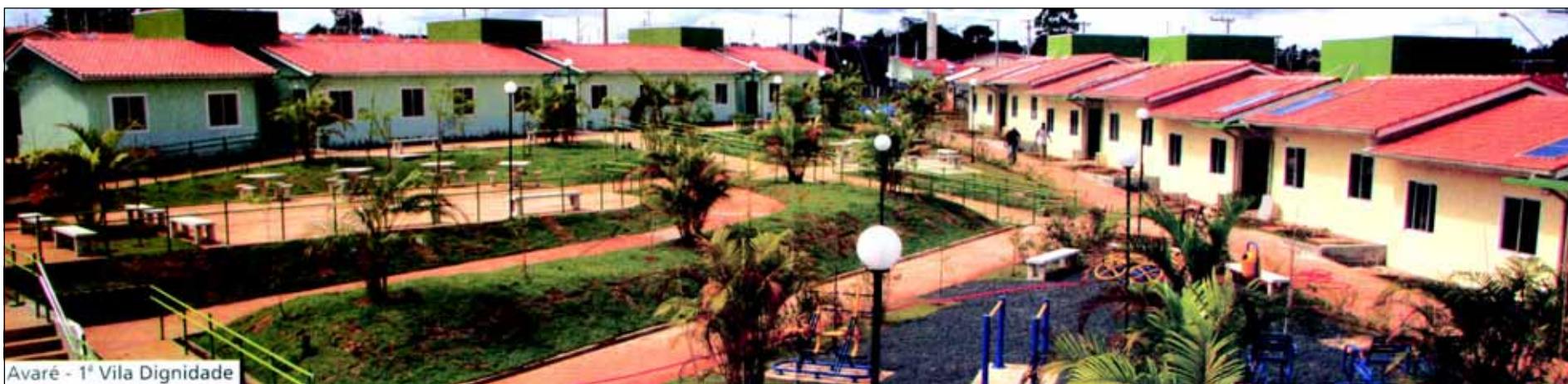
Avaré - 1ª Vila Dignidade

A primeira experiência da Vila Dignidade, programa habitacional do Governo do Estado destinado exclusivamente a idosos de baixa renda, foi inaugurada na quinta-feira, 11/02, em