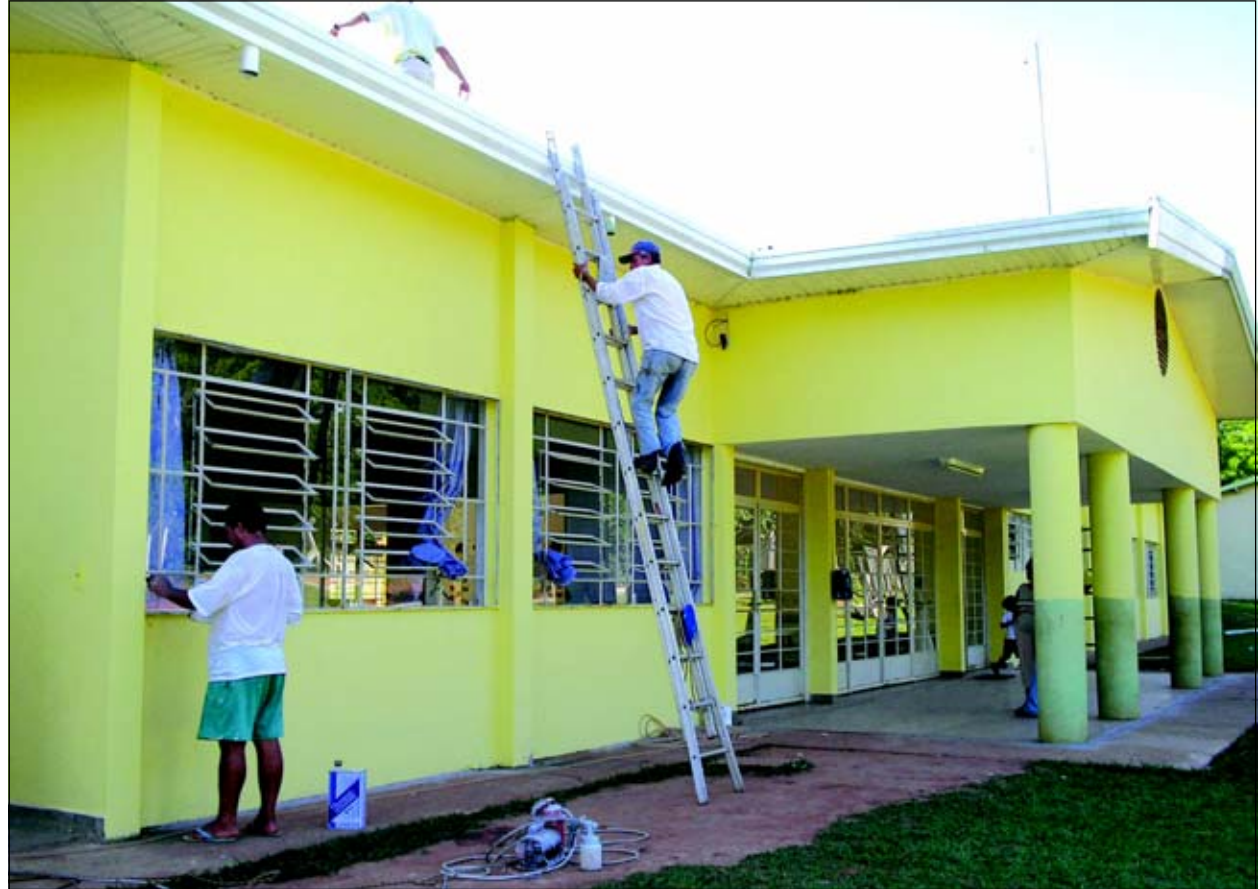
Prédio está recebendo nova pintura

O principal fator que causou o problema na escola foi o telhado, onde as telhas se soltaram com facilidade. Pelo