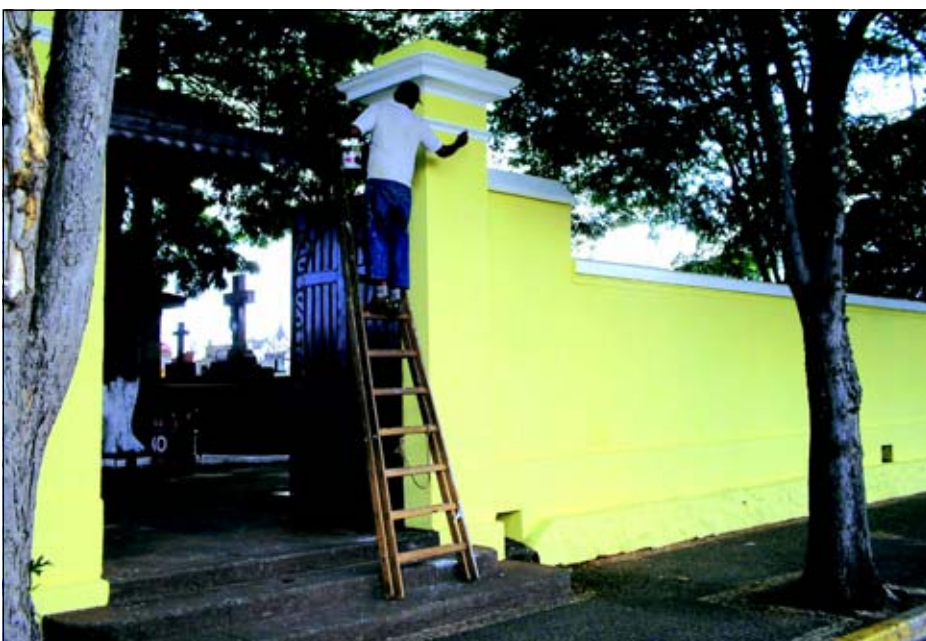
Cemitério está recebendo melhorias para o Dia de Finados