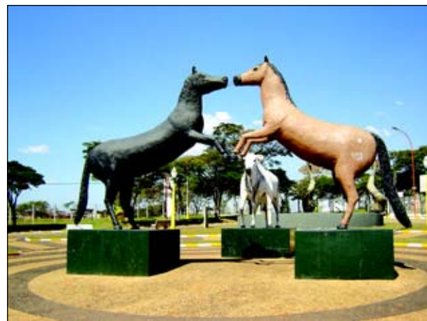
De acordo com o calendário, a Emapa acontece em fevereiro e a Festa Country em dezembro

Outra alteração é referente a parte de exposição da Emapa, que agora está confirmada e passa a acontecer em fevereiro. Em Dezembro acontece a Festa Country, com grandes shows artísticos.