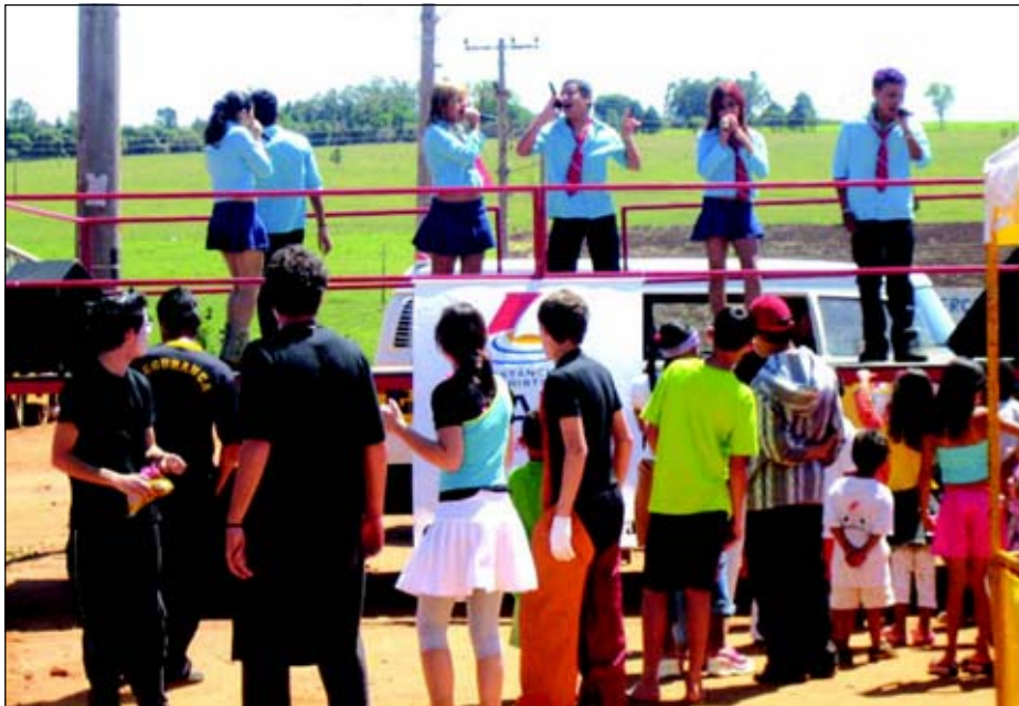
Diversas apresentações ocorreram durante o evento

foi realizada apresentação teatral com a Cia Gil Vicente, show