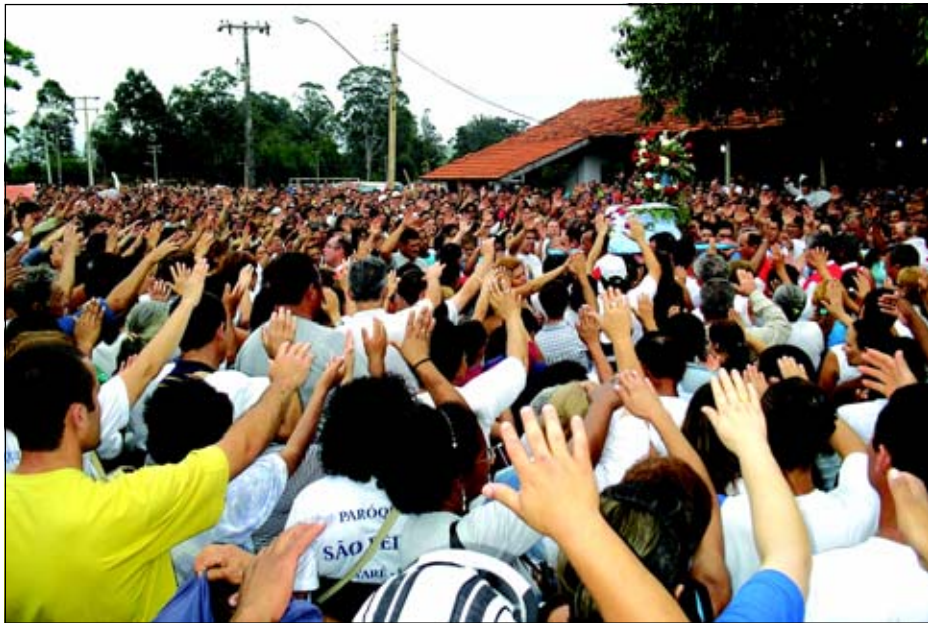
Procissão em Louvor a Nossa Senhora Aparecida passa a fazer parte do calendário de eventos

A Prefeitura da Estância Turística de Avaré conta com um Calendário Oficial de Eventos. Neste calendário estão os principais eventos que atraem turistas para cidade. São eventos promovidos pela Prefeitura e até mesmo pela iniciativa privada ou entidades.