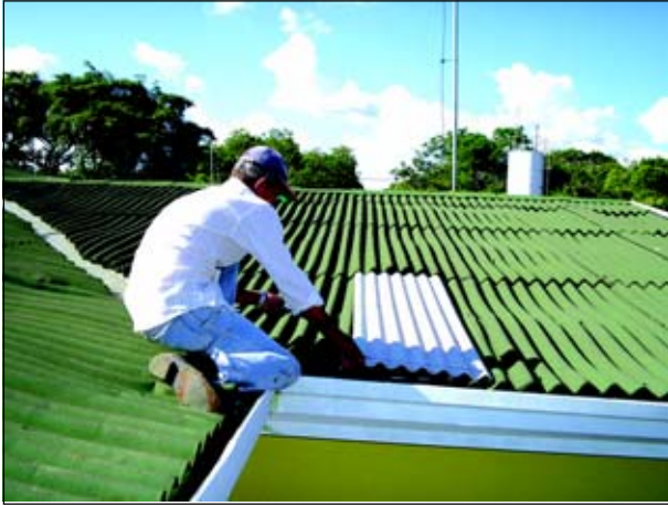
Telhas deterioradas estão sendo trocadas

Apesar de estar há pouco tempo em funcionamento, a Escola Municipal Celina Duarte Bruno, no Bairro Costa Azul, já está passando por reformas. Inaugurada na gestão passada, a escola apresentou uma série de problemas na execução da obra.