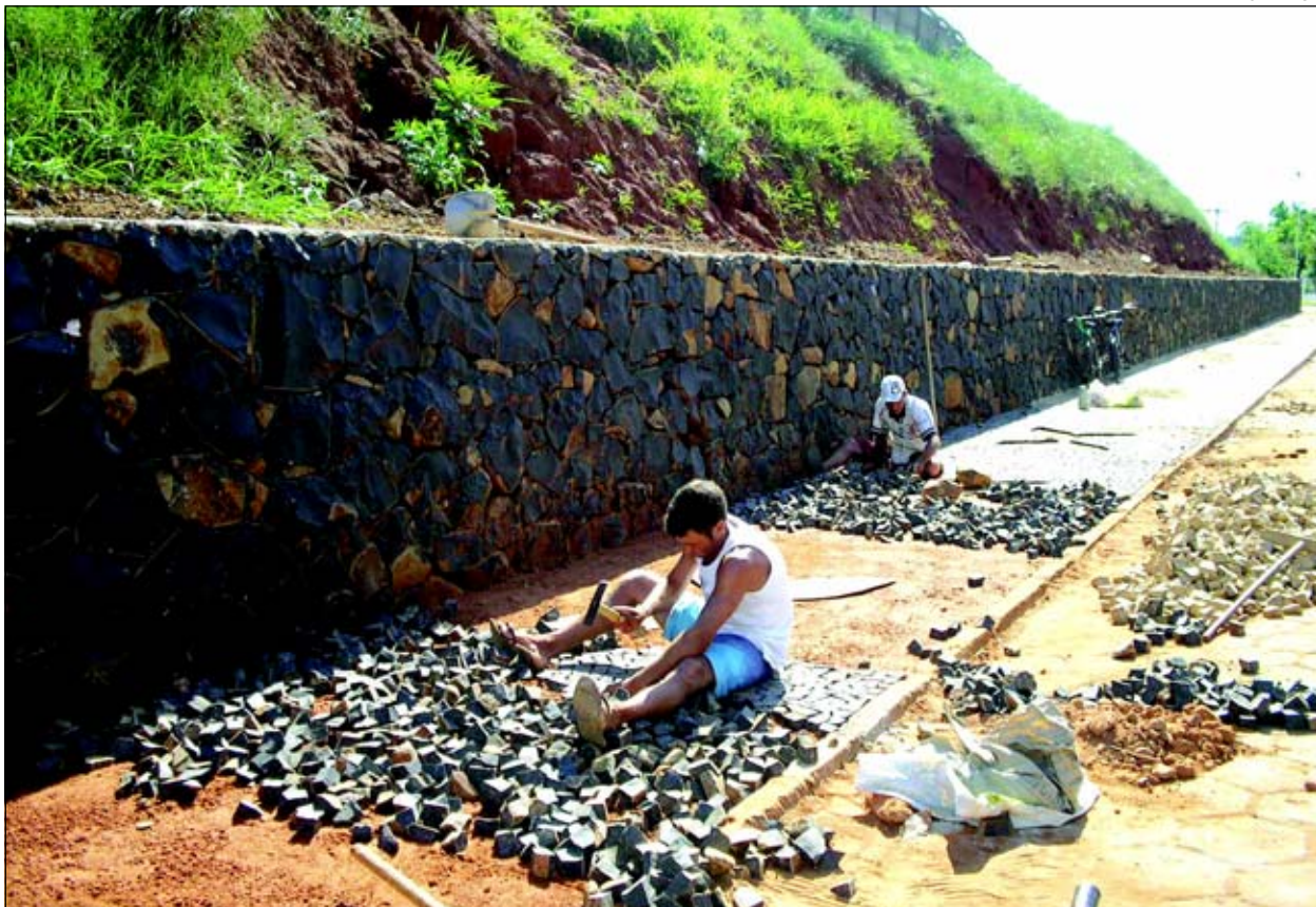
Calçada está sendo feita em mosaico português

Com a calçada que está sendo feita em mosaico português, além de possibilitar melhor visual ao local, também dará mais comodidade aos pedestres.