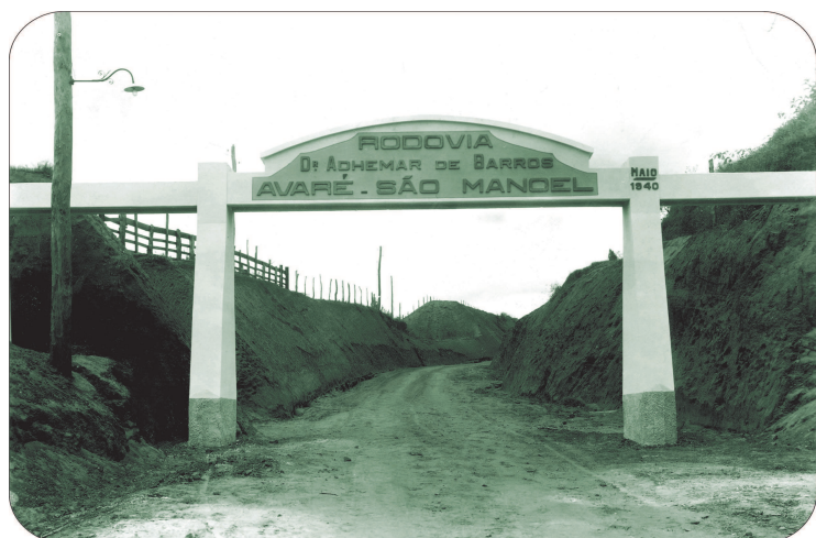
Antigo portal da rodovia, 1940.