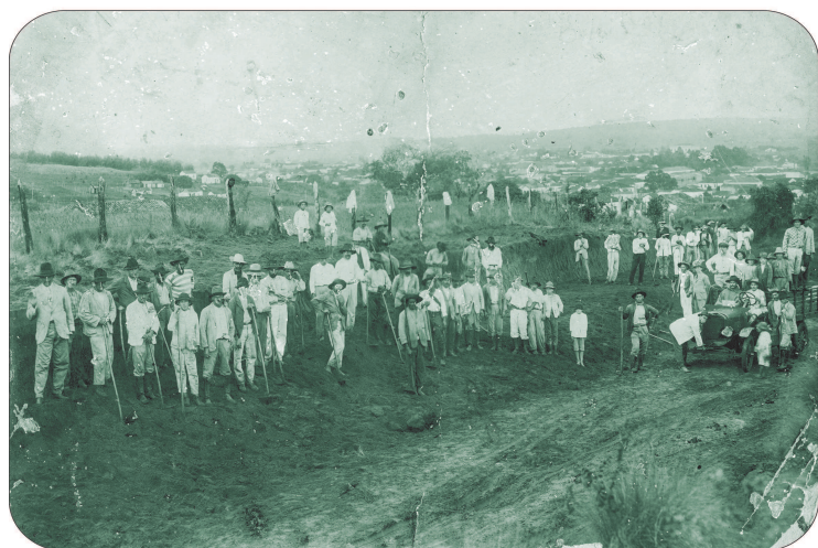
A via em obras no ano de 1939, quando era o começo da estrada Avaré-São Manuel.