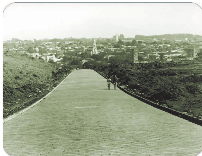
A Rua Carmem Dias Faria sendo aberta em 1987 e vista pelo mesmo ângulo na atualidade.

Via é a principal ligação para a Zona Norte