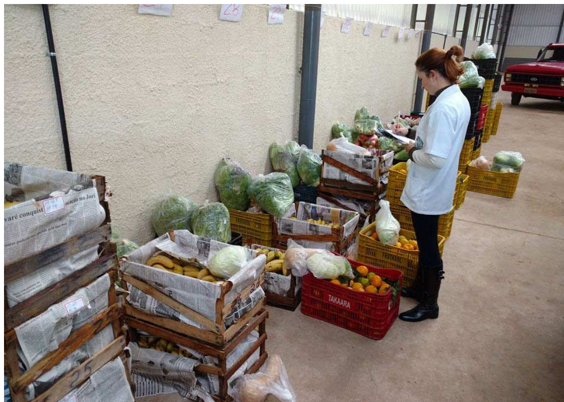
Nutricionista confere produtos recebidos no Galpão