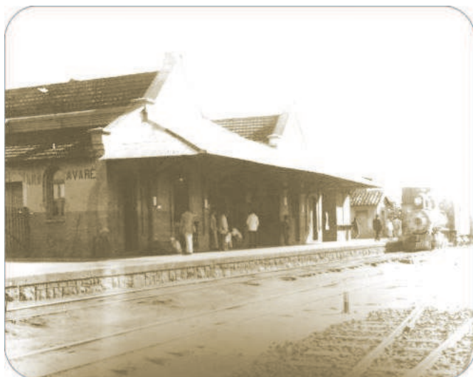
Locomotiva na estação de Avaré, 1915

o Terminal Urbano desde 2003 – tem cerca de 1.000 metros de extensão entre o Horto Florestal e a Praça Brasil-Japão.