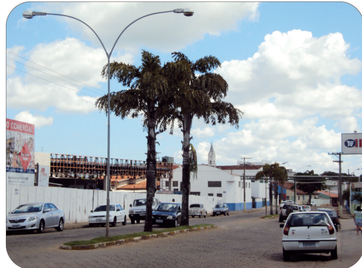
Avenida Major Rangel vista pelo mesmo ângulo em 1972 e na atualidade.

tro histórico da cidade, sendo de lá retirados em 1951. Sobre esse trecho abriu-se uma avenida no início da década de 1960,