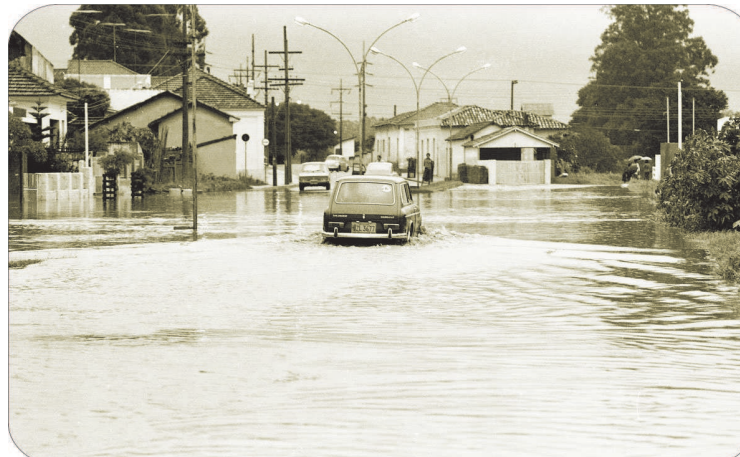
A avenida numa enchente em 1977.