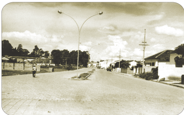
Aspecto da avenida em 1972.