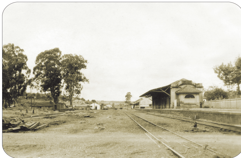
Retirada da linha férrea, 1953.