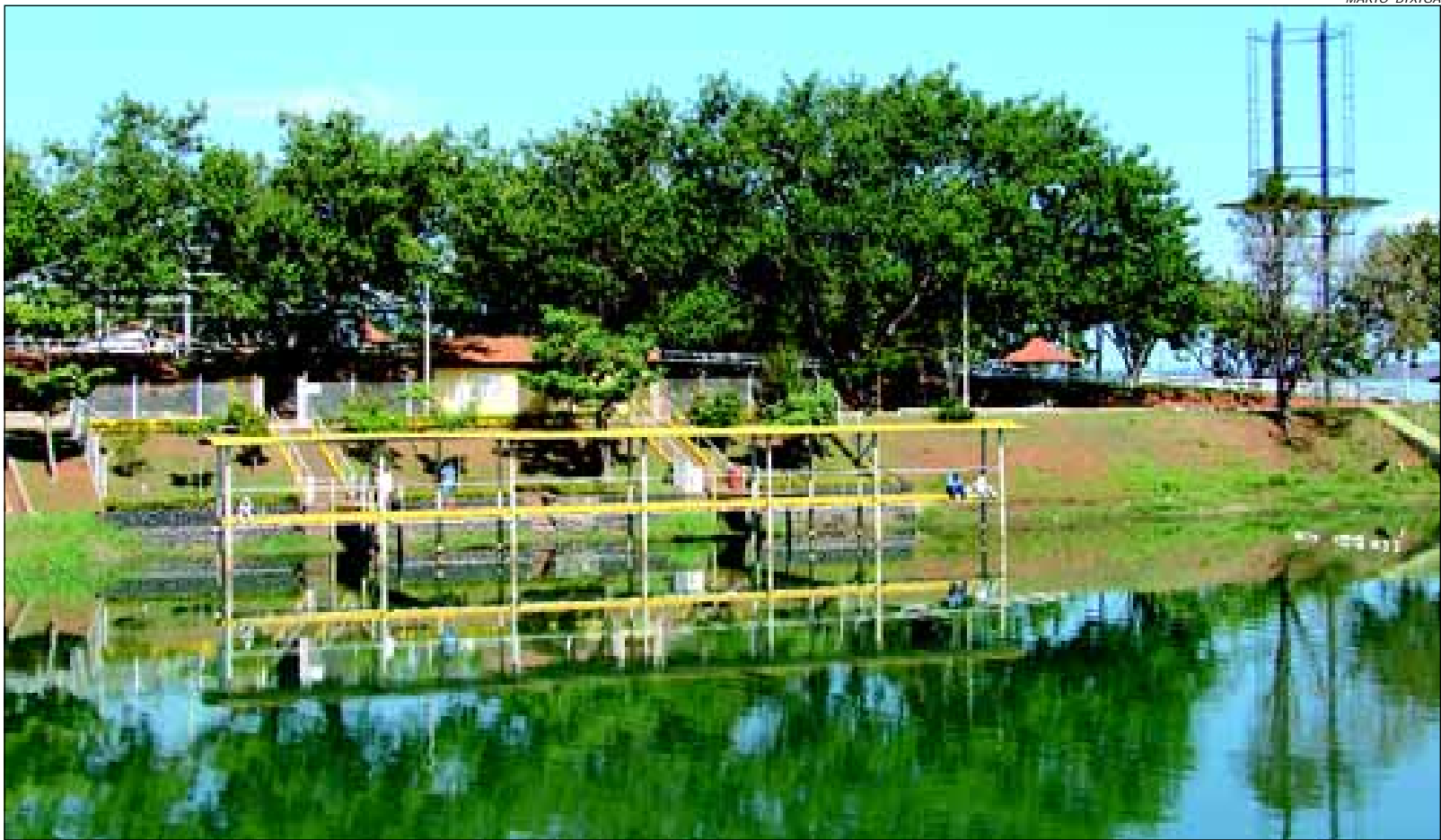
Nível da Represa Jurumirim ainda

Junto ao Camping Municipal, foi constatado que o número de visitantes e turistas apresenta uma frequência significativa, pois mesmo estando no período de inverno, os dias têm se mantido com uma temperatura agradável, possibilitando aos frequentadores que se utilizem das instalações e estrutura do local.