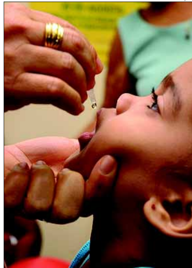
Todas as crianças menores de 5 anos devem serem vacinadas contra a Paralisia Infantil

A doença – A doença tem consequências mais graves quando a pessoa infectada é uma mulher grávida, porque pode provocar aborto ou o nascimento de crianças com síndrome da rubéola congênita (SRC), que causa deficiência auditiva, lesões oculares (retinopatia, catarata, glaucoma), malformações cardíacas e com alterações neurológicas (microcefalia, meningoencefalite, atraso do desenvolvimento neuropsicomotor). Em homens ou mulheres não gestantes a doença provoca incômodos diversos, como febre, manchas pelo corpo, dor nas juntas entre outros sintomas.