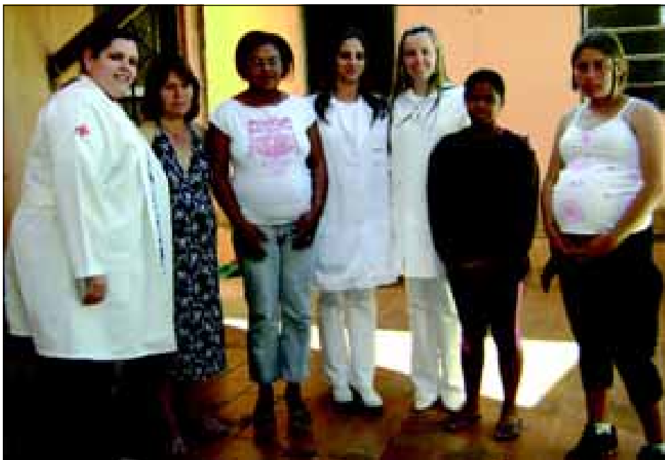
São passadas as mães orientações relacionadas ao cuidado com o bebê

A ESF “Dr. Dante Cavecci” no Jardim Paineiras realizou no último dia 21, através do Projeto Banho Acolhedor, um encontro com as gestantes e puérperas do bairro, onde tem como objetivo orientações relacionadas ao cuidado com o bebê (higiene bucal, cuidados com o umbigo, banho, pega correta na amamentação e massagem de conforto), por meio de simulações. As mães praticaram os cuidados em um manequim e logo após receberam um kit com fralda, sabonete, shampoo e pomada para assadura e também foi oferecido um