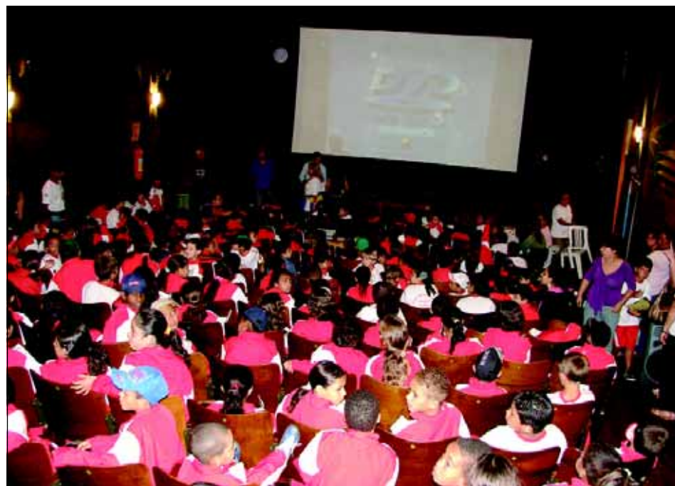
Foram exibidos filmes premiados no Festival Internacional de Cinema Ambiental (FICA)

Foram exibidos filmes premiados no Festival Internacional de Cinema Ambiental (FICA), realizado anualmente pelo governo de Goiás, documentário do ex-vice-pre-