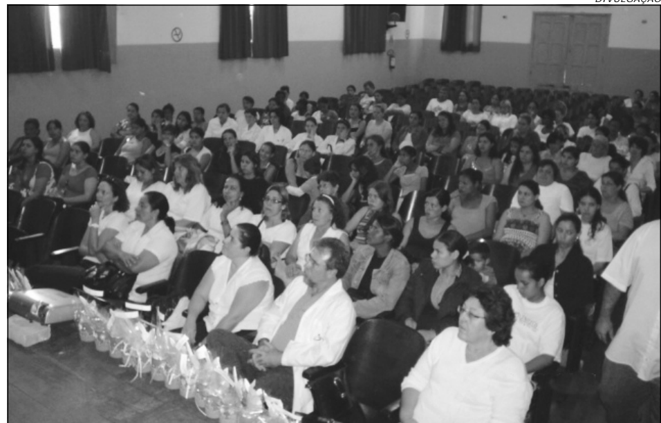
A palestra contou com a participação de 86 gestantes

Durante as palestras uma equipe de enfermagem cuida dos filhos das gestantes e no final são distribuídos lanches, sucos e brindes a todos os participantes do evento.