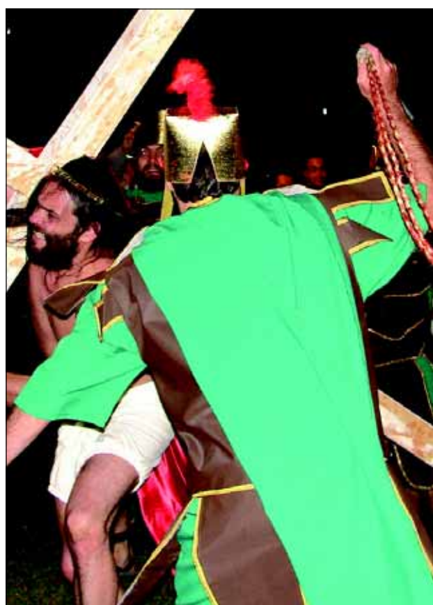
O evento teve o apoio da Prefeitura da Estância Turística de Avaré e FREA.

Foram aproximadamente mais de 800 pessoas envolvidas na peça, sendo composta por 300 atores amadores da Cia Gil Vicente, alunos do Colégio Universitário de Avaré e das escolas municipais, alunos da Faculdade Aberta da Terceira Idade e crianças da APAE.