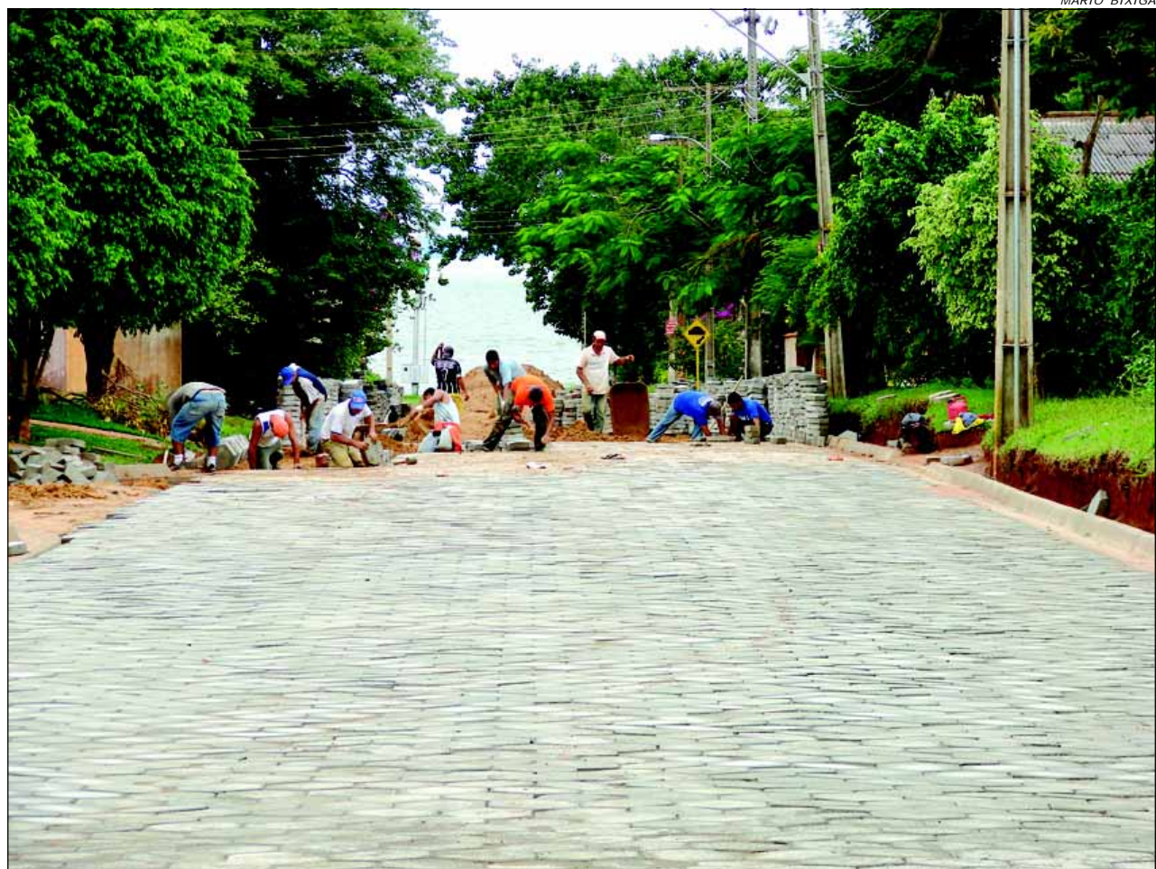
Estão sendo feitos pavimentação em lajotas e guias extrusadas das principais vias de acesso interno do bairro Costa Azul