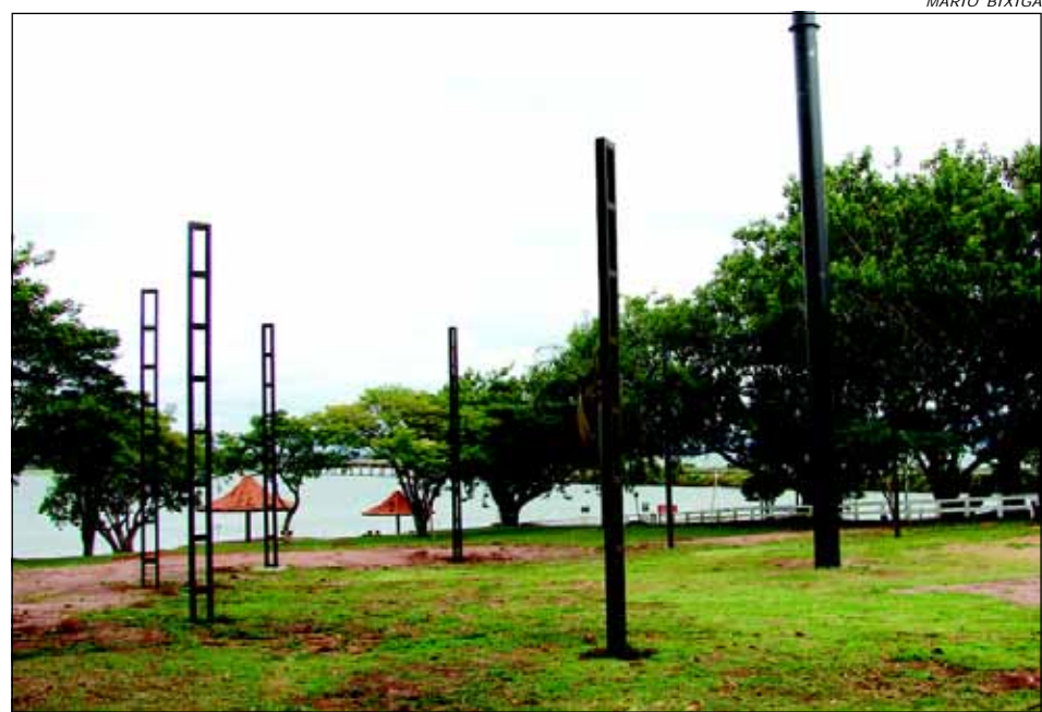
A obra está sendo realizada no mesmo local onde funcionava o antigo restaurante e servirá para receber os frequentadores do local, que estão sem opção desde a demolição do antigo restaurante.

A Prefeitura da Estância Turística de Avaré deu início a construção do Restaurante Panorâmico no Camping Municipal. A obra está sendo realizada no mesmo local onde funcionava o antigo restaurante, que foi demolido em 2002 e já está recebendo a implantação dos pés direitos metálicos de sustentação da cobertura.