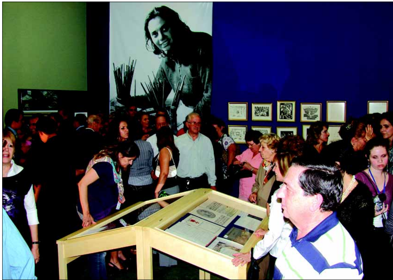
O Memorial Djanira Motta fica no Centro Cultural na antiga CAIC

O memorial pretende atrair escolas, faculdades para pesquisa acadêmicas e o público para visita.