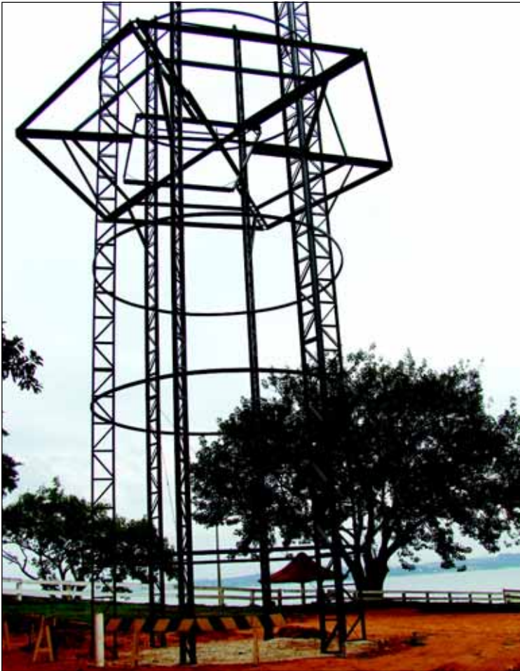
Farol do Camping já em construção, terá 24 metros de altura

Já foram implantados a estrutura metálica do farol panorâmico no Camping para posterior fechamento de chapa metálicas, escadarias, pintura e finalização da obra. O farol será mais um ponto turístico a ser visitado na Estância Turística de Avaré e estará localizado nas proximidades do pesqueiro do camping. Constará com 24 metros de altura, o que pos-