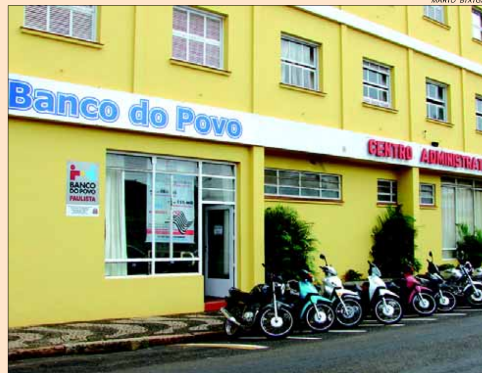
O Banco do Povo Paulista facilita o acesso ao crédito aos empreendedores de pequenos negócios com firma aberta ou não