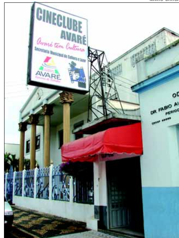
O Cineclube Avaré (antigo Clube Avereense de Cinema - CAC), foi reinaugurado na última terça-feira

ção da Secretaria da Cultura e Lazer com o apoio das secretarias municipais do Meio Ambiente e Educação.