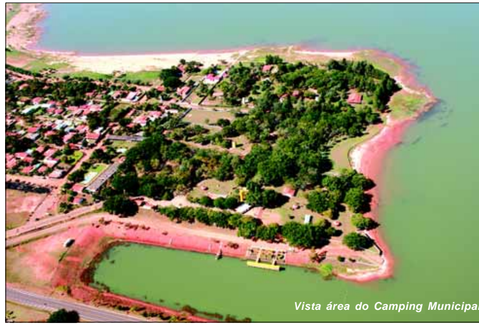
Vista área do Camping Municipal

Já foram implantados a estrutura metálica do farol panorâmico no Camping para posterior fechamento de chapa metálicas, escadarias, pintura e finalização da obra. O farol será mais um ponto turístico a ser visitado na Estância Turística de Avaré e estará localizado nas proximidades do pesqueiro do camping. Constará com 24 metros de altura, o que pos-