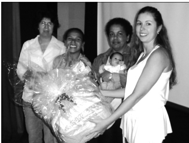
No final são distribuídos lanches, sucos e brindes a todos os participantes do evento

A secretaria sempre comprometida com a promoção de qualidade de vida dos munícipes, demonstra com este evento a integração entre os profissionais da saúde, inclusive com funcionários da Secretaria Estadual da Saúde (NGA), onde todos se envolveram neste Projeto, tanto na confec-