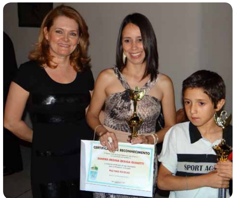
Alunos, professores e diretores receberam premiações