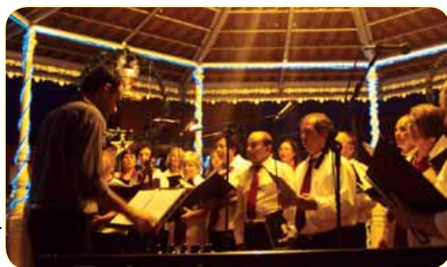
Encontro de corais será mais uma das atrações deste final de ano

Teve início na última quinta-feira, 15, com o I Encontro de Bandas e Fanfarras de Avaré, uma série de eventos culturais e esportivos que garantirão o lazer da população avareense neste final de ano.