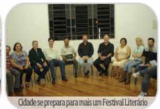
Cidade se prepara para mais um Festival Literário