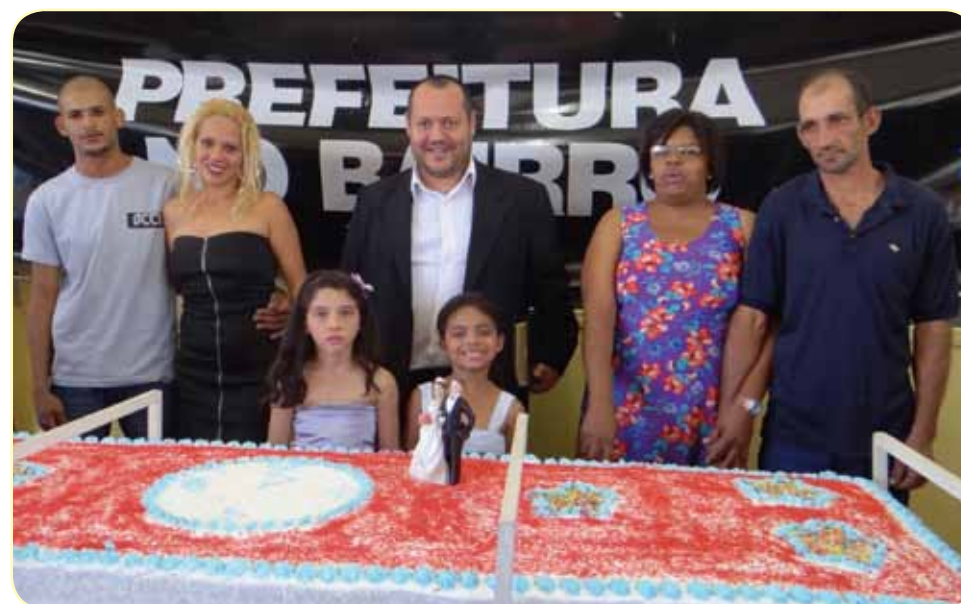
Projeto realizou mais de 200 casamentos comunitários

O Projeto Prefeitura no Bairro será realizado hoje, 24, no CEI – Centro de Educação Infantil “Geraldo Benedete”, localizado a Rua Almirante Barroso nº 111, no Bairro Bonsucesso. Esta será a 33ª edição do projeto, que tem grande participação da população avareense.