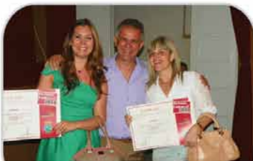
Prêmio Cultural chega a sua quarta edição

FORMATURA DOS CURSOS DAS OFICINAS CULTURAIS "JOSÉ REIS FILHO" Turmas de: Canto/Coral- Violão- Teclado e Teatro LOCAL: Oficinas Culturais "José Reis Filho" / HORÁRIO: 19h00