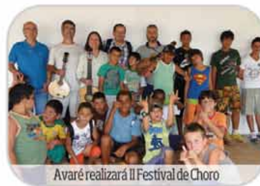
Avaré realizará II Festival de Choro