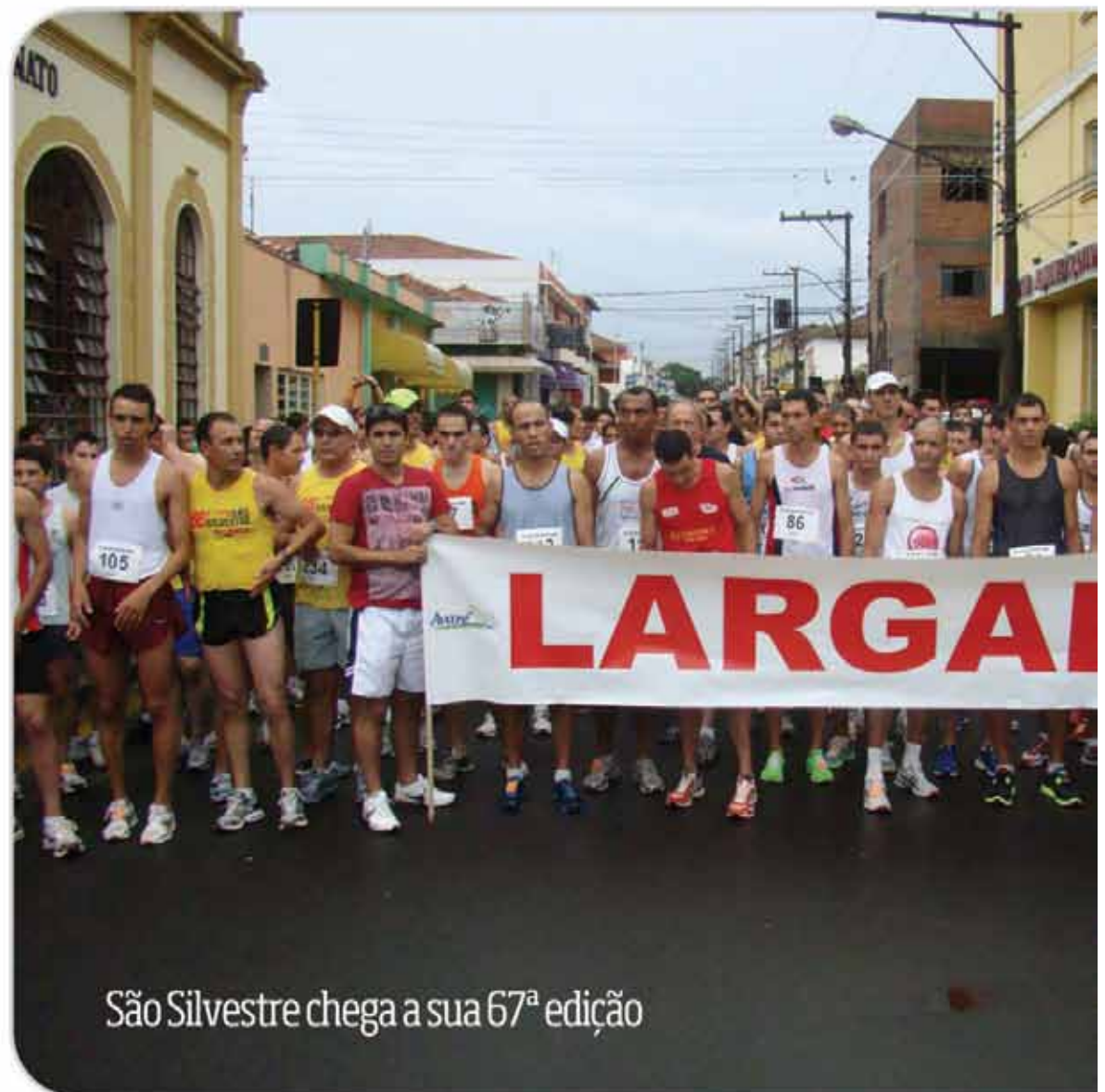
São Silvestre chega a sua 67ª edição

Dentre as inaugurações estão: Praça do idoso do Bairro Vera Cruz, novas instalações do “Bolsa Família”, Telecentro do CSU, reforma do Ginásio de Esportes “Tico do Manolo”, Cancha de Malha do Bairro Brabância, Projeto Melhor Caminho, reforma do Campo Municipal, 22 casas do Bairro Barra Grande, reformas da EMEB “Ulisses Silvestre” e “Maria Nazareth Abs Pimentel”, Restaurante Panorâmico e novos Vestiários do Camping, Barragem do Horto Florestal, I fase do asfalto do Bairro Camargo, Pistas Cobertas de Laço, ampliações do CEI “Dona Bidunga” e EMEB “Zainy Zequi” e reforma do PAS “Bonsucesso”.