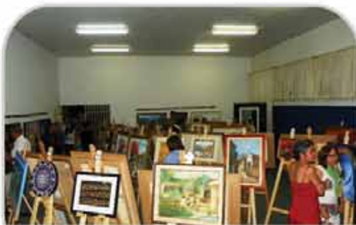
Festival de Artes Plásticas é realizado pelo quinto ano consecutivo