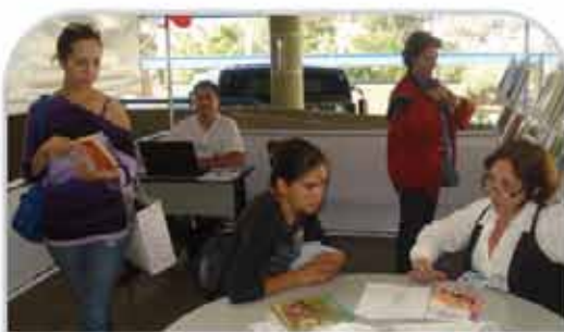
Projeto Embarque nessa Viagem acontecerá em dezembro 1

FESTIVAL NATALINO ENCONTRO DE CORAIS LOCAL: Coreto do Largo do Mercado HORÁRIO: 20h30