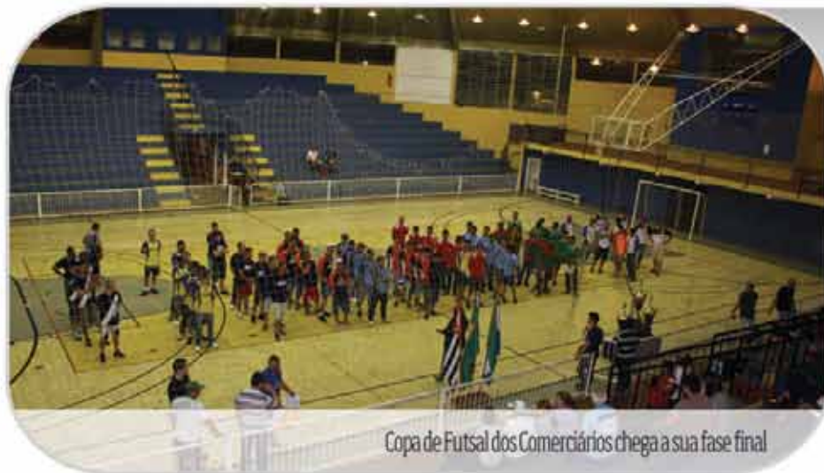
Copa de Futsal dos Comerciários chega a sua fase final