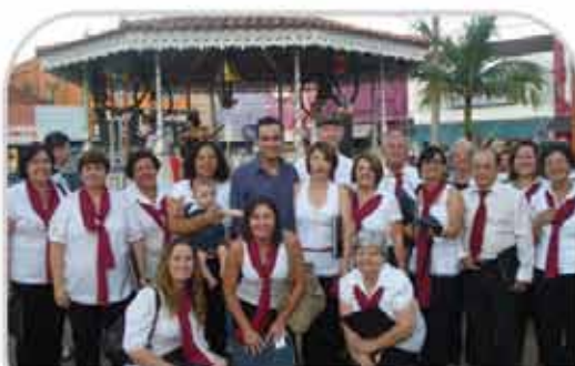
Festival Natalino promove encontro de Corais no Largo do Mercado

V FESAPLA - FESTIVAL DE ARTES PLÁSTICAS LOCAL: Empório Café Rua Rio Grande do Sul, nº 1274 HORÁRIO: 20h00