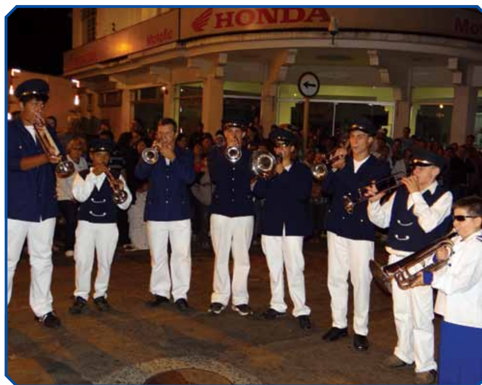
Fanfarras Marciais Voluntários de Avaré também marcou presença no evento

O público presente no local aprovou a iniciativa, vibrou com as belas apresentações das bandas e fanfarras e pediu que o evento tenha continuidade nos próximos anos, fazendo parte do calendário oficial da Estância Turística de Avaré.