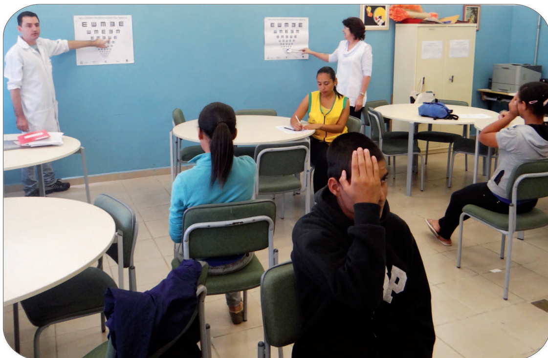
Estudantes recebem avaliação de acuidade visual

Iniciativa oferece atenção à saúde de crianças e jovens do ensino público focando na prevenção de doenças e na dieta saudável