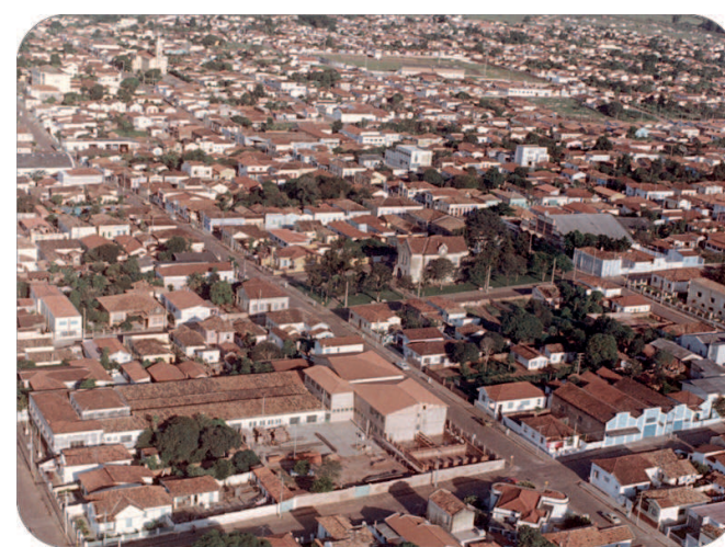
Vista aérea da Rua Goiás, 1972.