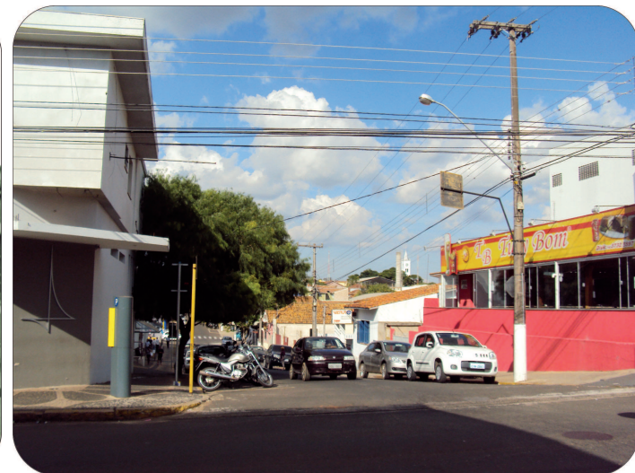
Rua Goiás vista pelo mesmo ângulo em 1964 e na atualidade.

Curiosamente, no princípio do século vinte, os imigrantes europeus radicados em Avaré fundaram suas as-