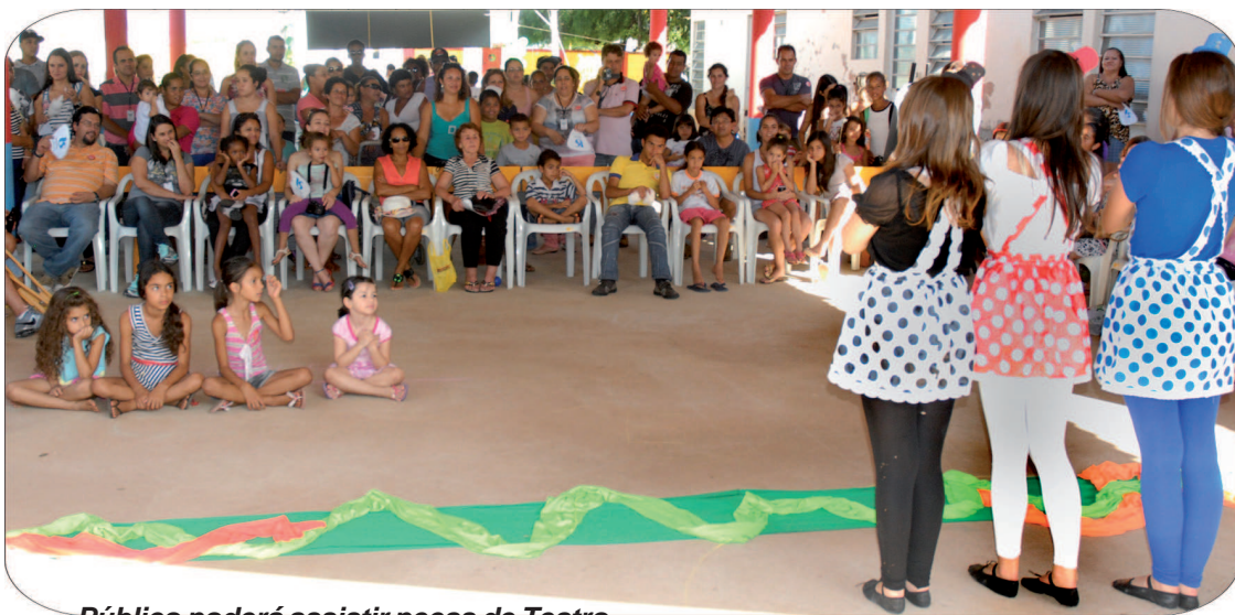
Público poderá assistir peças de Teatro

Para dar diversão, entretenimento, ações culturais e educativas e orientação de saúde para crianças, jovens e adultos, a Prefeitura promove no próximo sábado, 17 de maio, a segunda edição do programa “Avaré Viva”.