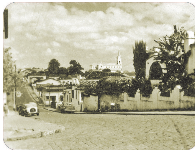
Aspecto da Rua Goiás em 1961.