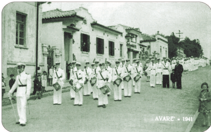
Fanfarra desfila na Rua Goiás em 1941

Com cerca de dois quilômetros de extensão, o leito da Rua Goiás principia no cruzamento com a Rua Coronel Coutinho, nas imediações da Cozinha Piloto, atravessa o centro histórico e termina na Alameda Rotary, perto da entrada lateral do Cemitério Municipal.