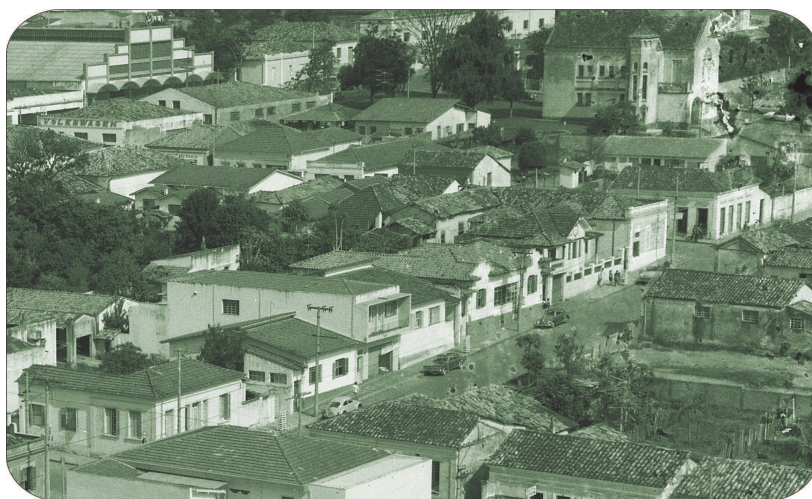
Panorâmica da via em 1969.