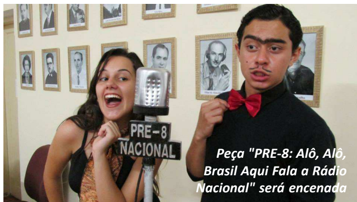
Peça "PRE-8: Alô, Alô, Brasil Aqui Fala a Rádio Nacional" será encenada

Em seguida, haverá apresentação de canto coral do Grupo Municipal de Adoles-