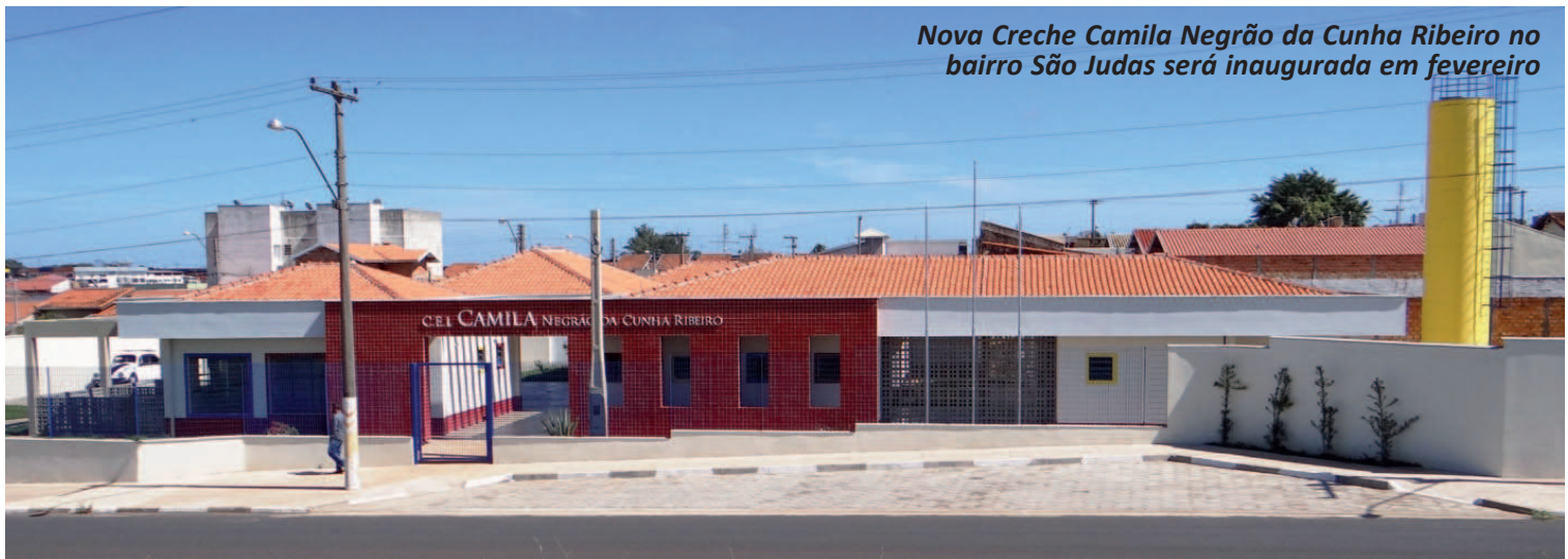
Nova Creche Camila Negrão da Cunha Ribeiro no bairro São Judas será inaugurada em fevereiro