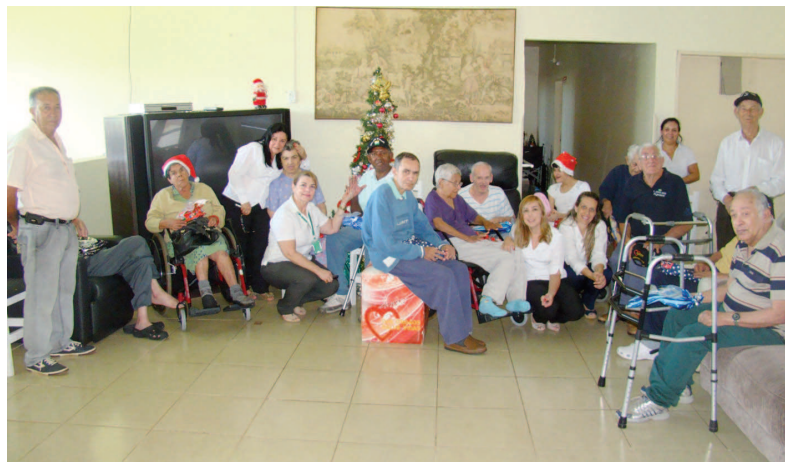
Idosos do Asilo Rafa e crianças do VANA recebem o carinho do Fundo Social

dadas, 30 serão ofertadas pelo Fundo para a Associação de Assistência e Prevenção do Câncer (AAPC). As outras 70 serão doadas à população em situação de vulnerabili-