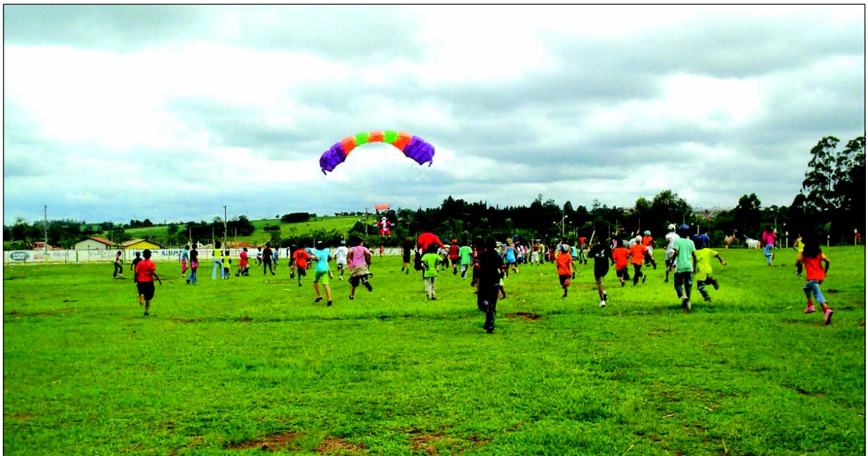
Papai Noel chegou de pára-quadras