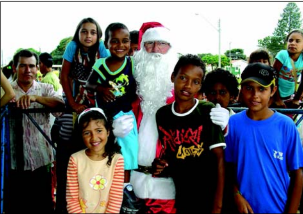
Crianças de toda a cidade participaram da festa

O ponto alto da festa foi a chegada do papai Noel, que de forma inusitada, chegou de pára-quadras para a alegria das crianças.