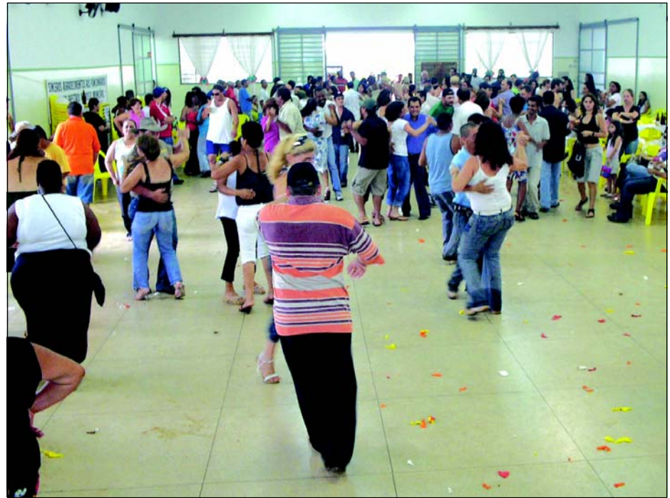
Um grande bailão animou os presentes