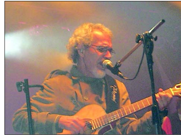
Fampop acontece em setembro

passa a acontecer em fevereiro. Em Dezembro acontece a Festa Country, com grandes shows artísticos.