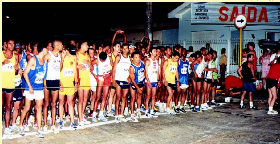
Largada da prova está marcada para às 21 horas

tada em um percurso de 10 mil metros. O trajeto será o mesmo do ano passado, com a saída de frente a agência dos Correios na Rua Rio Grande do Sul e a chegada na Rua Alagoas, de frente ao Centro Avareense.