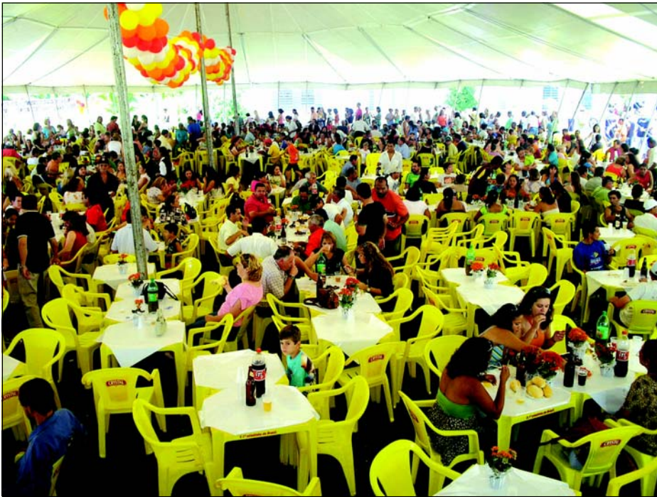
A comemoração já é tradicional entre os funcionários