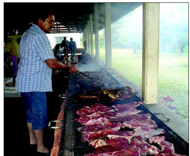
Um grande churrasqueira foi montada para atender tanta gente