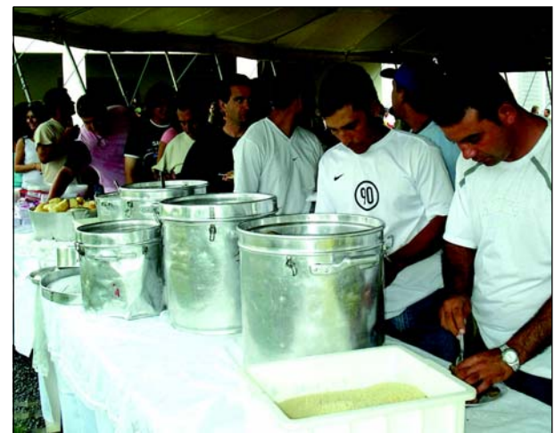
Os funcionários se serviram a vontade

As inscrições podem ser feitas na SEME (Concha Acústica – 3732 0756), ACIA (Rua Rio de Janeiro, 1622 – 3733 1366). Maiores informações podem ser obtidas pelo telefone 3732 1589.