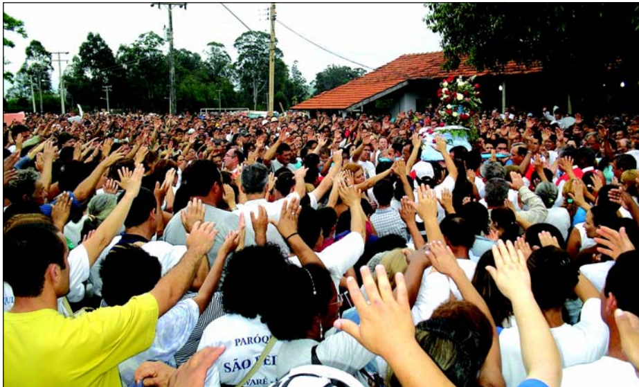
Procissão em Louvor a Nossa Senhora Aparecida passa a fazer parte do Calendário Oficial

O calendário conta com os eventos agendados recentemente, como por exemplo a tradicional procissão em louvor a Nossa Senhora Aparecida, que ocorre anualmente no dia 12 de outubro no Bairro Ponte