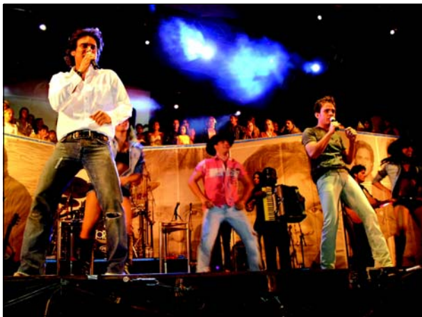
Fest Country acontece em dezembro

Outros eventos importantes são mantidos em suas datas tradicionais, como o Arraia do Nhô Musa, que acontece em junho ou julho, a Fampop, realizada em setembro, e a Feira das Nações, que também ocorre em setembro.