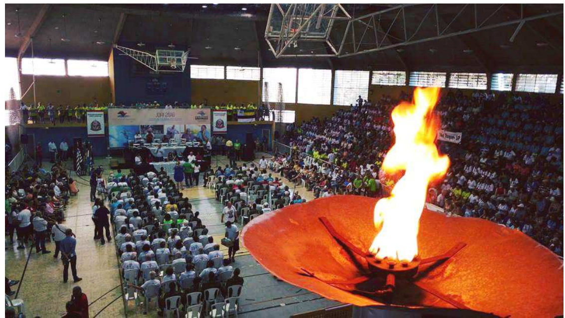
Pira Olímpica acesa durante os Jogos Regionais do Idoso em Avaré

Biblioteca e Poupatempo oferecem acesso gratuito à internet