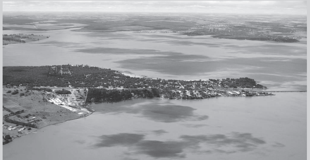
Vista panorâmica da Represa de Jurumirim, às margens do município de Avaré.

IMPACTOS AMBIENTAIS – Mais de 50 mil hectares de terras sofreram desapropriação judicial e fo-