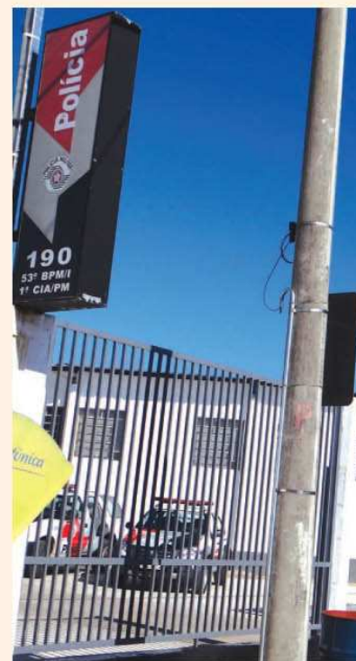
Inauguração do 53º Bat