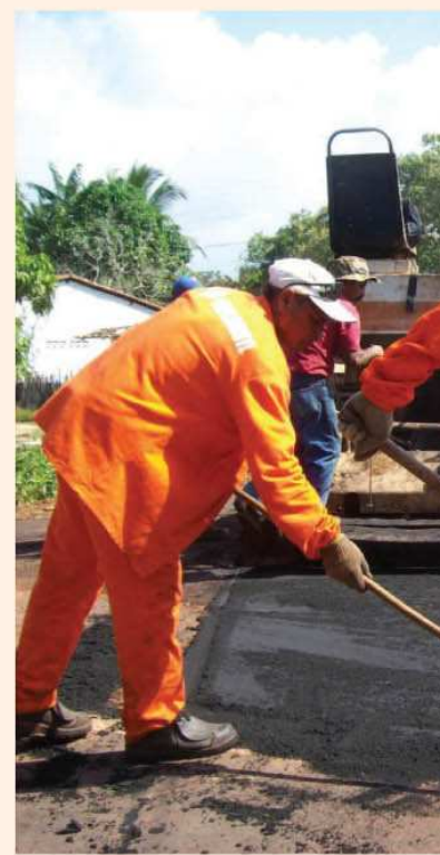
Ruas Miguel Chibani e Emílio