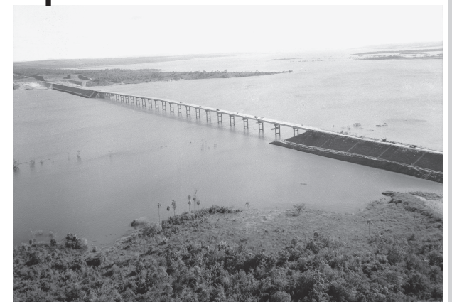
A ponte, recém-inaugurada, 1962.