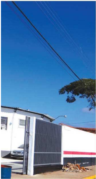
alhão da Polícia Militar