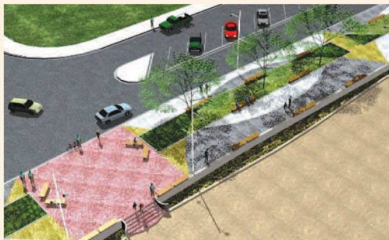
Calçadão ligará Camping ao Balneário Costa Azul