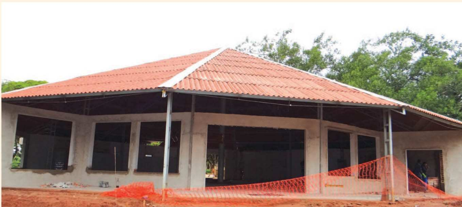
Camping Municipal ganhará restaurante panorâmico