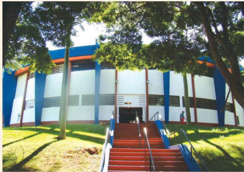
Ginásio de Esportes Kim Negrão está pronto para os Jogos Regionais