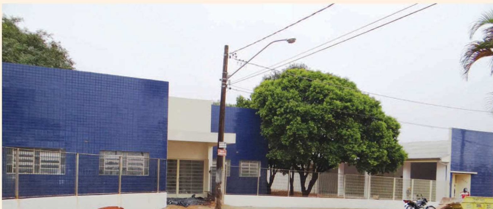
Inauguração da EMEB Licinia Guazelli

A cidade da Estância Turística de Avaré terá um final de semana movimentado com a inauguração de diversas obras, o lançamento de pedras fundamentais e um grande encontro de sambistas na Concha Acústica de Avaré. Confira abaixo a programação completa que se estende até a próxima quinta-feira, 05.