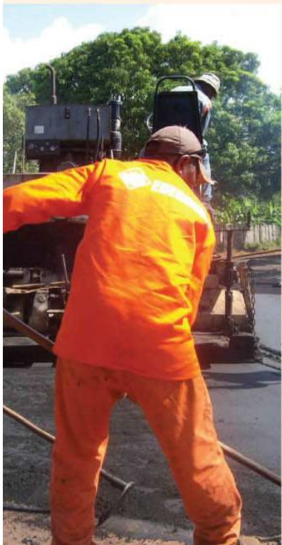
Figueiredo foram asfaltadas