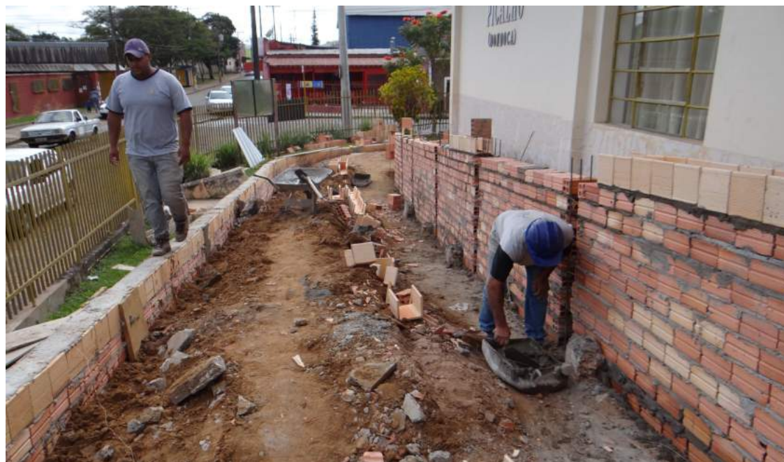
Rampa de acessibilidade está sendo construída na parte frontal do prédio

A empresa responsável pelas obras já está trabalhando na reforma dos banheiros masculino e feminino e na edificação de uma rampa de acessibilidade. A cozinha e a secretaria da escola passarão por troca de piso e a planilha prevê ainda pintura geral, interna e externa, e projeto de prevenção do Corpo de Bombeiros. A previsão para o término é de quatro meses.