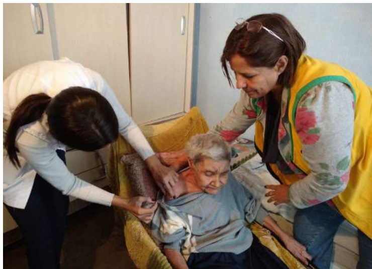
Idosa é imunizada em sua residência no Plimec

Prosegue em Avaré a vacinação contra a gripe H1N1. Dados da Vigilância Epidemiológica, órgão vinculado à Secretaria Municipal da Saúde, contabilizam até 5 de maio 11.696 doses aplicadas da vacina. A meta da campanha na cidade é imunizar 19.465 pessoas dos grupos prioritários. Devem tomar a vacina crianças entre 6 meses e menores de 5 anos, gestantes e puérperas (que