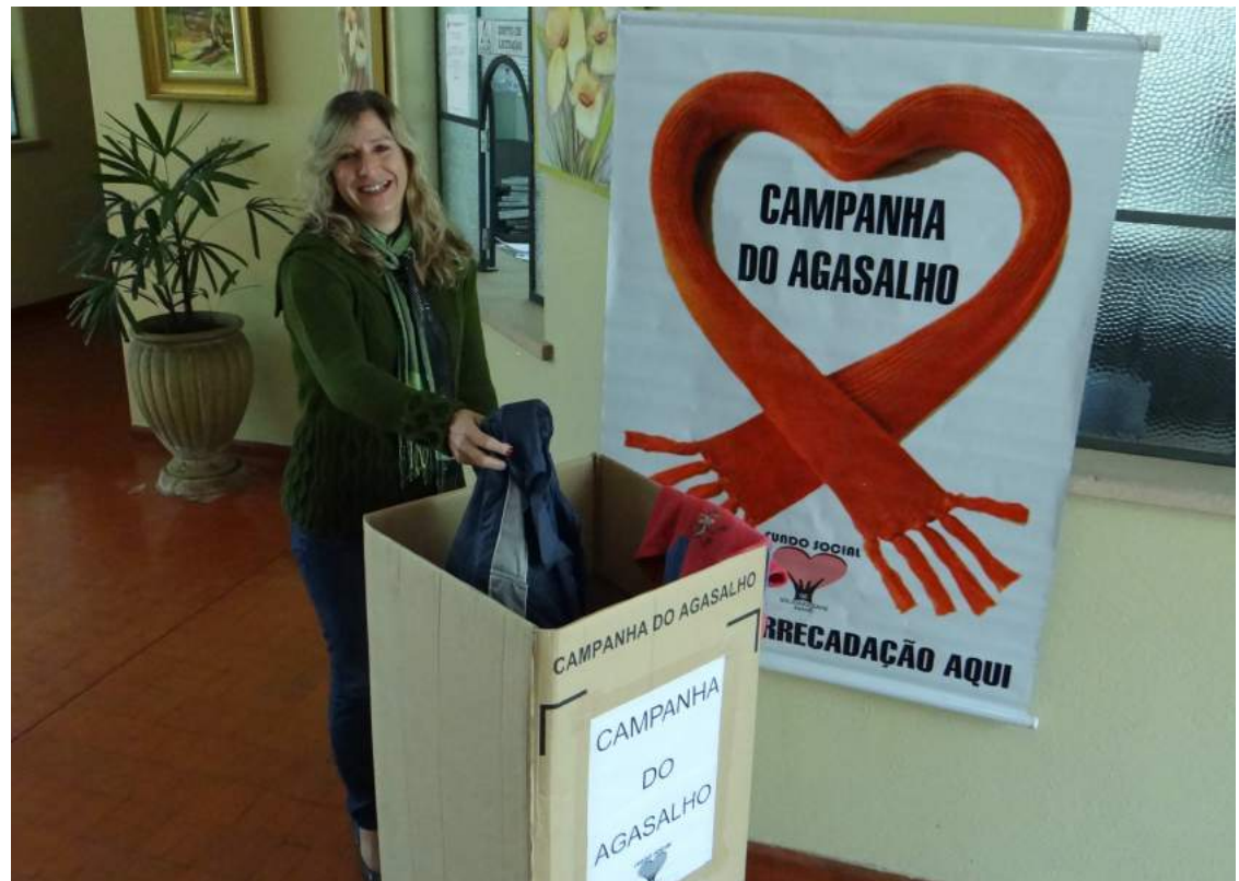
Caixas coletoras estão distribuídas nos prédios municipais