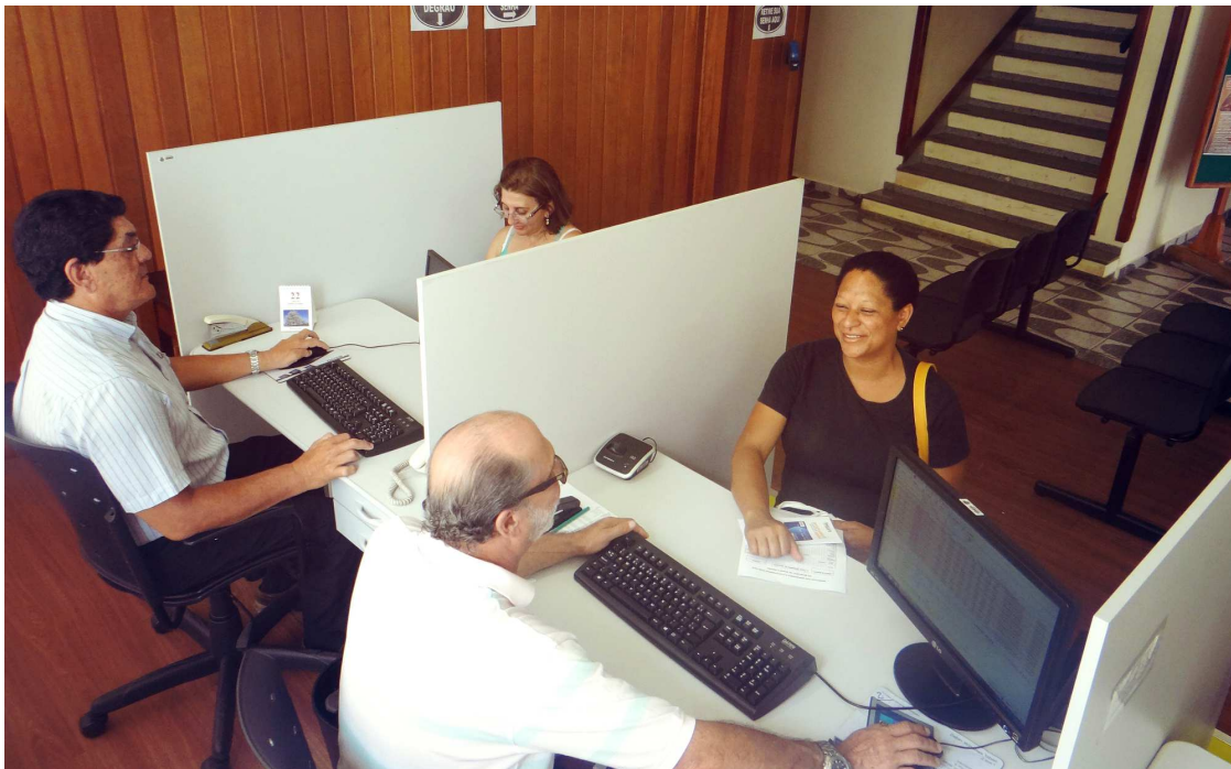
Centro Administrativo agora atende o público das 8h às 14h