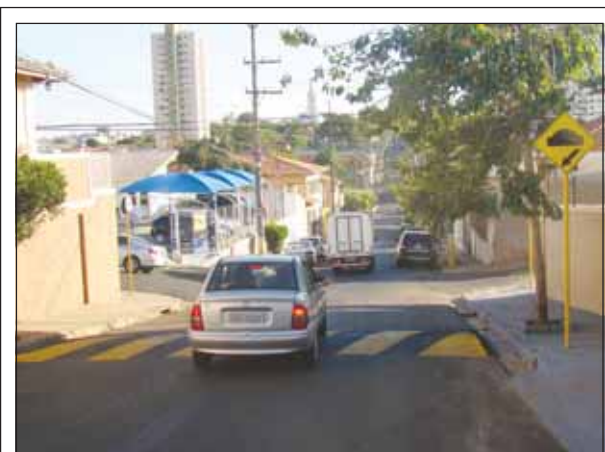
A Secretaria de Transportes e Sistema Viário instalou dois redutores de velocidades (lombadas) para garantir a segurança dos pedestres e o regular fluxo de veículos na Rua Bahia.

Associação de Assistência e Prevenção do Câncer promove Encontro de Saúde em Oncologia