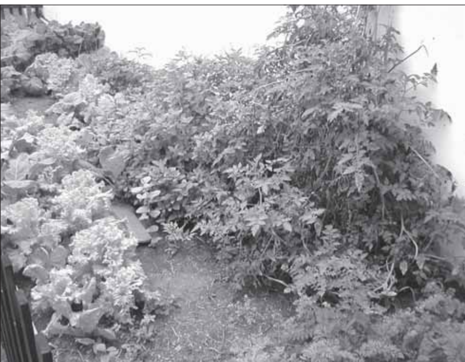
A horta já está produzindo e distribuindo hortaliças aos moradores

bairro. A horta comunitária do Jardim Brasil conta com apoio da Prefeitura que abastece os canteiros com água três vezes por semana. Ela é cultivada na Rua Salim Curiati, ao lado da Praça das Mães.