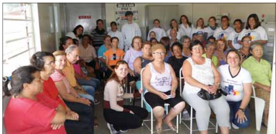
População que participou da palestra

No dia 27 de outubro, a equipe do Estratégia Saúde da Família I “Dr. Cecílio Jorge Neto”, em parceria com alunos do 1º módulo noturno do Curso Técnico em Nutrição de Dietética da ETEC de Avaré, realizaram palestra com o tema