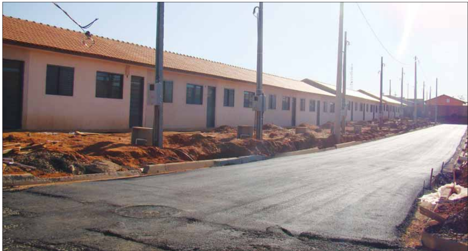
Serão entregues 227 casas dos conjuntos habitacionais Vale do Sol (93 moradias) e Vila Serena (134 moradias)

O sorteio das casas aconteceu no dia 26 de setembro no Ginásio de Esportes Kim Negrão, que permaneceu repleto de pessoas até o final. Os critérios de seleção dos inscritos se-