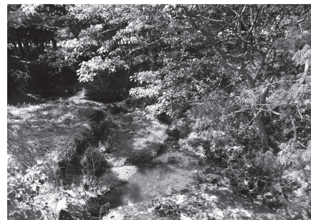
O Disk-Verde aceita denúncias de contaminação de rios e nascentes

Para a Prefeitura o Disk-Verde é o meio mais direto para notificar quem infringe a lei por desconhecimento dos culpados. "A ideia é conscientizar