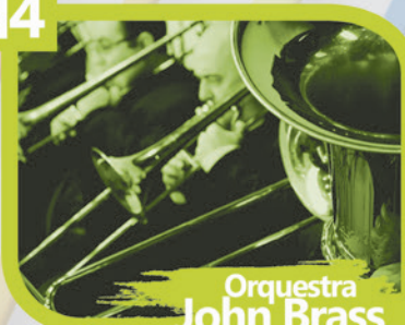
Orquestra John Brass