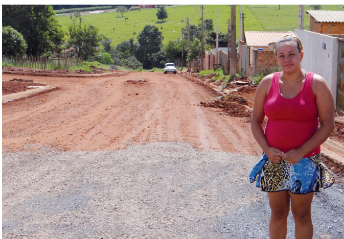
Serviço sendo executados há duas semanas