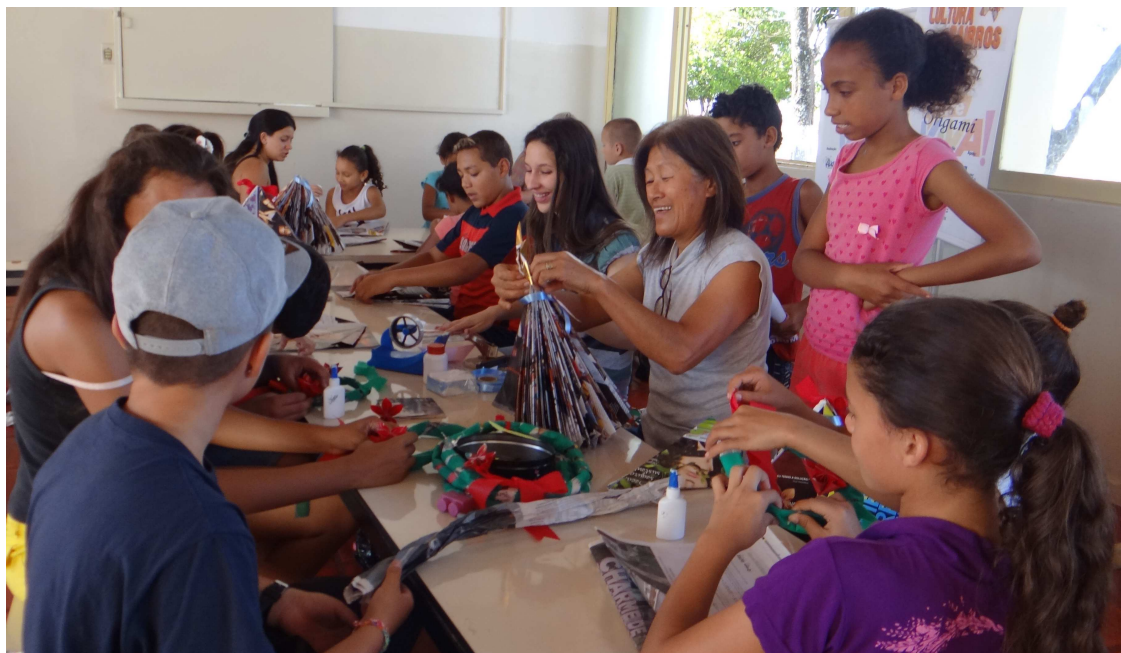
Crianças participam de oficina de artes manuais

Aberto ao público de todas as idades, o I Festival Cultural de Talentos premiará em dinheiro revelações da música, dublagem, contadores de piadas, imitadores, entre outros gêneros artísticos. Saiba como participar pelo telefone 3732.5057. Sucesso em 2014, o Festival Regional Sertanejo, em sua segunda edição, passará a premiar também em dinheiro os vitoriosos de cada eliminatória.