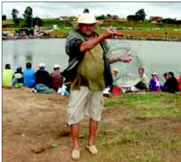
Pescadores puderam levar para casa todo o peixe fisgado

Além da premiação, os pescadores levaram pra casa todo o peixe pescado.