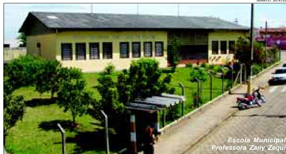
Escola Municipal Professora Zany Zequi

Quando estiver construído a nova escola municipal no Bairro Alto, ficará em disponibilidade ao município os dois prédios escolares atuais, considerados já ultrapassados, motivo pelo qual já foi definido que junto ao prédio da Escola Professora Zany Zequi serão feitos trabalhos de adaptação e adequação do imóvel para transformação em PAS. Página 7.