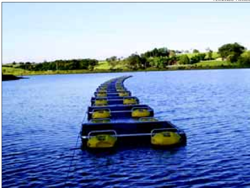
Projeto da ACRIPPA: meta é atingir 250 gaiolas em produção