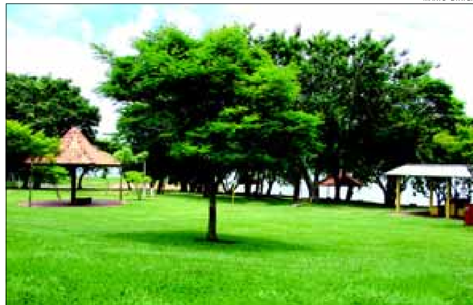
Restaurante é uma antiga reivindicação dos frequentadores do local

Em breve a Prefeitura da Estância Turística de Avaré dará início em breve a construção de um Restaurante Panorâmico no Camping Municipal. A obra será realizada no