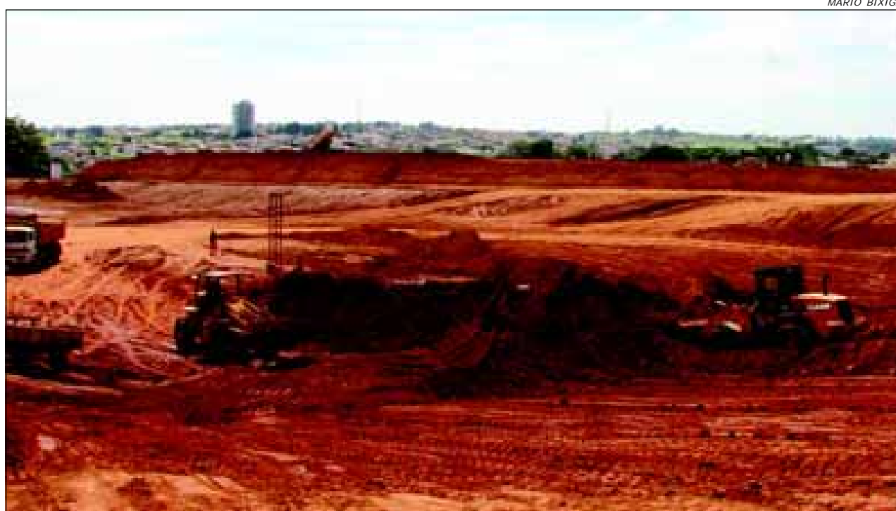
Local onde está sendo construído o Arenão, junto ao Parque Municipal de Exposições Dr. Fernando Cruz Pimentel

Continuam em andamento acelerado as obras de construção do Arenão junto ao Parque de Exposições Dr. Fernando Cruz Pimentel, considerando-se que os serviços de terraplenagem que é a principal etapa do projeto estão bastante adiantadas, no entanto, segundo vistorias do corpo técnico da municipalidade nesta semana, ainda faltam aproximadamente sete metros de profundidade para escavação para atingir as dimensões previstas em projeto.