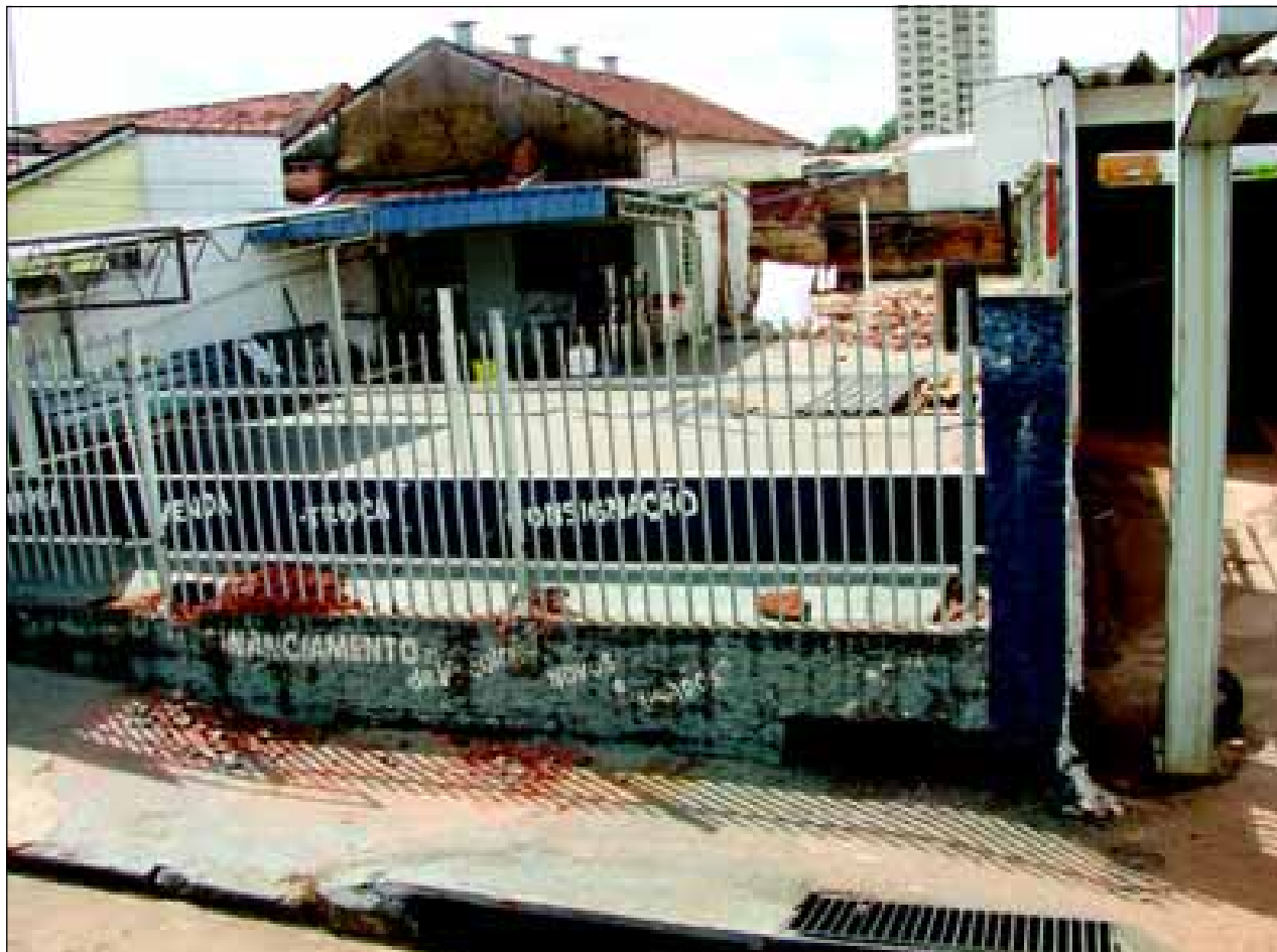
Local onde será iniciado a construção do novo canal a céu aberto para escoamento de águas pluviais

O projeto inicial nessas imediações prevê da Rua Mato Grosso a Rua Rio Grande do Norte e tem contado com o apoio de moradores, proprietários e empresários, onde alguns deles já colocaram a disposição da municipalidade a faixa de abrangência do canal, pois em suas opiniões os beneficiados finais serão eles mesmos, haja visto que, com o início da provável estiagem estará se entrando na época propícia para início dessas obras.