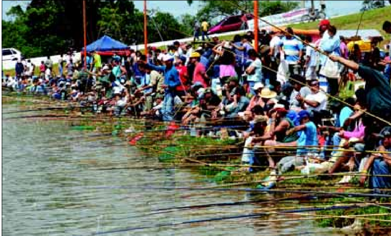
Foram mais de 2200 inscrições nos dois dias do torneio

Aconteceu no último dia 15 e 16 de março, o 3º Torneio de Pesca no Largo Berta Banwart no bairro Brabância.