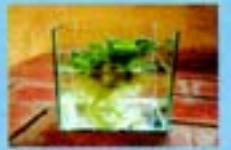
Se você tiver vasos de plantas aquáticas, troque a água e lave o vaso com escova, água e sabão uma vez por semana.