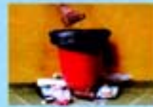
Jogue no lixo todo objeto que possa acumular água, como embalagens usadas, potes, latas, copos, garrafas vazias, etc.