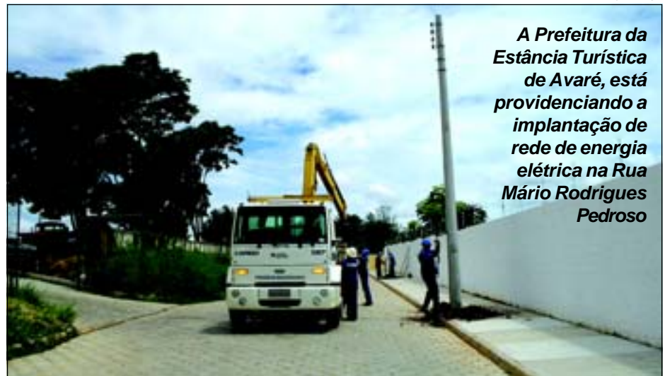
A Prefeitura da Estância Turística de Avaré, está providenciando a implantação de rede de energia elétrica na Rua Mário Rodrigues Pedroso

Principal acesso ao futuro IML-Instituto Médico Legal, que em breve estará sendo inaugurado, a Prefeitura Municipal da Estância Turística de Avaré, está providenciando a implantação de rede de energia elétrica, com iluminação pública na Rua Mário Rodrigues Pedroso, que será o principal acesso ao referido órgão público. Página 24.