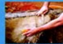
Lave com escova e sabão os tanques utilizados para armazenar água do lado de fora da casa.