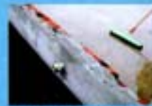
Não deixe a água da chuva acumulada sobre a laje da sua casa.