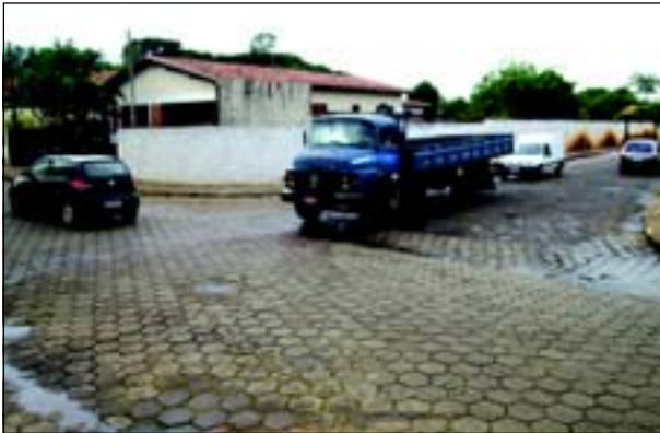
Rua Lineu Prestes com Jango Pires estará recebendo em breve a implantação de um semáforo

SECRETARIA DE TRANSPORTES E SISTEMA VIÁRIO