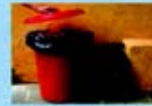
Coloque o lixo em sacos plásticos e mantenha a lixeira bem fechada. Não jogue lixo em terrenos baldios.