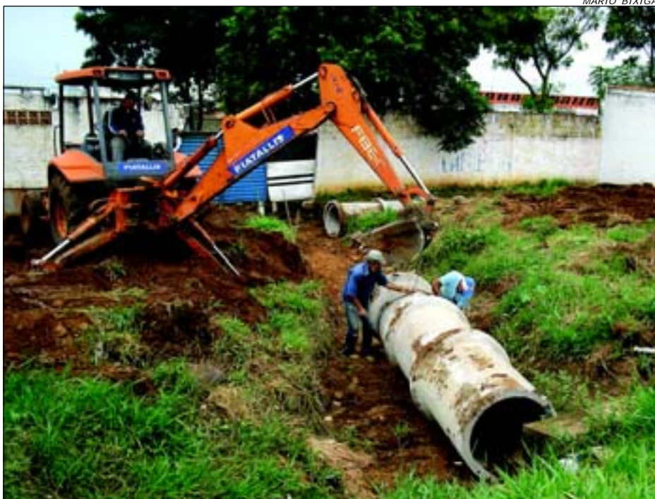
Após a implantação da linha de tubulação a Prefeitura fará a cobertura com aterramento dos terrenos junto a obra, com nivelamento e plantio de grama

A Prefeitura Municipal da Estância Turística de Avaré, iniciou os trabalhos para implantação de linha de tubulação junto a terrenos vagos, na divisa com a Avenida Anápolis, no Parque Industrial Jurumirim, obra essa que tem como objetivo principal a canalização de águas pluviais que advem da rua Óleo e ou-