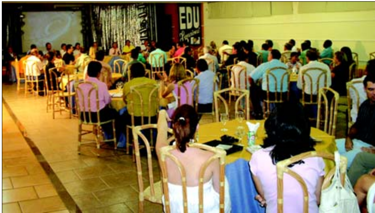
O encontro foi uma iniciativa da Secretaria de Comunicação e contou com a presença de autoridades de várias a região

cidades que margeiam a represa assumiram com-