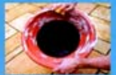
Lave com escova e sabão os utensílios usados para guardar água em casa, como jarras, garrafas, potes, baldes, etc.