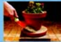
Encha de areia até a borda os pratinhos dos vasos de planta.