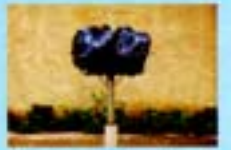
Mantenha o saco de lixo bem fechado, e fora do alcance de animais, até o recolhimento pelo serviço de limpeza urbana.