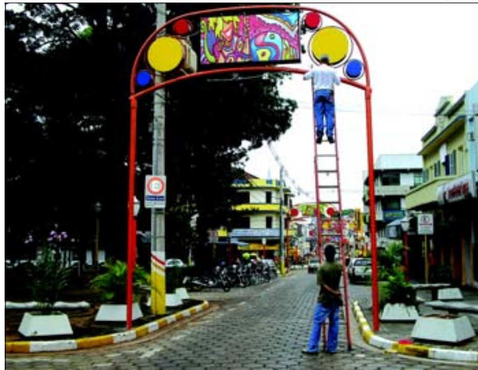
Enfeites de temas carnavalescos trazem ao centro maior brilho e alegria, valorizando a área central

que é uma importante via pública de entrada da cidade e comércio variado e ativo, destacando também que em complemento a obra, será construída uma travessa pavimentada de interligação da Avenida Anápolis com a Rua Óleo, criando uma nova opção de acesso ao centro do bairro para os motoristas de demais usuários.