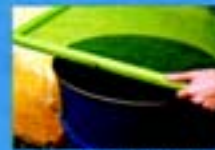
Fechee bem tonéis, barris ou jarras d'água. Utilize tampa própria ou uma tela.