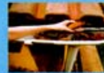
Remova folhas, galhos e tudo que possa impedir a água de correr pelas calhas de chuva.