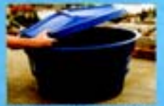
Mantenha a caixa d'água fechada com tampa adequada, sem rachaduras, frestas ou desníveis. Vedee com tela a abertura da saída do excesso d'água (o "ladão").