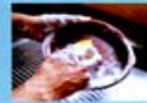
Se você não colocou areia e acumulou água do vaso no pratinho, lave-o com escova, água e sabão. Faça isso uma vez por semana.