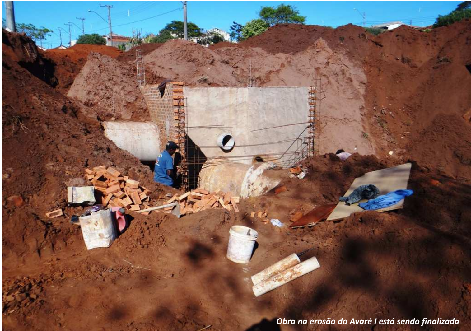
Obra na erosão do Avaré I está sendo finalizada

Estão sendo conectados os tubos de concreto à caixa de recepção e posteriormente será feito o aterramento do local. Uma caixa central de recepção de águas pluviais está reconstruída, a área foi novamente canalizada e será aterrada para que seja possível transitar pelo trecho, que há vários meses estava interdito devido aos estragos provocados pelo deslizamento de terras.