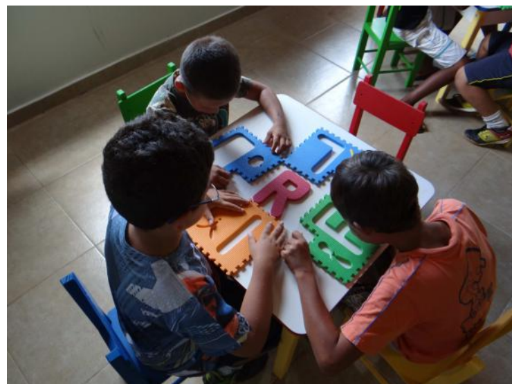
Convênio com a Colônia Espírita Fraternidade permite o atendimento a mais crianças

Outro avanço foi a implantação, em 2015, do Centro Dia do Idoso "Luiz De Paschoal", que hoje atende 20 pessoas que antes estavam em situação de risco por não terem condições de saúde e autonomia para passar o dia sozinhos em casa.