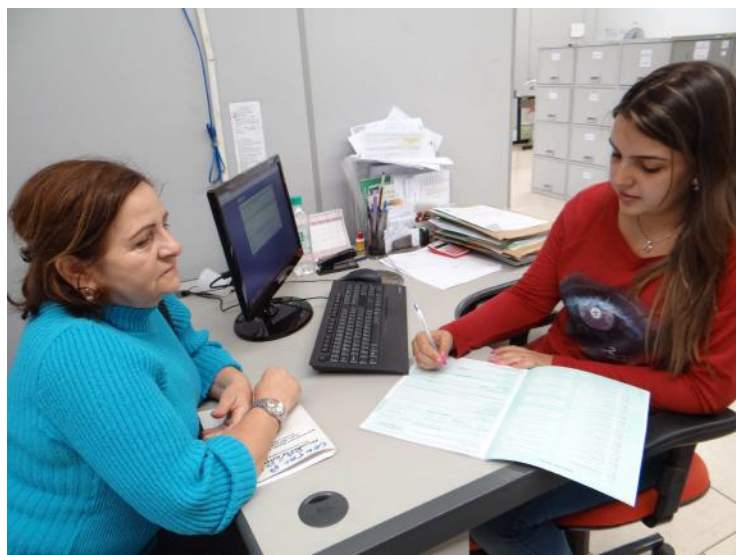
Usuária do CRAS do Bonsucesso recebendo atendimento

A Prefeitura adquiriu para o setor 6 veículos zero km por meio de recursos federal e estadual, renovou o mobiliário e equipamentos de uso da Semads, implantou fluxo de atendimento entre todos os serviços do