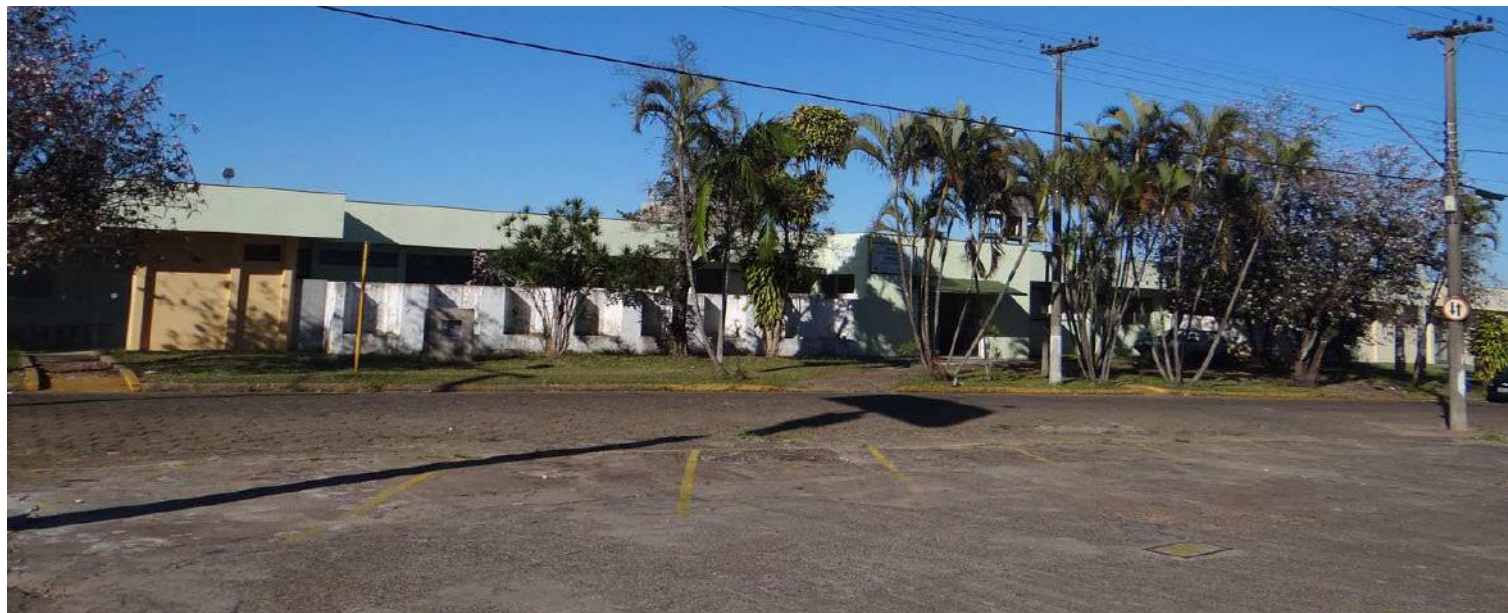
Futuro AME será construído em área localizada atrás do antigo Hospital Geral

A obra, orçada em R$ 711 mil tem prazo de 4 meses para execução e será subsidiada com recursos do Banco Interamericano de Desenvolvimento (BID). De acordo com o governador Geraldo Alckmin, que anunciou em maio último a realização da obra, o Am-