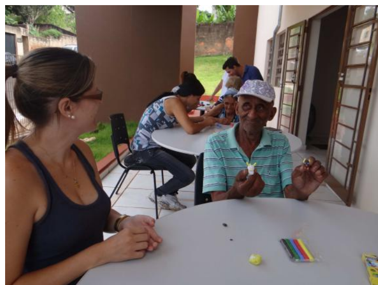
Idoso recebe atenção especial no Centro Dia