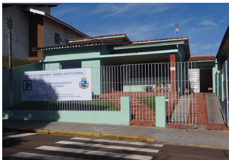
Prédio da Casa de Passagem

aderem às orientações e nem demonstram interesse no atendimento da Semads, a equipe da Casa de Passagem insiste em orientá-los para buscar meios de deixar a situação de rua.