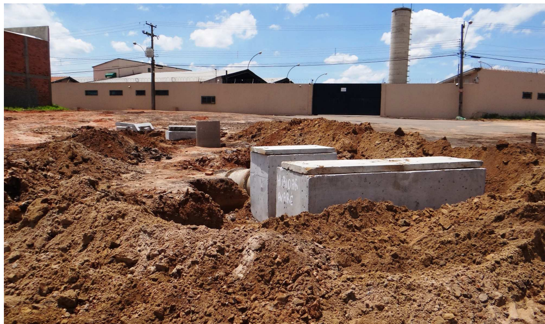
Via é preparada para receber pavimentação asfáltica

próximos dias a implantação de 1.424 metros de guias e