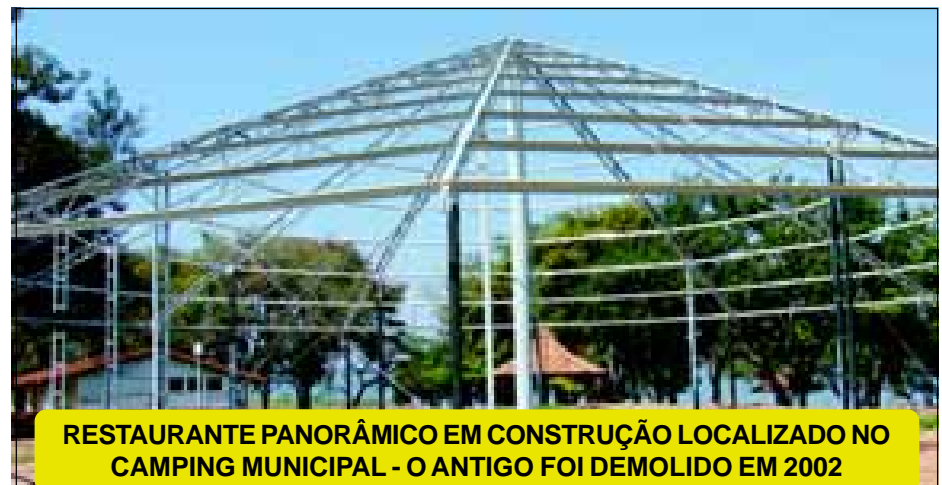
RESTAURANTE PANORÂMICO EM CONSTRUÇÃO LOCALIZADO NO CAMPING MUNICIPAL - O ANTIGO FOI DEMOLIDO EM 2002