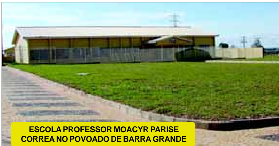
ESCOLA PROFESSOR MOACYR PARISE CORREA NO POVOADO DE BARRA GRANDE