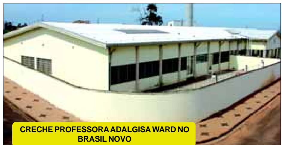
CRECHE PROFESSORA ADALGISA WARD NO BRASIL NOVO