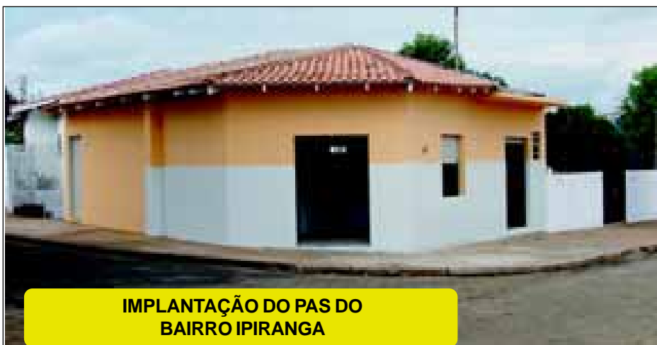
IMPLANTAÇÃO DO PAS DO BAIRRO IPIRANGA