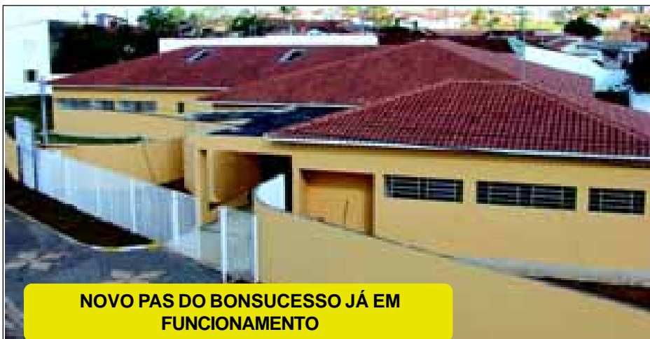
NOVO PAS DO BONSUCESSO JÁ EM FUNCIONAMENTO