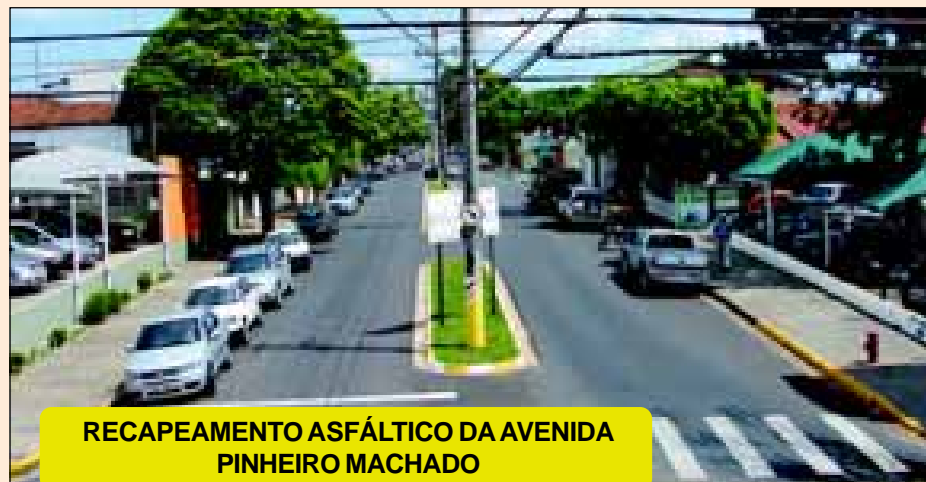
RECAPEAMENTO ASFÁLTICO DA AVENIDA PINHEIRO MACHADO