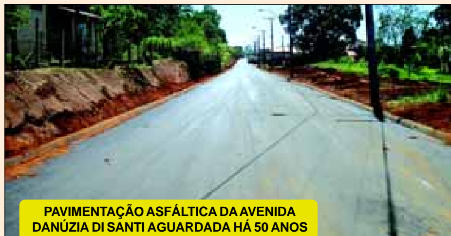
PAVIMENTAÇÃO ASFÁLTICA DA AVENIDA DANÚZIA DI SANTI AGUARDADA HÁ 50 ANOS