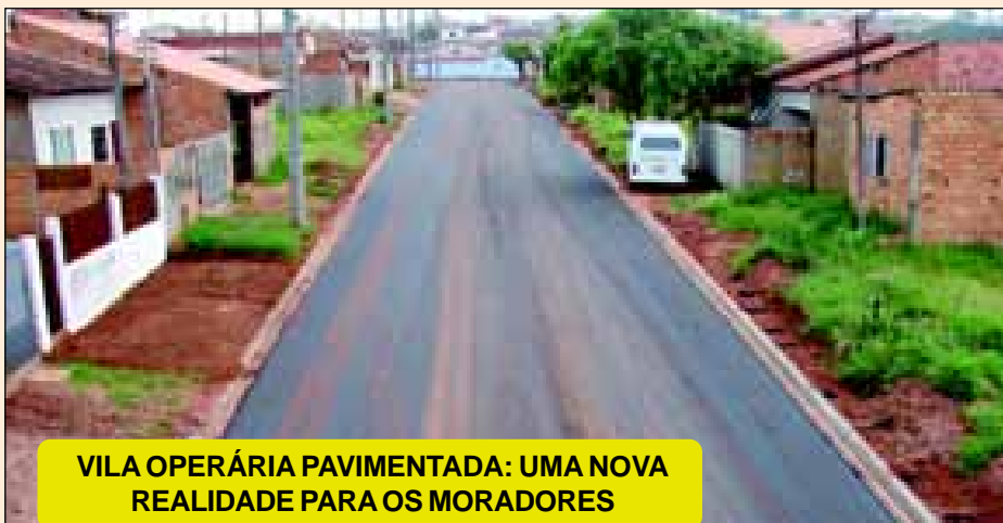
VILA OPERÁRIA PAVIMENTADA: UMA NOVA REALIDADE PARA OS MORADORES