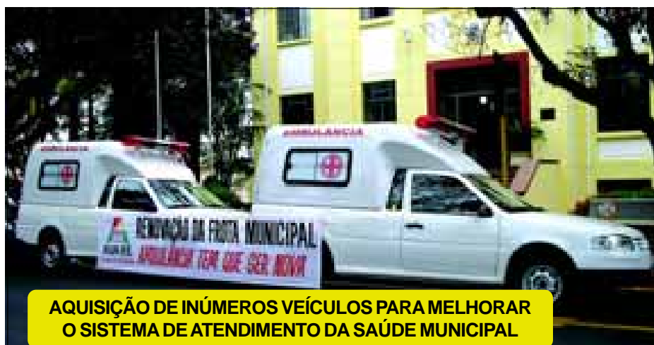
AQUISIÇÃO DE INÚMEROS VEÍCULOS PARA MELHORAR O SISTEMA DE ATENDIMENTO DA SAÚDE MUNICIPAL