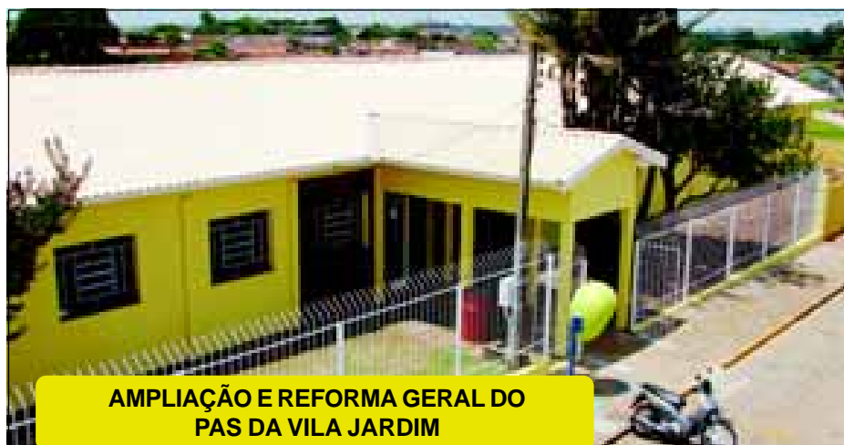
AMPLIAÇÃO E REFORMA GERAL DO PAS DA VILA JARDIM