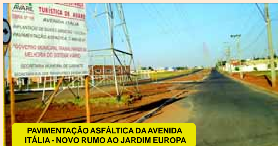
PAVIMENTAÇÃO ASFÁLTICA DA AVENIDA ITÁLIA - NOVO RUMO AO JARDIM EUROPA