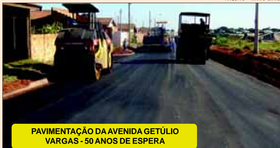
PAVIMENTAÇÃO DA AVENIDA GETÚLIO VARGAS - 50 ANOS DE ESPERA