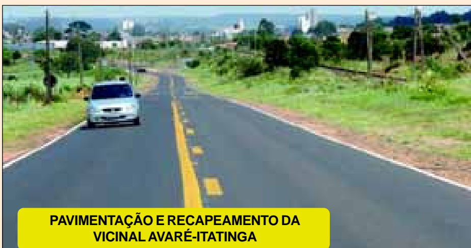
PAVIMENTAÇÃO E RECAPEAMENTO DA VICINAL AVARÉ-ITATINGA