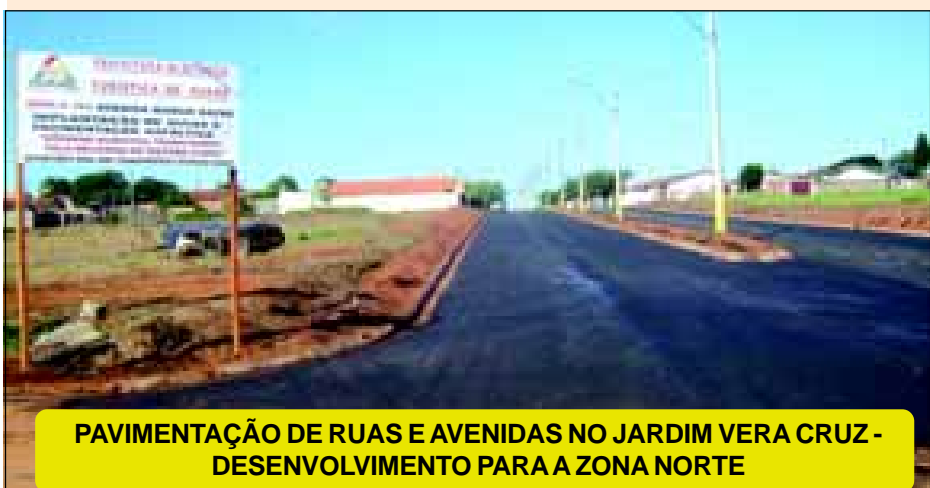
PAVIMENTAÇÃO DE RUAS E AVENIDAS NO JARDIM VERA CRUZ - DESENVOLVIMENTO PARA A ZONA NORTE