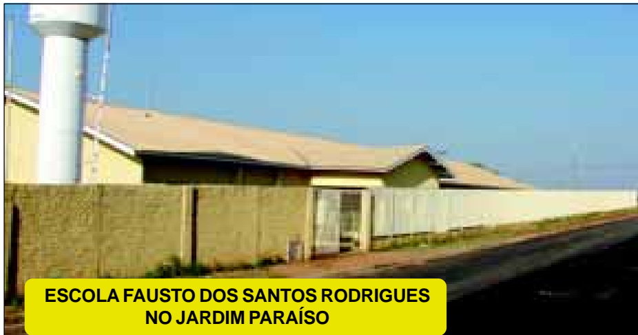
ESCOLA FAUSTO DOS SANTOS RODRIGUES NO JARDIM PARAÍSO