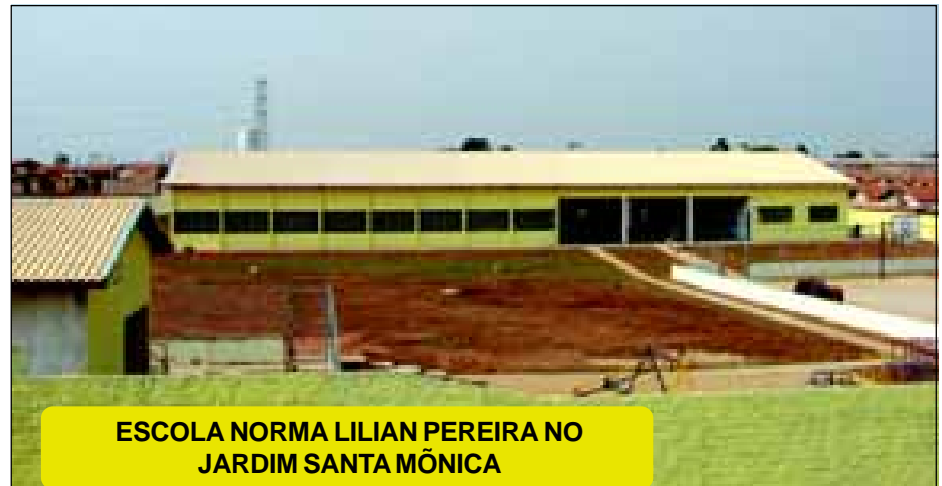
ESCOLA NORMA LILIAN PEREIRA NO JARDIM SANTA MÔNICA