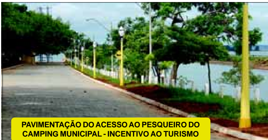
PAVIMENTAÇÃO DO ACESSO AO PESQUEIRO DO CAMPING MUNICIPAL - INCENTIVO AO TURISMO