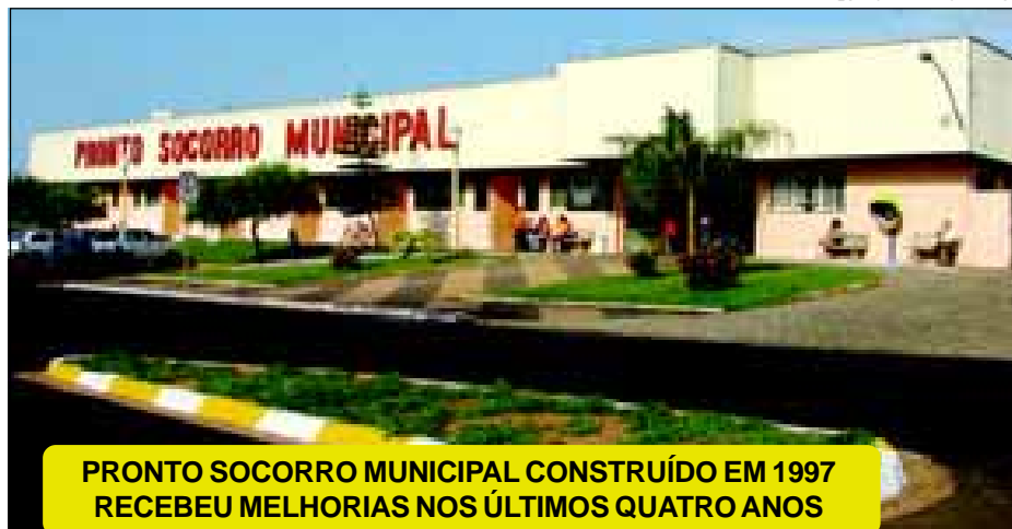
PRONTO SOCORRO MUNICIPAL CONSTRUÍDO EM 1997 RECEBEU MELHORIAS NOS ÚLTIMOS QUATRO ANOS