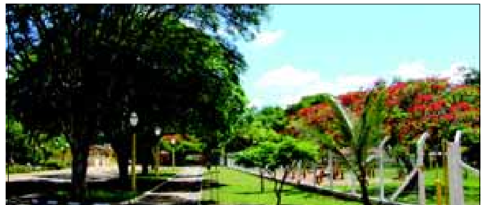
INÚMEROS INVESTIMENTOS NO CAMPING MUNICIPAL FIZERAM DAQUELE ESPAÇO UM DOS MAIS BEM ESTRUTURADOS DO INTERIOR