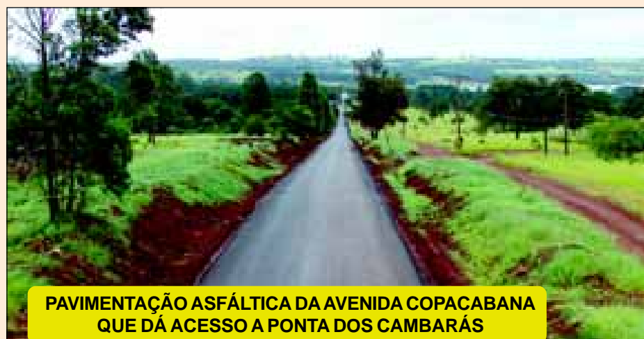
PAVIMENTAÇÃO ASFÁLTICA DA AVENIDA COPACABANA QUE DÁ ACESSO A PONTA DOS CAMBARÁS