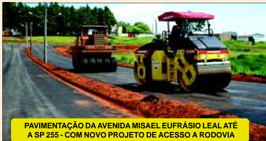
PAVIMENTAÇÃO DA AVENIDA MISAEL EUFRÁSIO LEAL ATÉ A SP 255 - COM NOVO PROJETO DE ACESSO A RODOVIA