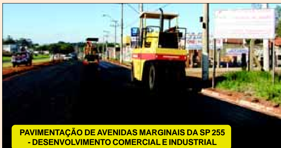
PAVIMENTAÇÃO DE AVENIDAS MARGINAIS DA SP 255 - DESENVOLVIMENTO COMERCIAL E INDUSTRIAL