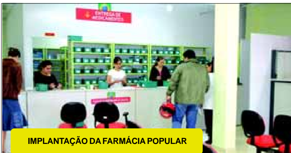
IMPLANTAÇÃO DA FARMÁCIA POPULAR