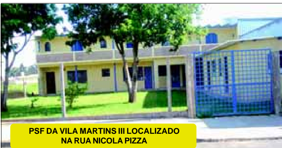
PSF DA VILA MARTINS III LOCALIZADO NA RUA NICOLA PIZZA