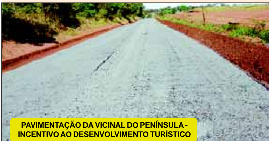
PAVIMENTAÇÃO DA VICINAL DO PENÍNSULA - INCENTIVO AO DESENVOLVIMENTO TURÍSTICO