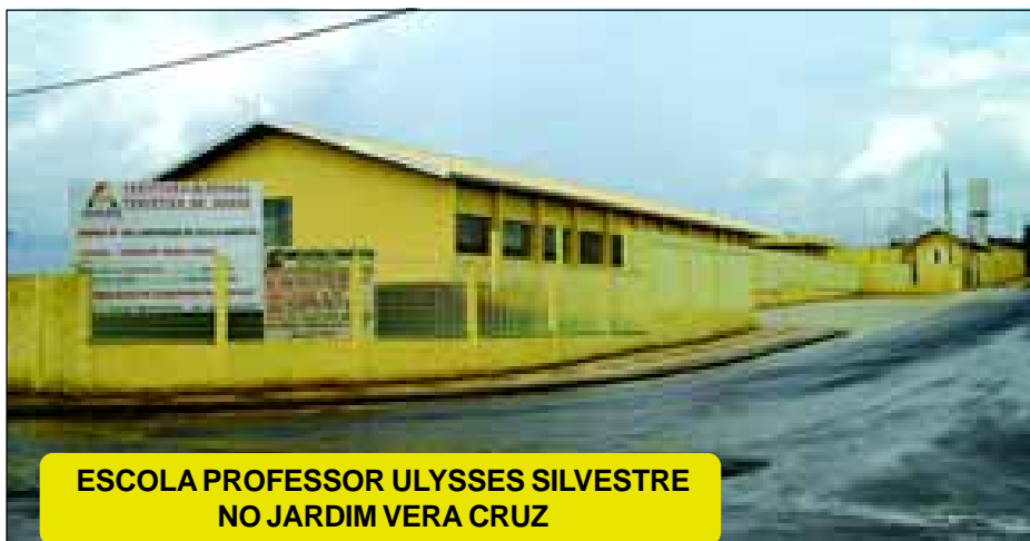
ESCOLA PROFESSOR ULYSSES SILVESTRE NO JARDIM VERA CRUZ