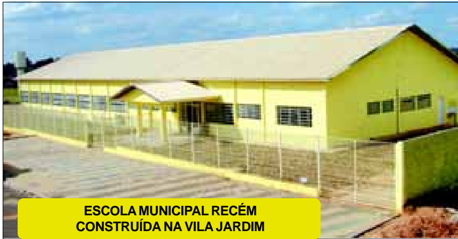
ESCOLA MUNICIPAL RECÉM CONSTRUÍDA NA VILA JARDIM