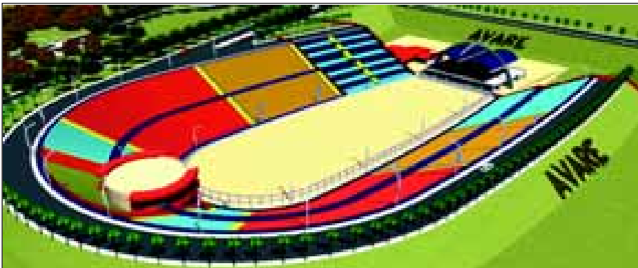
ARENÃO - PREVISÃO DE CAPACIDADE PARA 30 MIL PESSOAS SENTADAS - OBRAS DE TERRAPLENAGEM E ESCAVAÇÃO JÁ CONCLUÍDAS