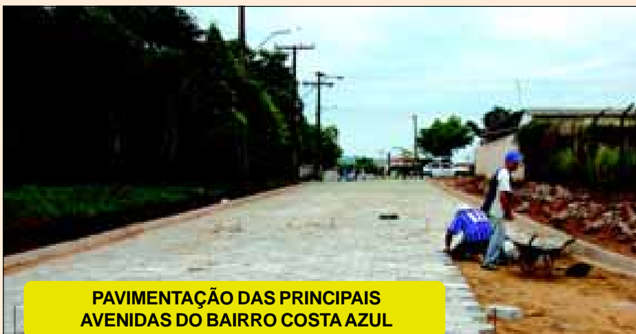
PAVIMENTAÇÃO DAS PRINCIPAIS AVENIDAS DO BAIRRO COSTA AZUL