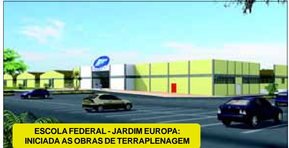
ESCOLA FEDERAL - JARDIM EUROPA: INICIADA AS OBRAS DE TERRAPLENAGEM