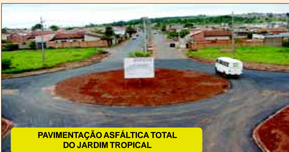
PAVIMENTAÇÃO ASFÁLTICA TOTAL DO JARDIM TROPICAL