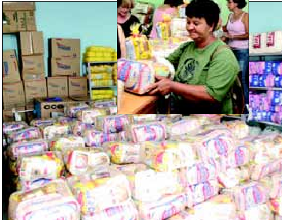
Cestas de natal destinada a distribuição e no destaque, uma cidadã beneficiada