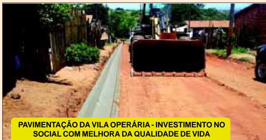
PAVIMENTAÇÃO DA VILA OPERÁRIA - INVESTIMENTO NO SOCIAL COM MELHORA DA QUALIDADE DE VIDA