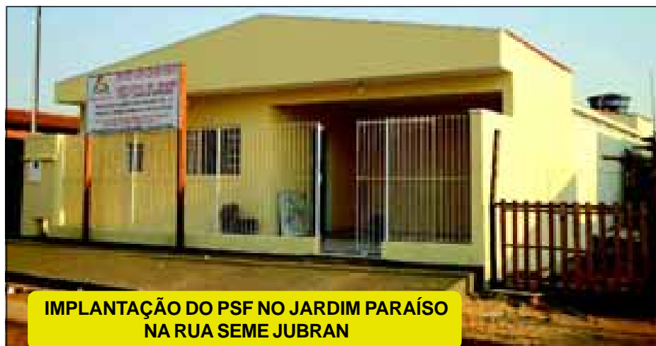
IMPLANTAÇÃO DO PSF NO JARDIM PARAÍSO NA RUA SEME JUBRAN