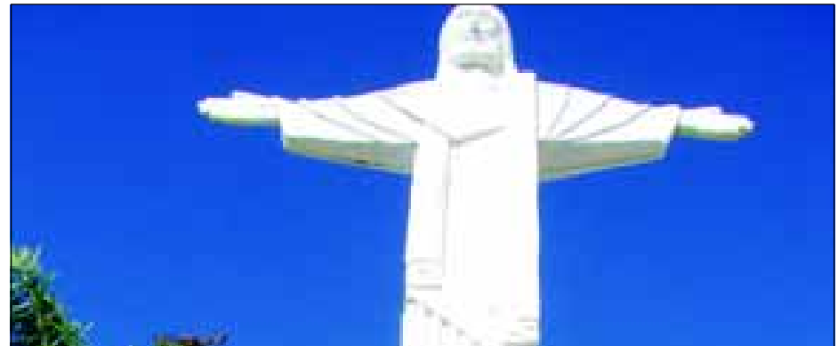
PAVIMENTAÇÃO DO ESTACIONAMENTO DA PRAÇA DA PAZ - BENEFICIOU O ACESSO AO CRISTO REDENTOR CONSTRUÍDO EM 1998