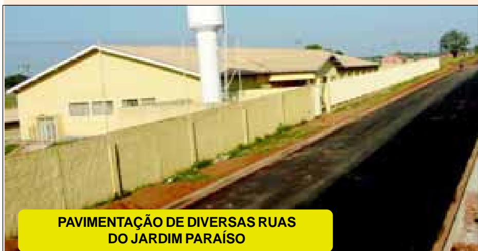
PAVIMENTAÇÃO DE DIVERSAS RUAS DO JARDIM PARAÍSO